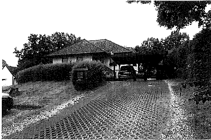
Straßenansicht mit Wohnhaus und Doppelcarport aus nördlicher Richtung von der Martha- Brautzsch- Straße.

in 06647 Gemeinde Finneland, OT Kahlwinkel