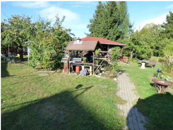
Bild 11: Blick in den Garten nach Nordosten mit Gartenpavillon im Hintergrund