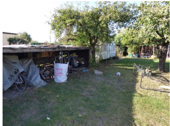
Bild 12: einfache Überdachungen und alter Wohnwagen an der westlichen Grundstücksgrenze