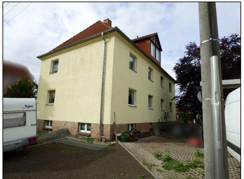
Abbildung 2 -Ansicht von Südosten