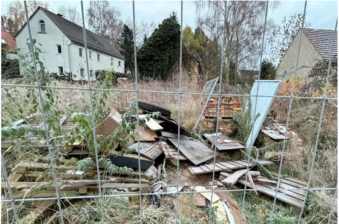
Abb. 9: Unrat / Baustoffe