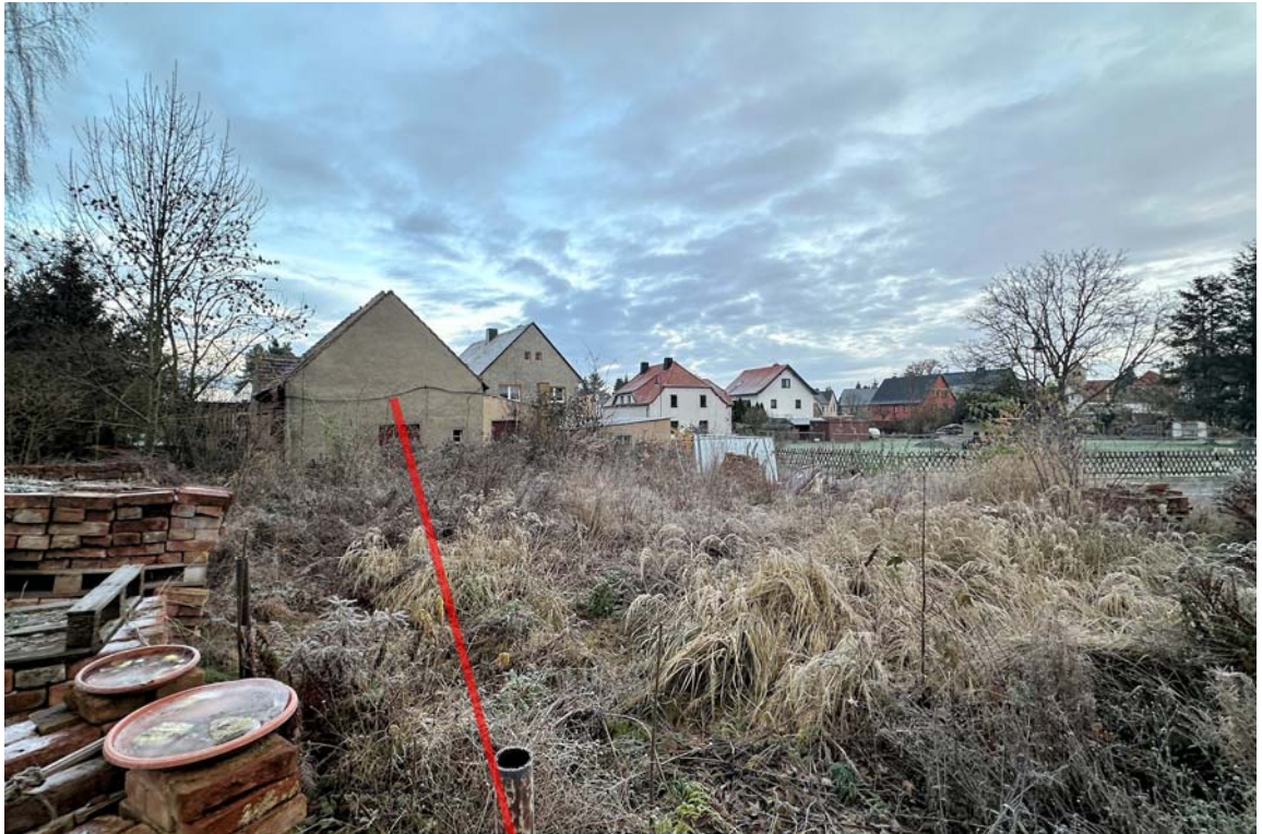
Abb. 5: Grundstücksansicht vom Nachbargrundstück, Blickrichtung Nordwesten