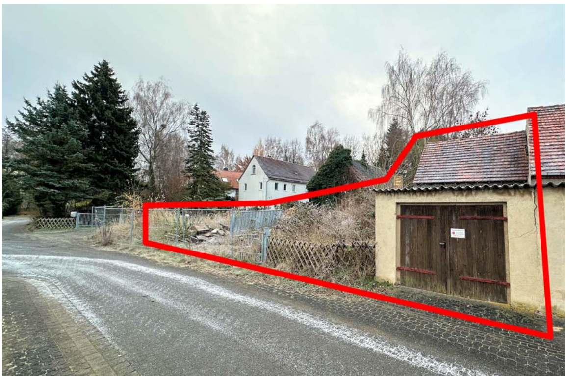
Abb. 2: Grundstücksansicht Friedensstraße 3, Blickrichtung Südosten