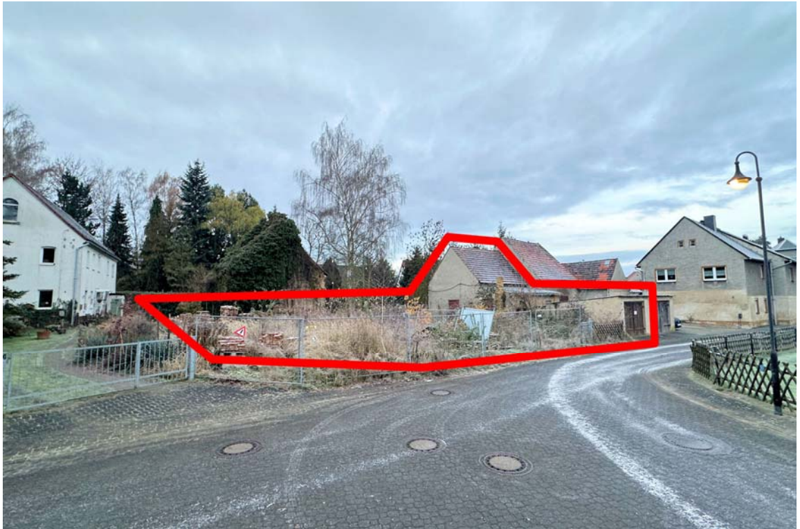
Abb. 1: Grundstücksansicht Friedensstraße 3, Blickrichtung Südwesten