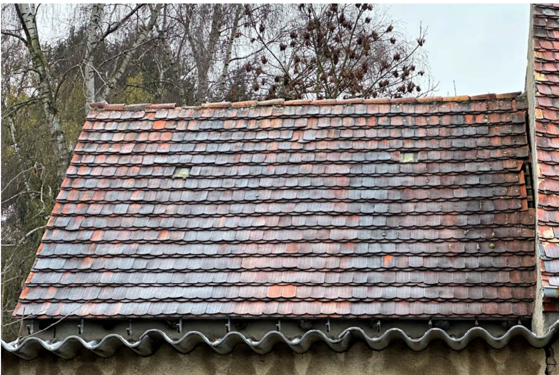
Abb. 4: ehem. Stall, Dacheindeckung teils fehlend