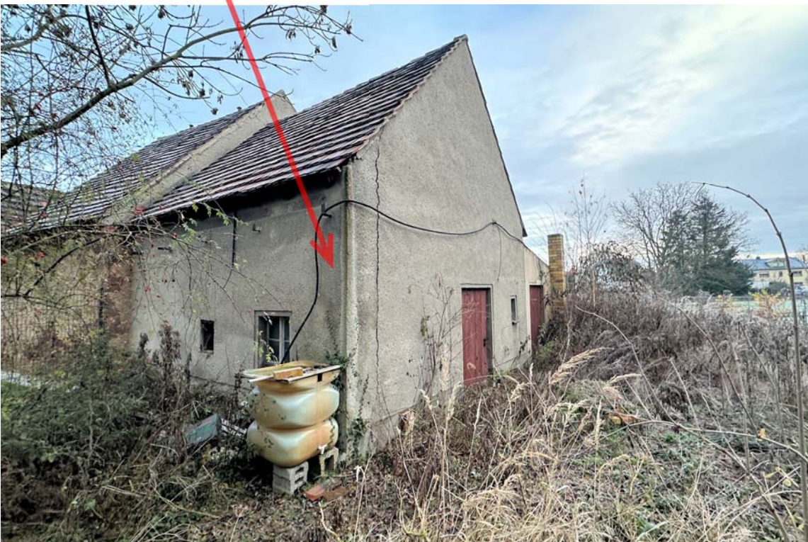
Abb. 8: Grundstücksansicht vom Nachbargrundstück, ehem. Stall