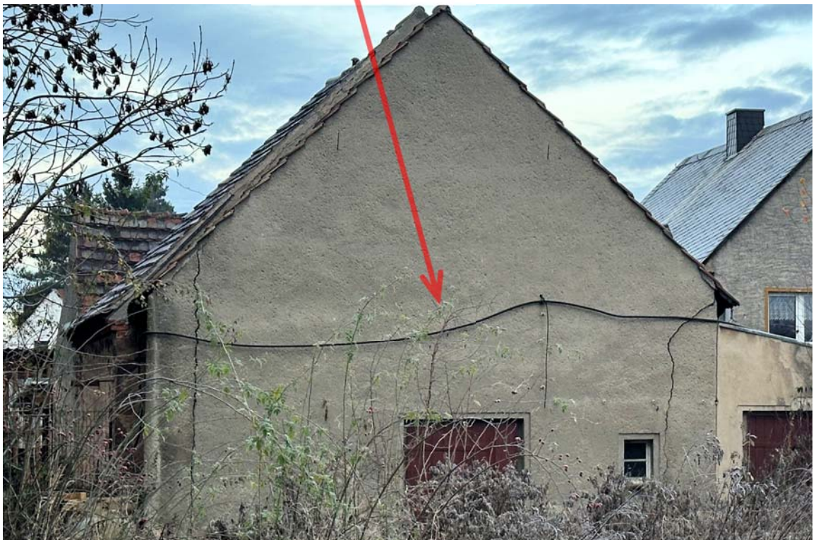
Abb. 6: Grundstücksansicht vom Nachbargrundstück, ehem. Stall, Detail Mauerwerksrisse