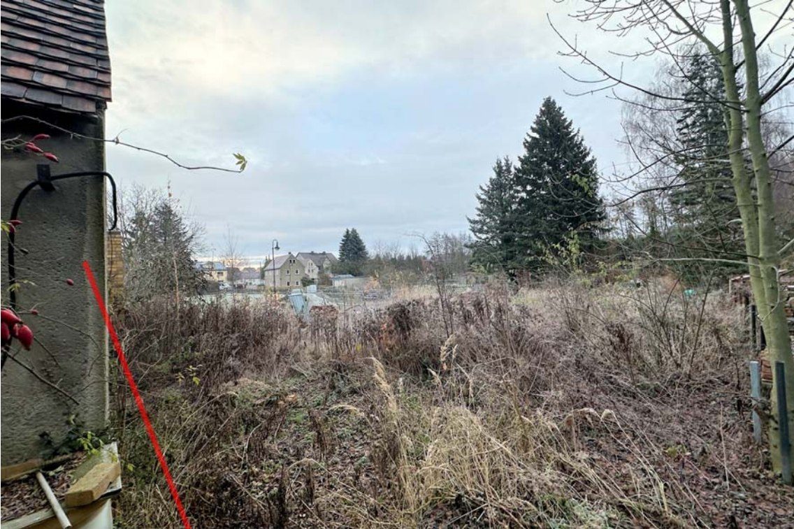
Abb. 7: Grundstücksansicht vom Nachbargrundstück, Blickrichtung Nordosten