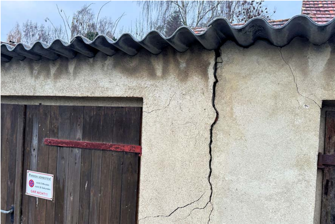
Abb. 3: Garage, Mauerwerksriss