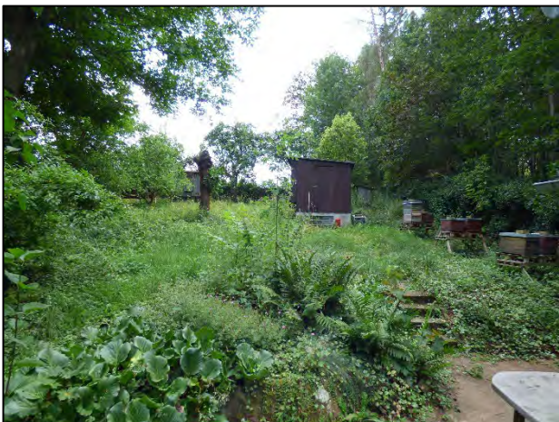
Foto 3: Blick in Richtung Süden über den Gartenbereich von der Terrasse des Gartenhauses aus