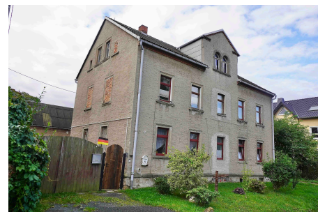
Wilsdruffer Straße 20 in Deutschenbora