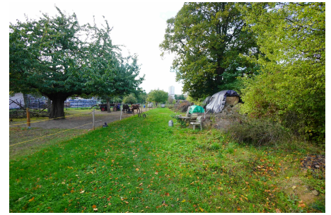
Pferdekoppel in Deutschenbora

Grundstück: Grundbuchamt Meißen, Grundbuch von Deutschenbora GBBl. 98; Flurstück 167/4; Größe 2.462 m 2