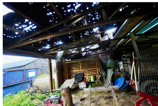
Grundstück mit desolatem Technikunterstand

Gartenland mit desolatem Technikunterstand