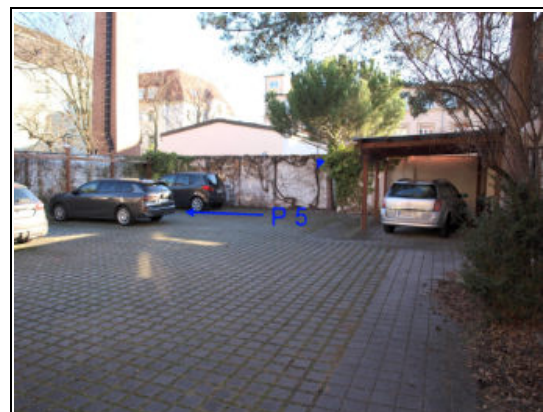
Sondernutzungsrecht am Stellplatz P 5 ge- kennzeichnet (vorletzter Platz links)