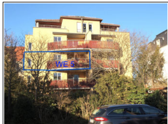
gartenseitige Rückansicht mit SE-Nr. 5 im 2. OG aus Richtung Südwest