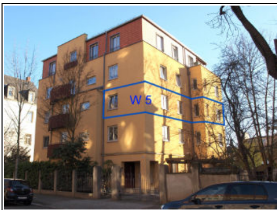
straßenseitige Ansicht mit SE-Nr. 5 im 2. OG rechts aus Richtung Norden