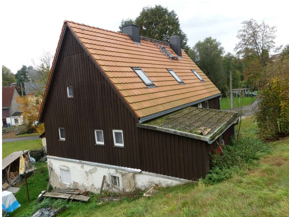
Foto 8: Rückseite Hauptgebäude mit neuer Dachdeckung und liegenden Fenstern