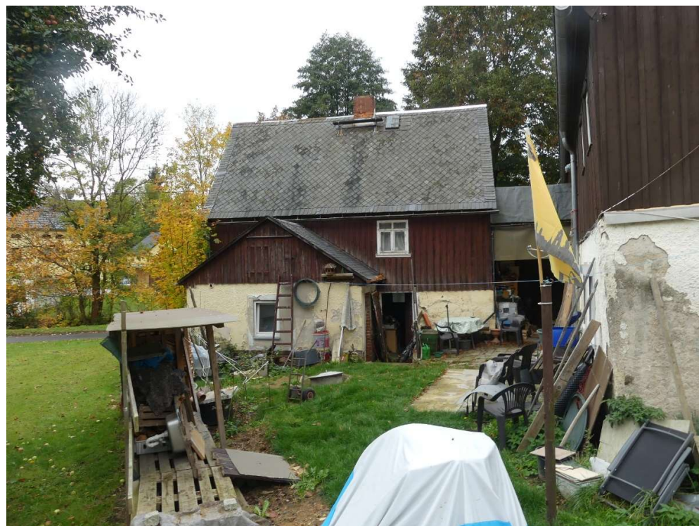
Foto 6: Rückseite altes Wohngebäude mit Waschhausanbau (Nebengebäude)