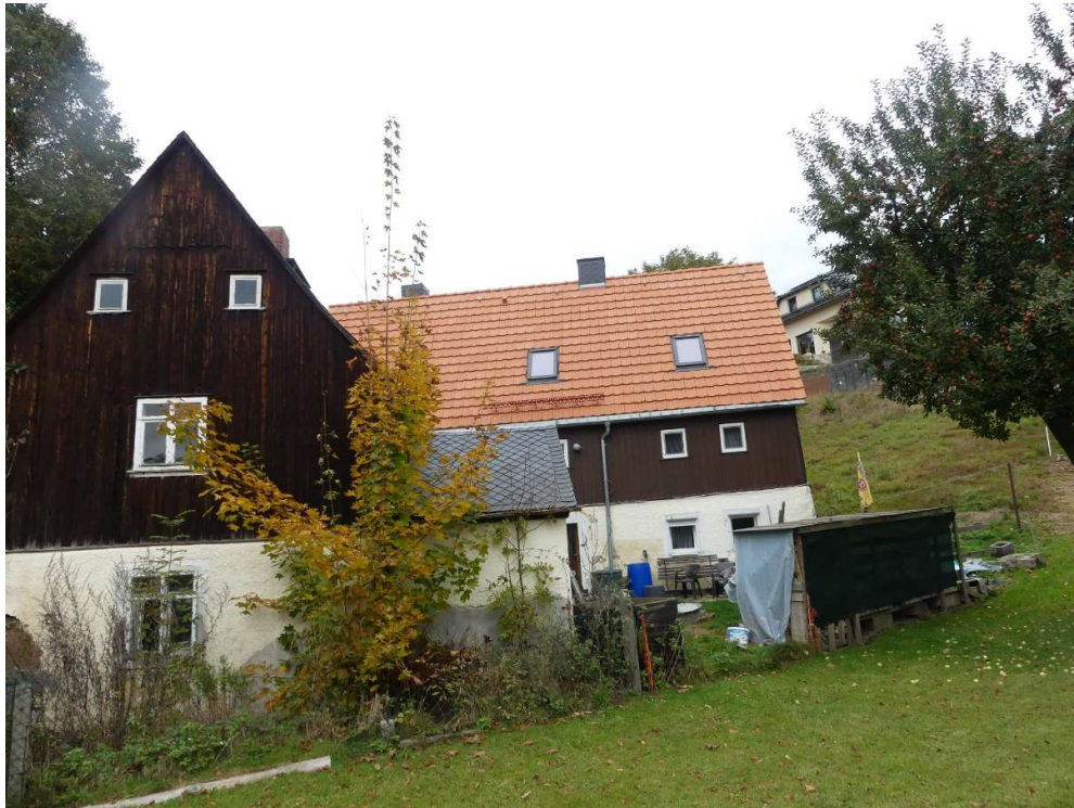
Foto 3: Ostgiebel altes Nebengebäude mit Waschhaus und Hofansicht Hauptgebäude