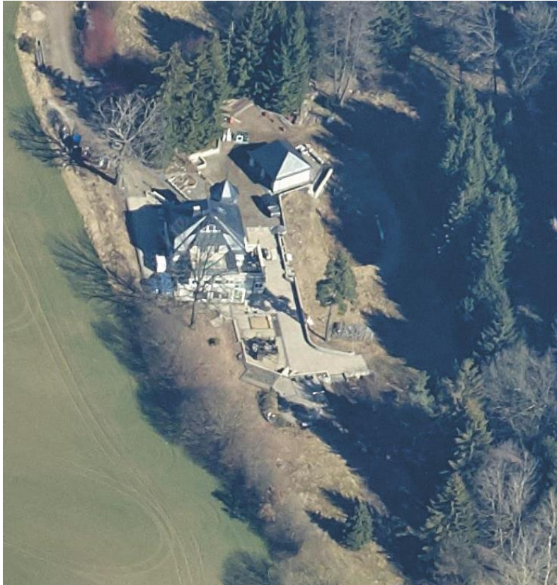
Blick von Süden