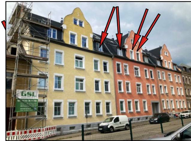
Straßenansicht Gebäude Südost