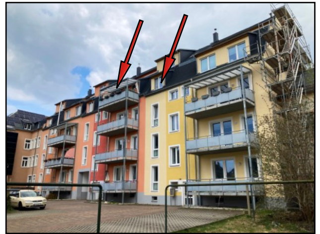
Hofansicht Gebäude Südwest