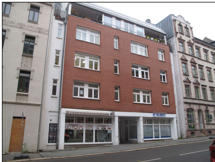
Vorderansicht des Wohn- und Geschäftshauses, TE Nr. 6 im 2. OG rechts