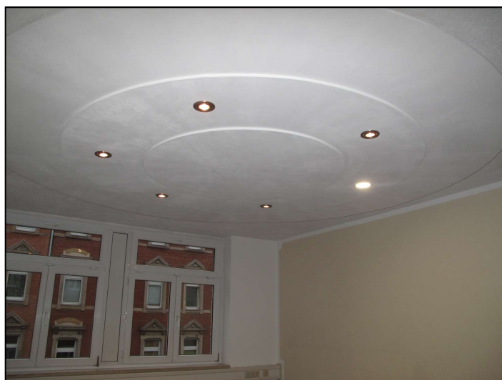
Büroraum mit attraktiver Beleuchtung