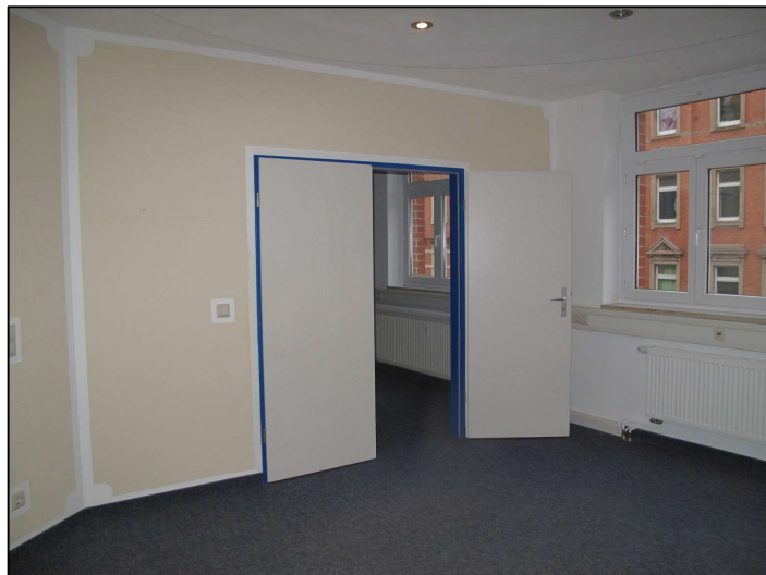
Büroraum mit Doppeltür und rollstuhlfester Auslegware