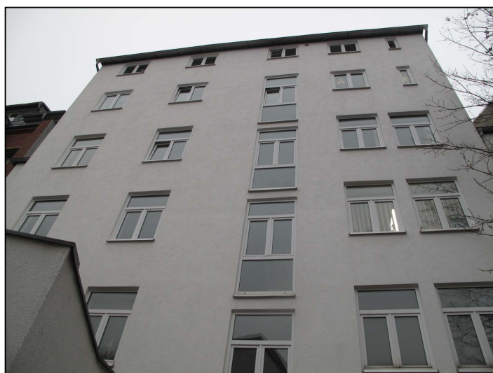
Gebäuderückseite; TE Nr. 6 im 2. OG links