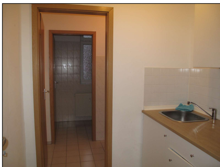
Teeküche und Zugang zum WC