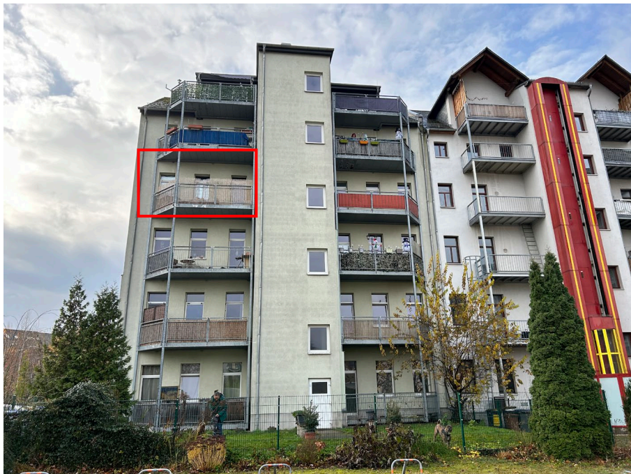
Abb. 02 Gebäuderückansicht und Lage der Wohnung WE 9 im 3.Obergeschoss, Norden