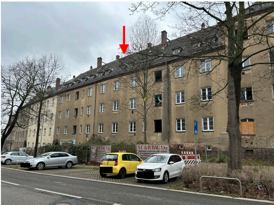
Abb. 02 Straßenansicht des Wohngebäudes von der Wartburgstraße aus, Osten