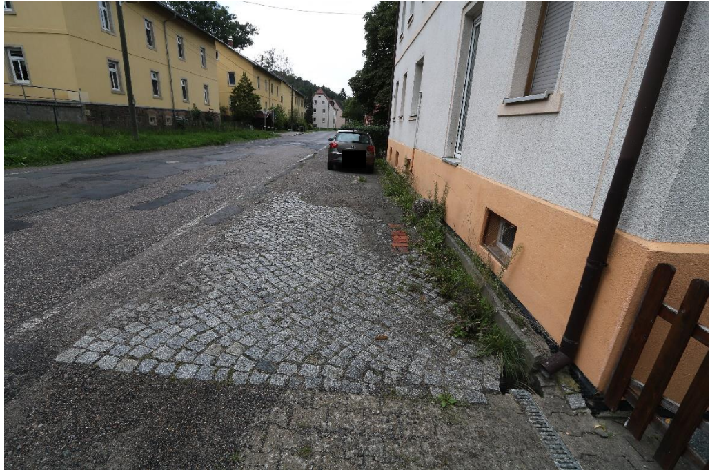
Bahnhofstraße nach NW