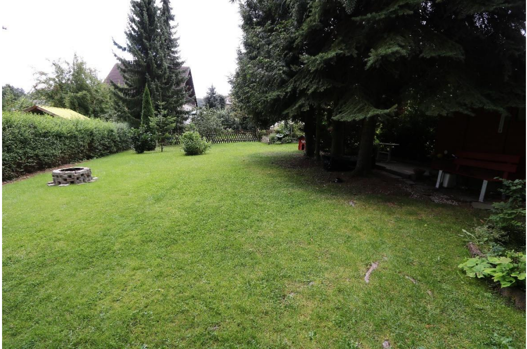
Blick in den Garten (nach SO)