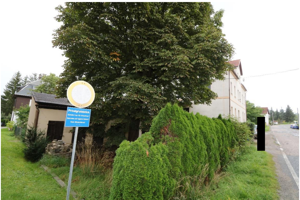
Bahnhofstraße nach SO