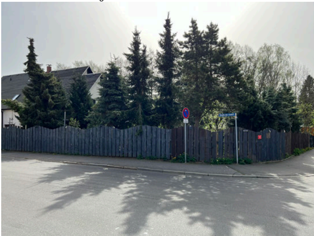
Blick aus nordwestlicher Richtung vom Kreuzungsbereich Straße der Einheit/Mühlweg

Von der Industrie- und Handelskammer Dresden öffentlich bestellter und vereidigter Sachverständiger für Bewertung von bebauten und unbebauten Grundstücken