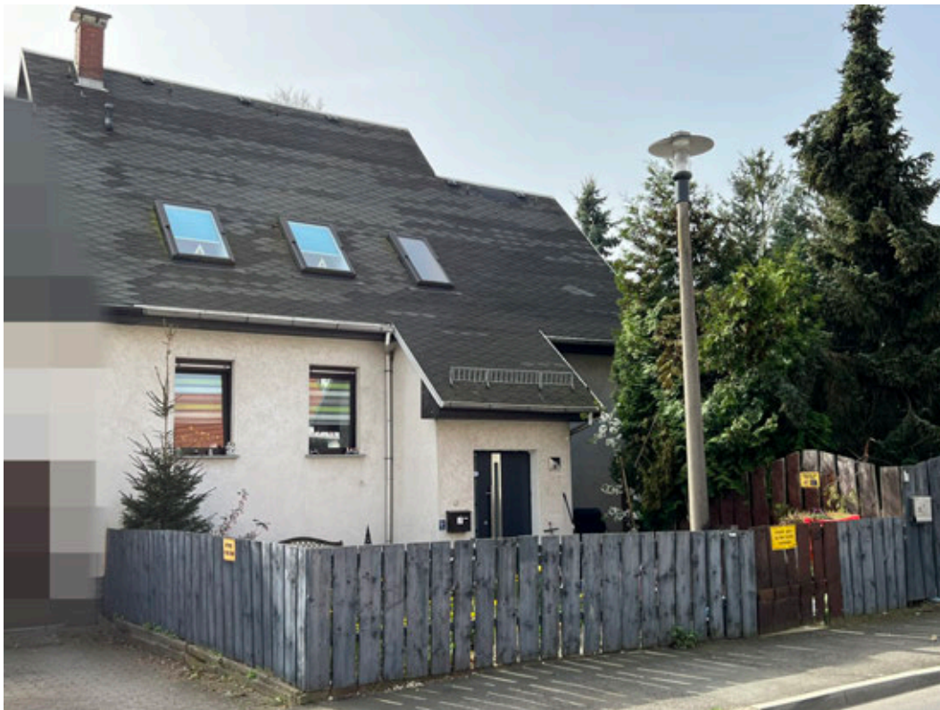
Blick aus nördlicher Richtung von der Straße der Einheit