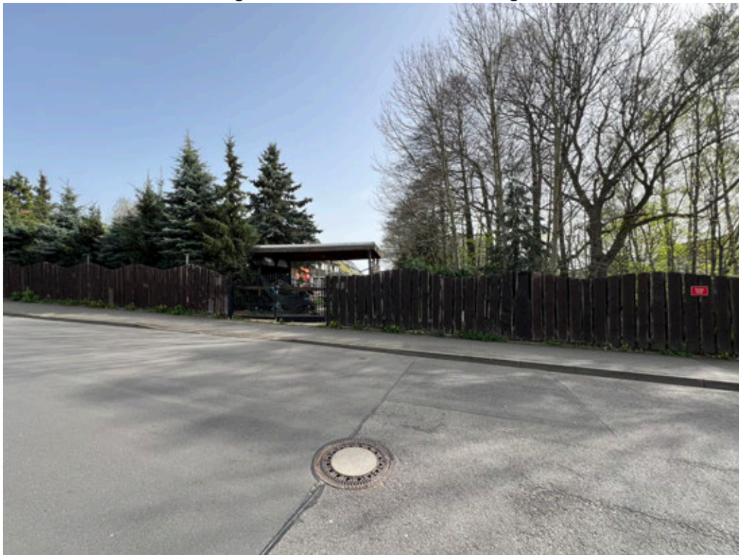
Grundstückszufahrt am Mühlweg

Von der Industrie- und Handelskammer Dresden öffentlich bestellter und vereidigter Sachverständiger für Bewertung von bebauten und unbebauten Grundstücken