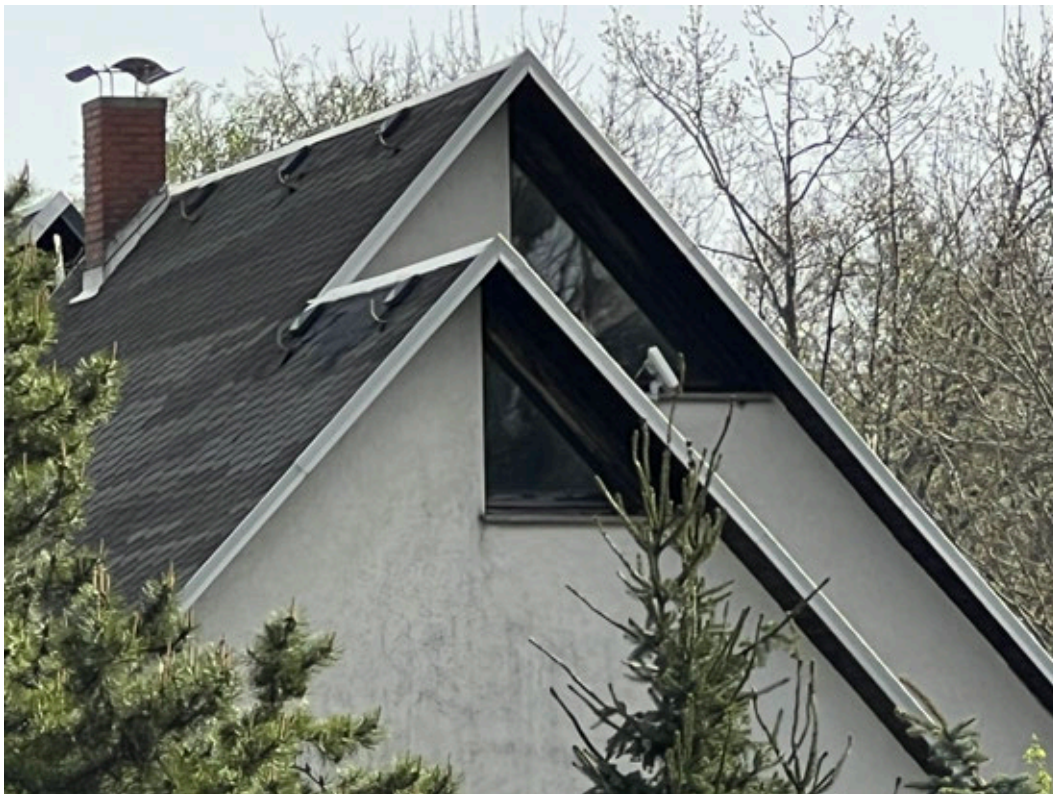
Westgiebel oberer Teil