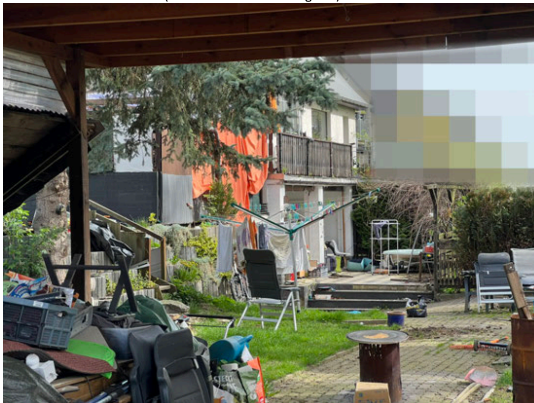
Grundstücksfreifläche mit Carport und Gartenseite des Wohnhauses

Von der Industrie- und Handelskammer Dresden öffentlich bestellter und vereidigter Sachverständiger für Bewertung von bebauten und unbebauten Grundstücken