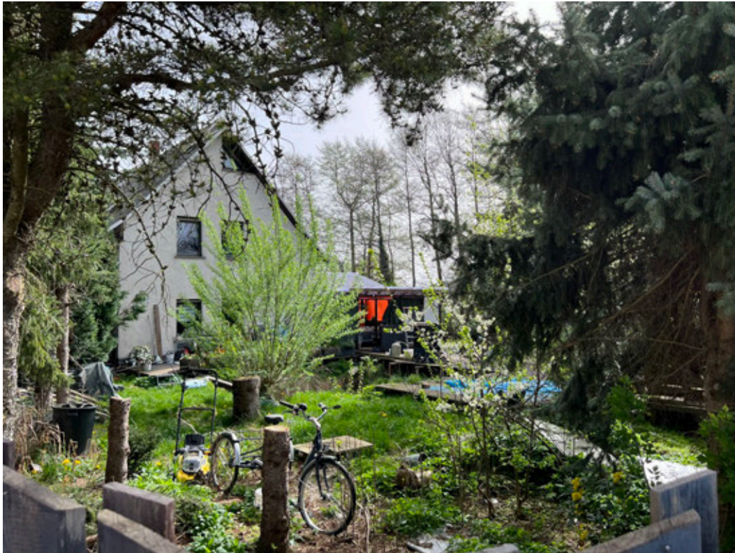
Blick aus westlicher Richtung mit dem Garten und dem Westgiebel