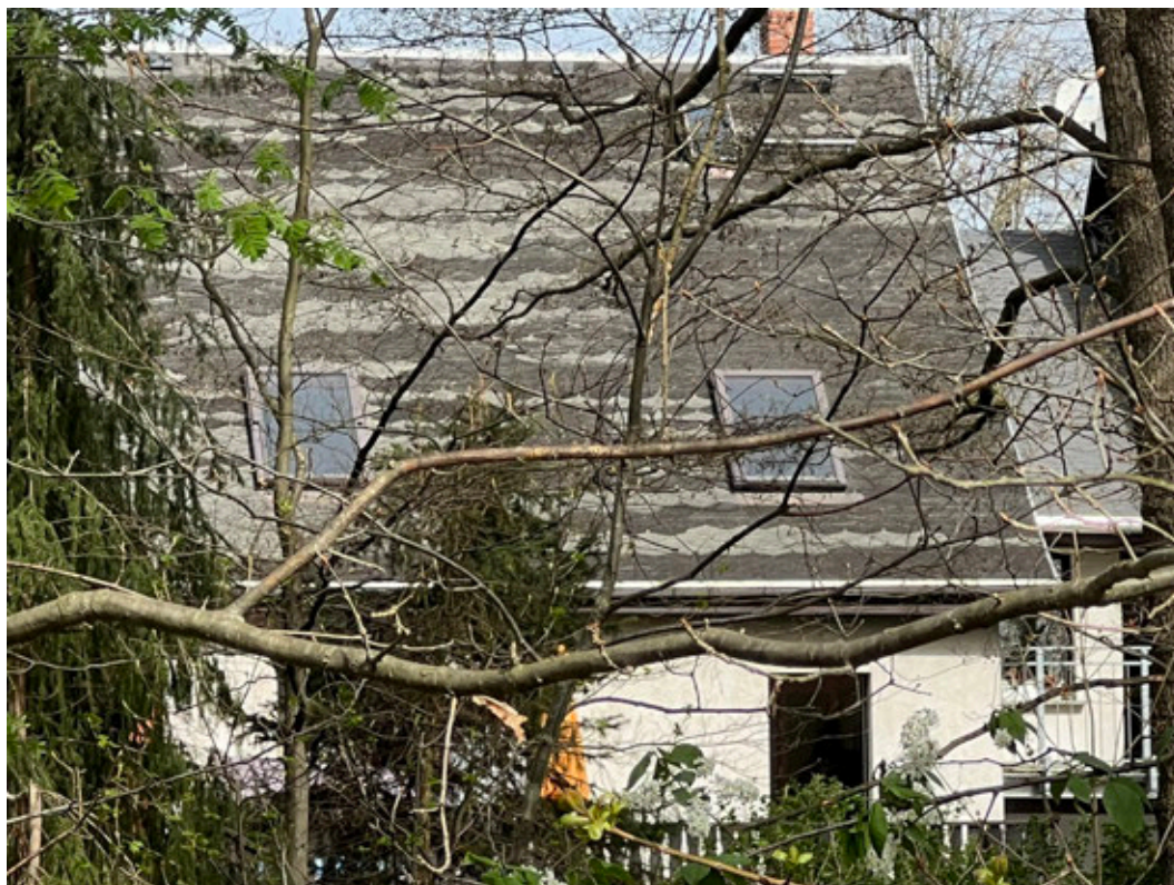
Südseite des Wohnhauses (Blick vom Goldbachweg aus)