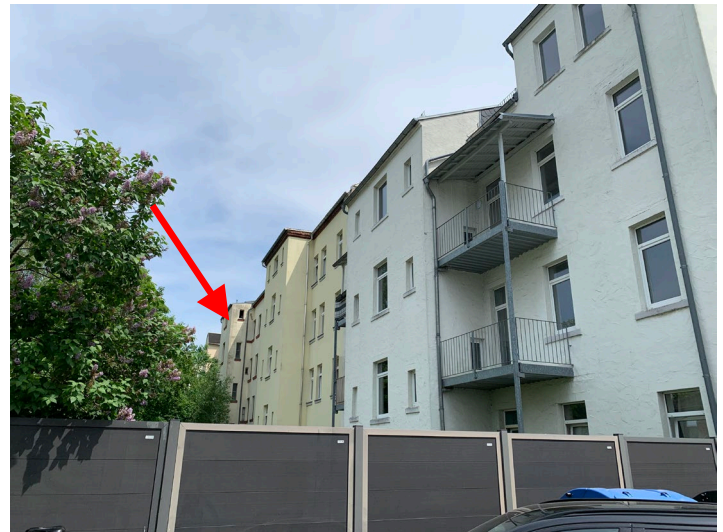
Abb. 02 Teilansicht Gebäuderückseite