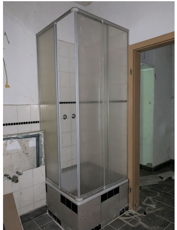
Abb. 06 Wohnung WE 2, Teilansicht des Bades mit Dusche