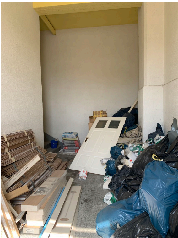
Abb. 03 Teilansicht Hausflur im Erdgeschoss