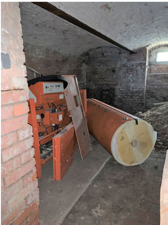
Abb. 10 Teilansicht Heizraum mit ehemaliger Gasheizungsanlage