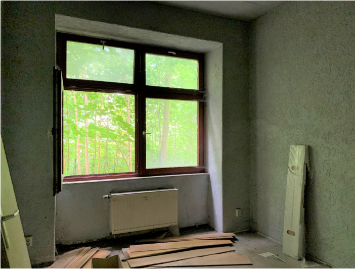
Abb. 05 Wohnung WE 2, Teilansicht Wohn-/Schlafzimmer