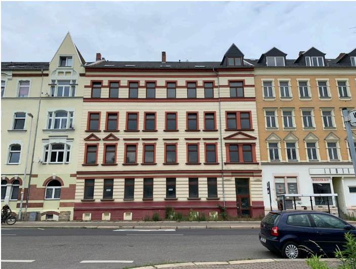
Abb. 01 Straßenansicht des Wohngebäudes, Osten