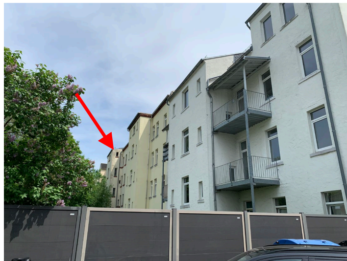
Abb. 02 Teilansicht Gebäuderückseite