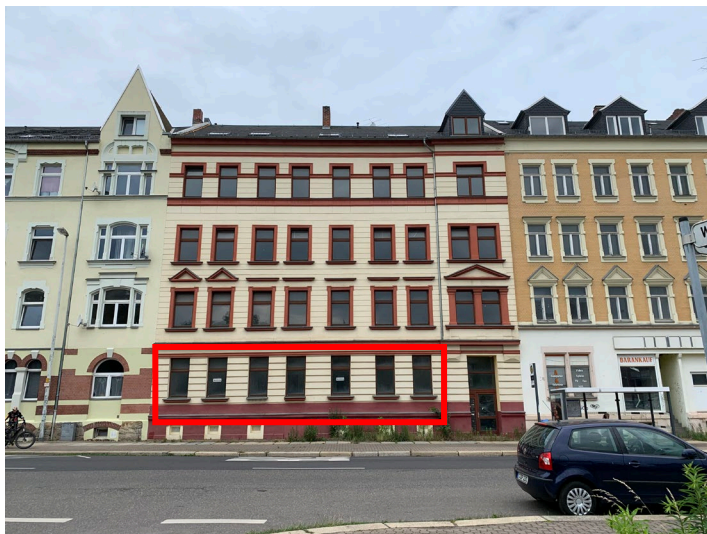
Abb. 01 Straßensicht des Wohngebäudes und Lage der Wohnung Nr. 1 im Erdgeschoss, Osten