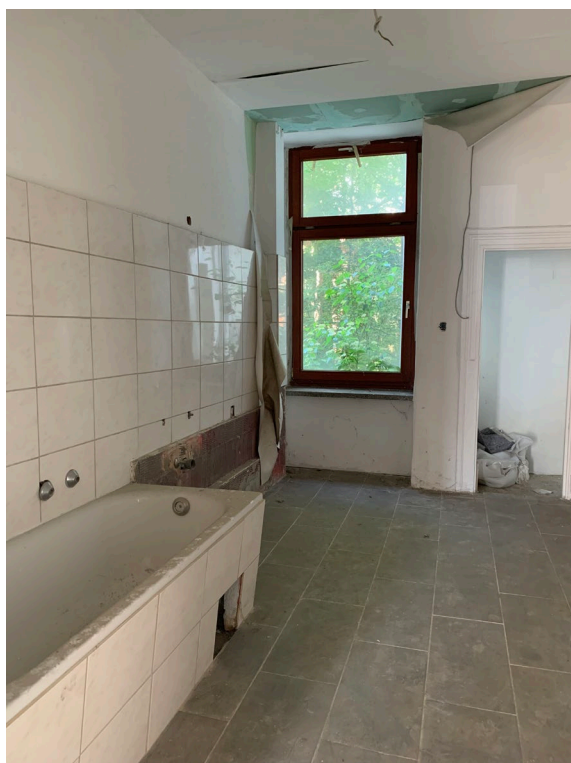
Abb. 10 Wohnung WE 1, Teilansicht des Bades