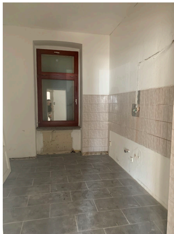
Abb. 09 Wohnung WE 1, Teilansicht der Küche