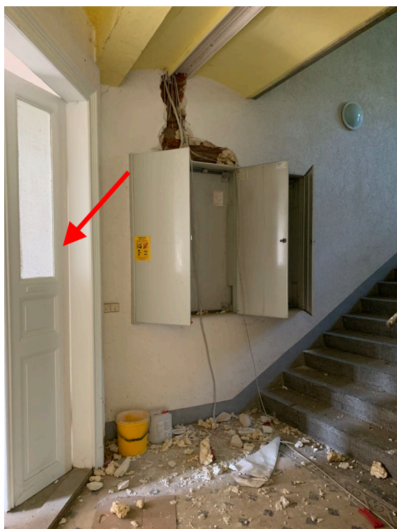
Abb. 04 Teilansicht Treppenhaus im Erdgeschoss mit ehemaliger Elt-Verteilung und Eingang Wohnung WE 1, links im Bild