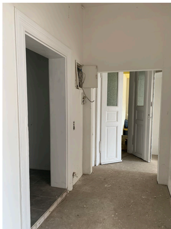
Abb. 05 Wohnung WE 1, Teilansicht des Flures