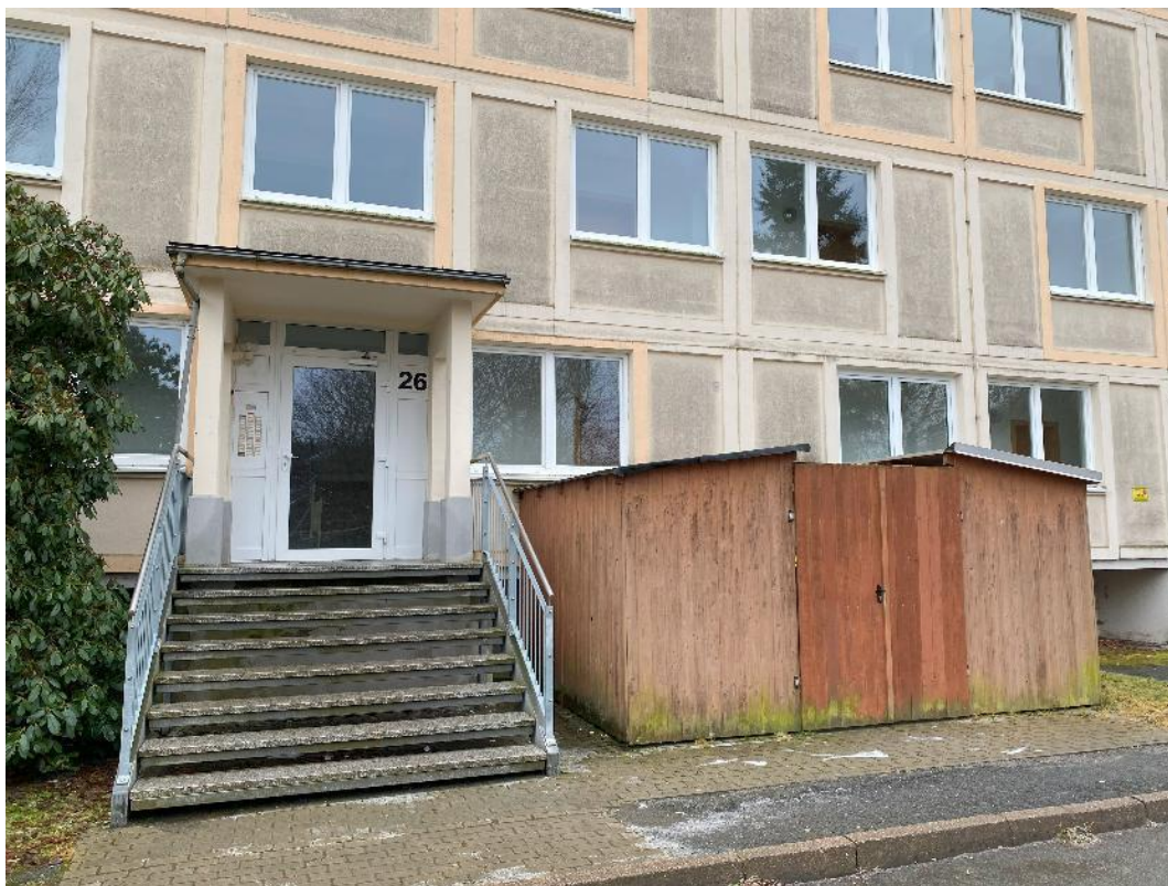
Bild 9, Hauseingangsbereich mit eingehaustem Mülltonnenplatz