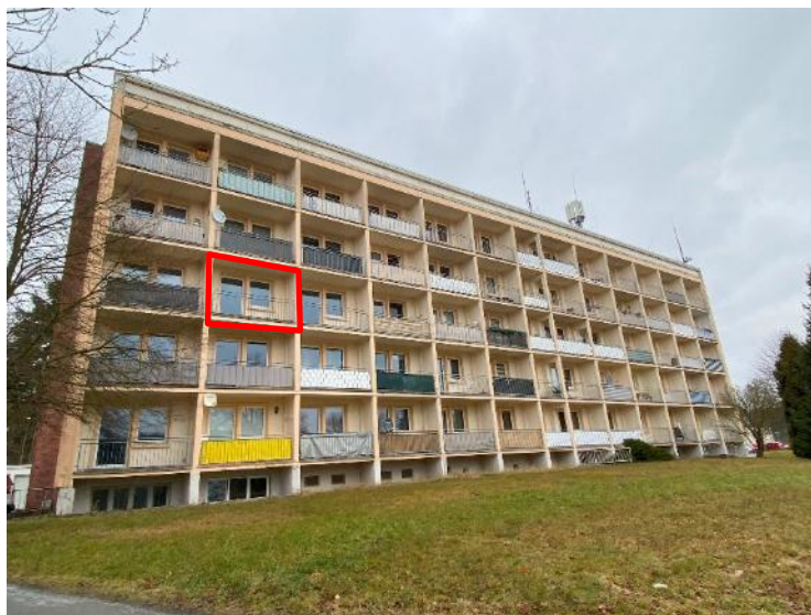
im Zwangsversteigerungsverfahren Az: 11 K 158/24

Der Verkehrswert wird zum Wertermittlungsstichtag 06.02.2025 geschätzt mit rd.