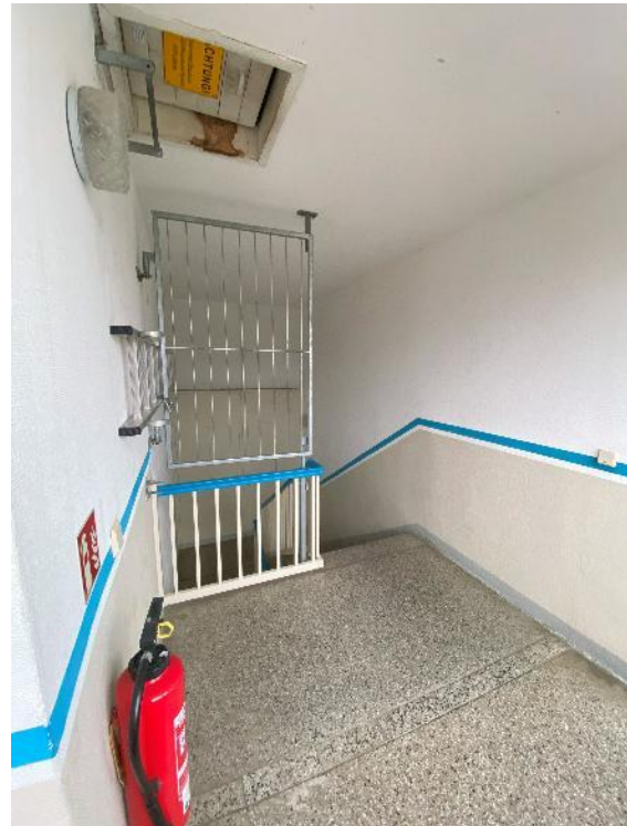
Bilder 15 und 16, oberstes Treppenpodest mit Dachausstiegs Luke