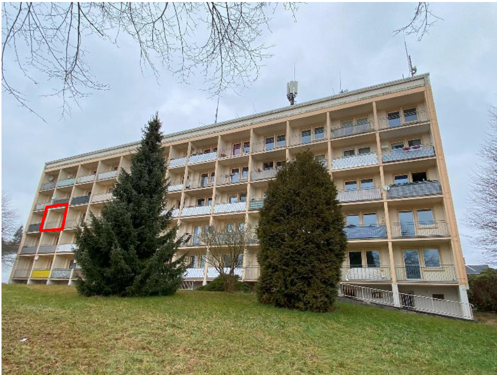
Bild 2, Straßenansicht von Süden mit Kennzeichnung der Lage der zu bewertenden Wohnung Nr. 33