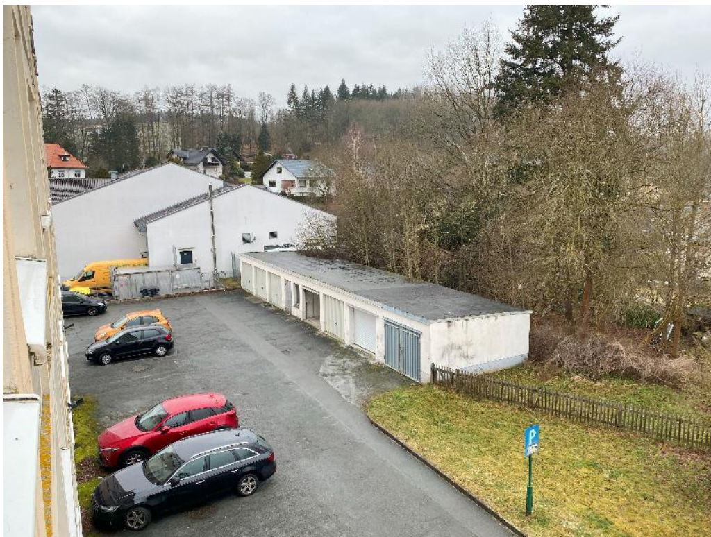
Bild 20, Blick aus dem Fenster (vom der Wohnung Nr. 33 vorgelagertem Flur) nach Westen zum Anlieferbereich des angrenzenden Lebensmittelmarktes, die Garagen befinden sich nicht auf dem Bewertungsgrundstück