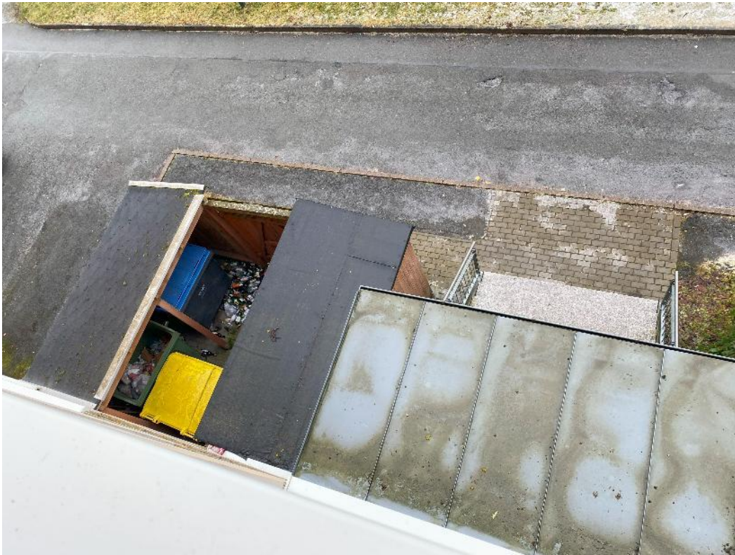
Bild 19, Blick vom Treppenhaus auf den Hauseingangsbereich mit Mülltonnenplatz