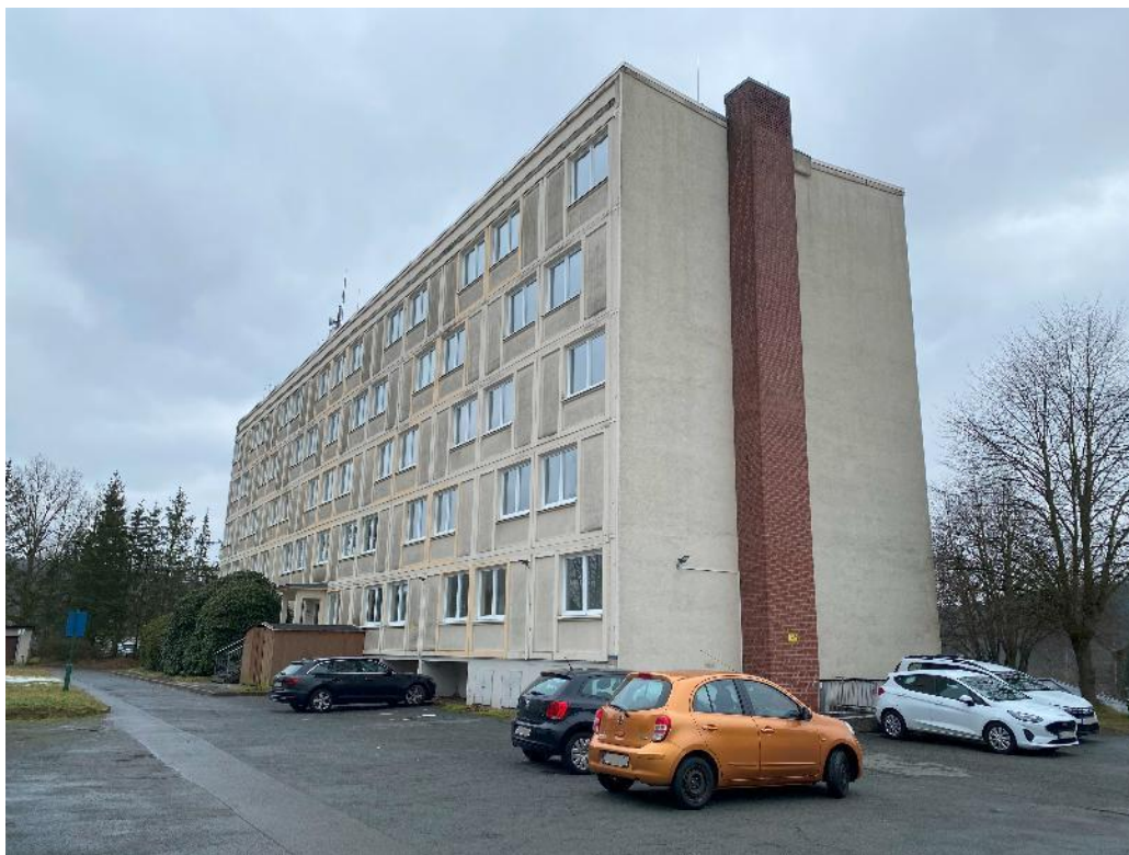
Bild 7, Ansicht der Gebäuderückseite mit Hauseingangsbereich von Nord-Westen