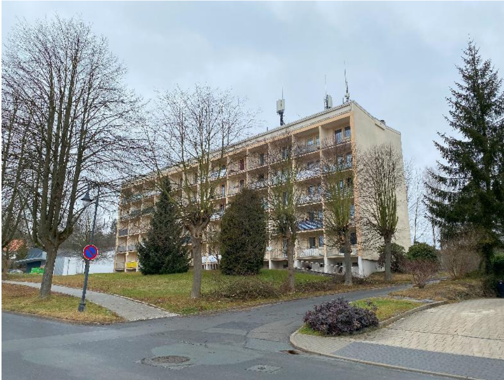
Bild 1, Ansicht des Gebäudes Hagerstraße 26 mit Zufahrt von der Straße