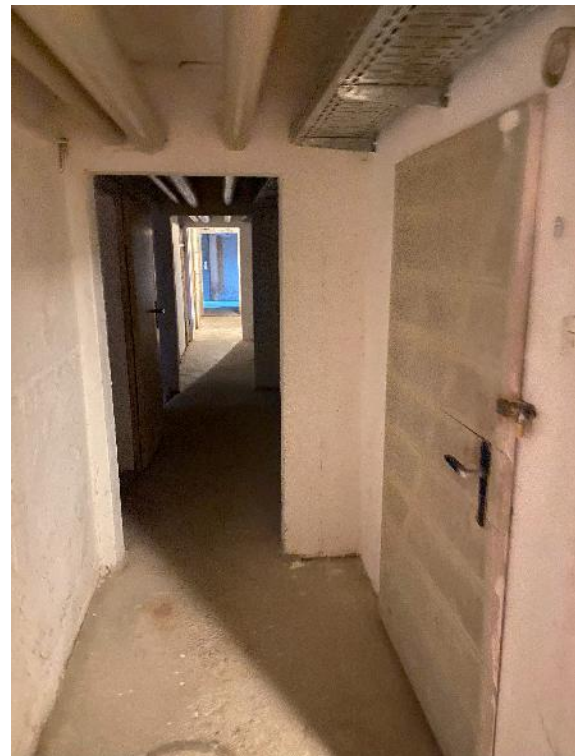
Bild 18, Kellerflur