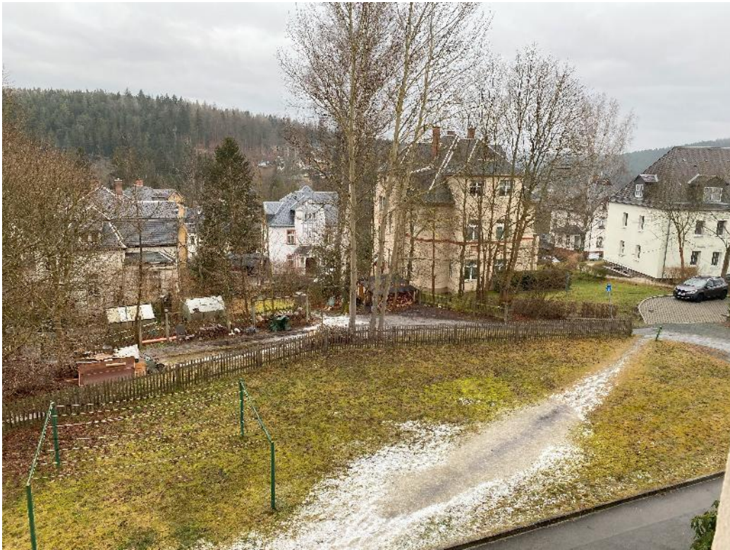
Bild 21, Blick aus dem Fenster (vom der Wohnung Nr. 33 vorgelagertem Flur) nach Nord-Osten