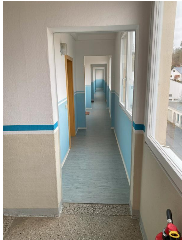
Bild 12, vom Treppenhaus abgehender Flur zu den Wohnungen