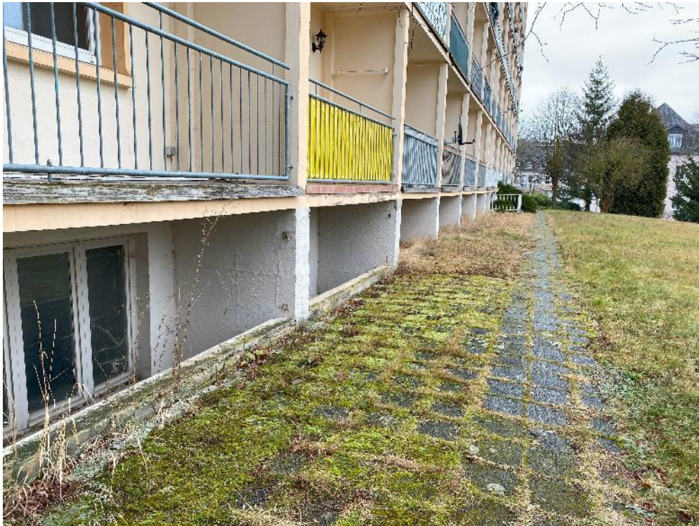
Bild 5, Weg entlang der straßenseitigen Gebäudelängsseite