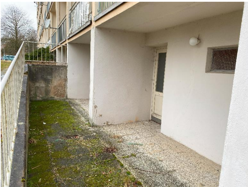
Bild 6, Zugang zum Fahrradraum