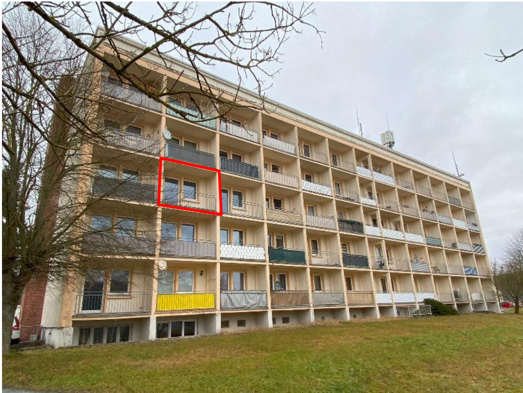
Bild 3, Ansicht von Süd-Westen mit Kennzeichnung der Lage der zu bewertenden Wohnung Nr. 33