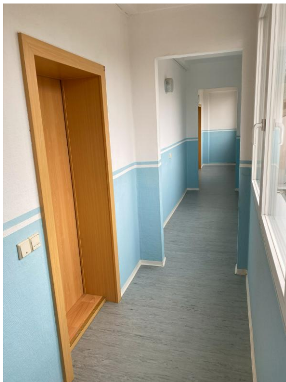
Bild 13, Wohnungseingangstür zur Wohnung Nr. 32 im 2. OG links, über die augenscheinlich auch der Zugang zur Wohnung Nr. 33 erfolgt