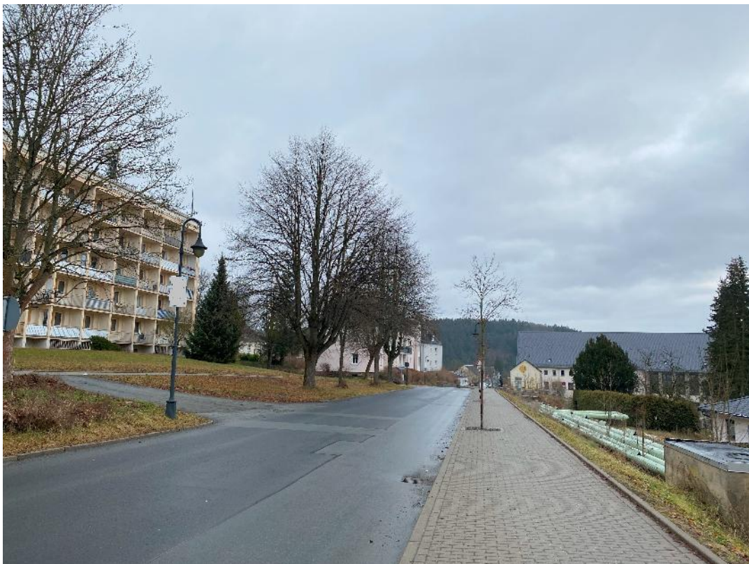
Bild 22, Blick in die Hagerstraße in Richtung Osten