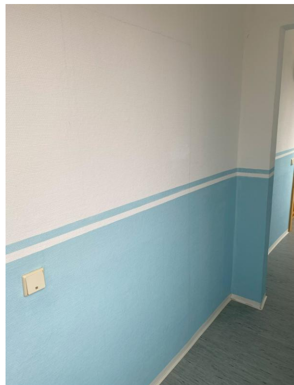
Bild 14, baulich geschlossene Wohnungseingangstür zur Wohnung Nr. 33