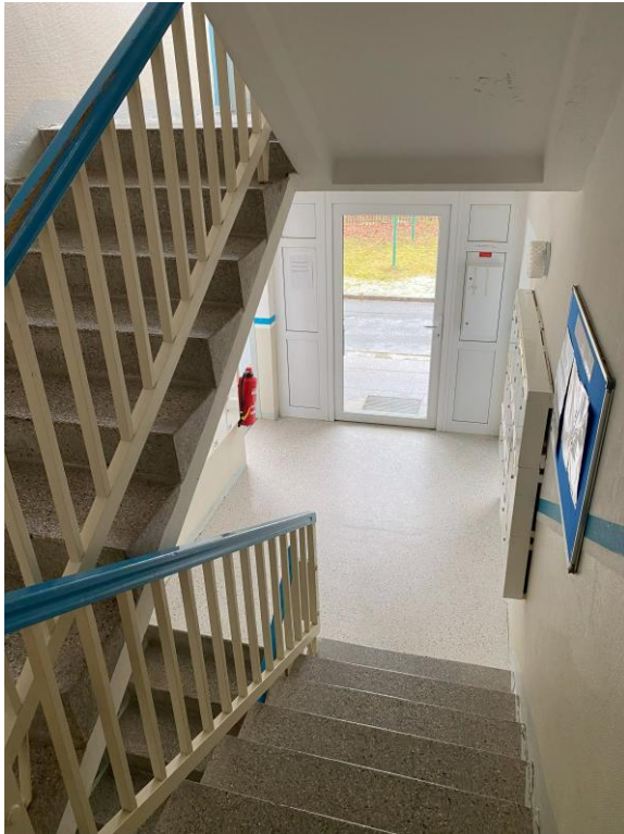
Bild 11, Treppenhaus