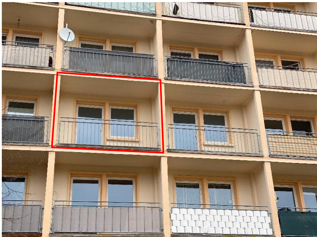
Bild 4, Loggia der Wohnung Nr. 33