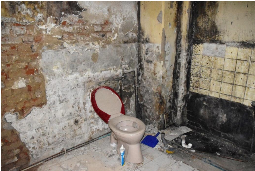
Zimmer im Erdgeschoss