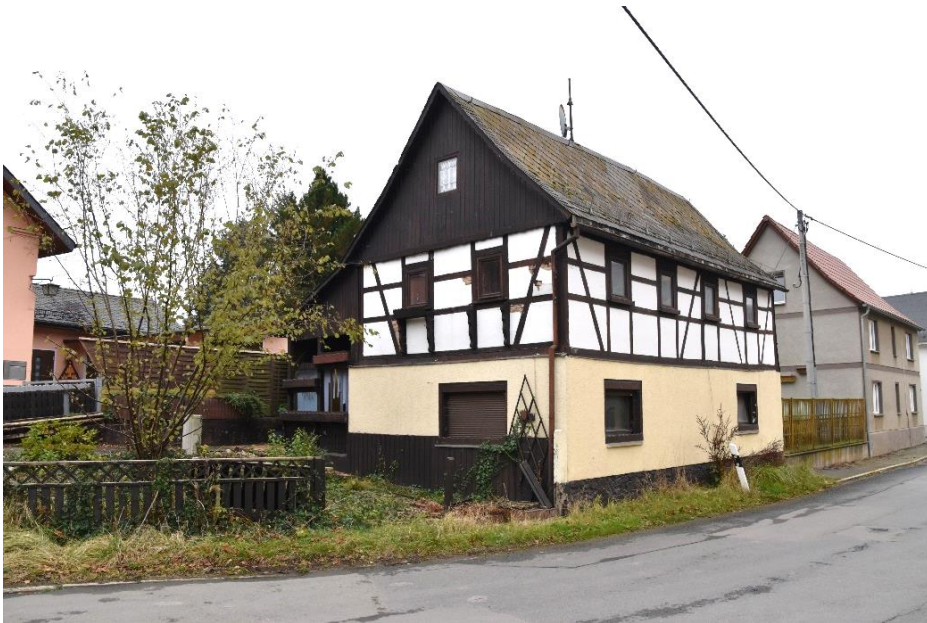
Blick auf die Einfahrt und die Freifläche des Grundstückes