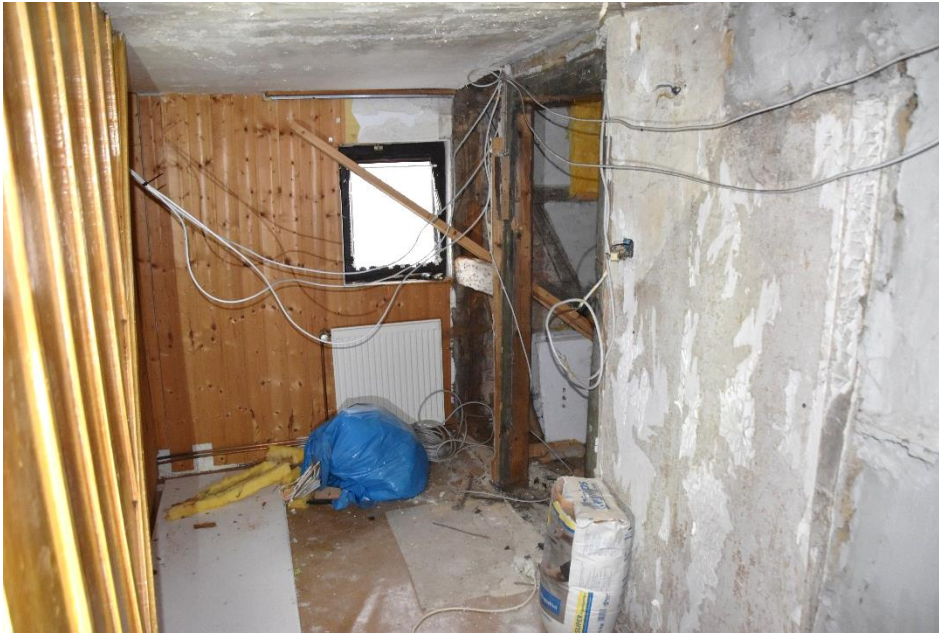
Zustand eines Holzbalken vom Fachwerk im Obergeschoss