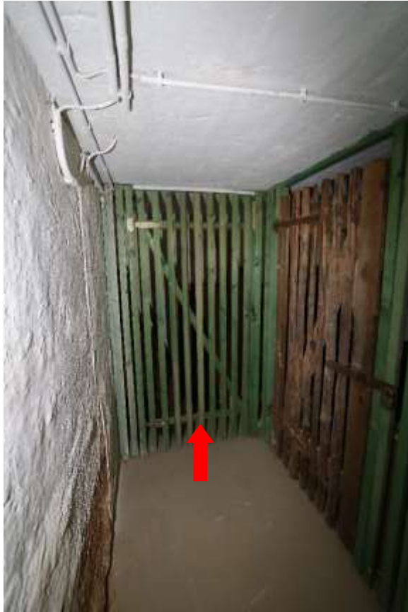
KG, Keller Nr.1