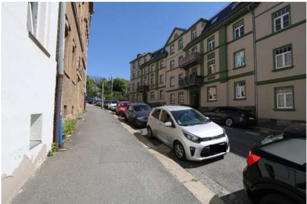
Robert-Koch-Straße nach SO