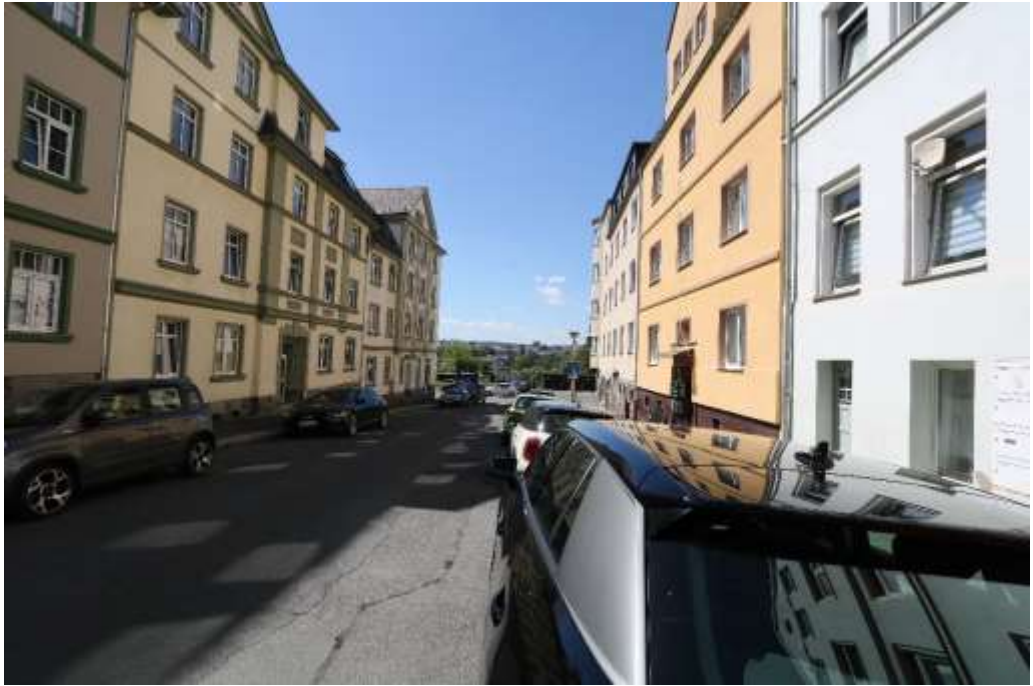
Robert-Koch-Straße nach NW