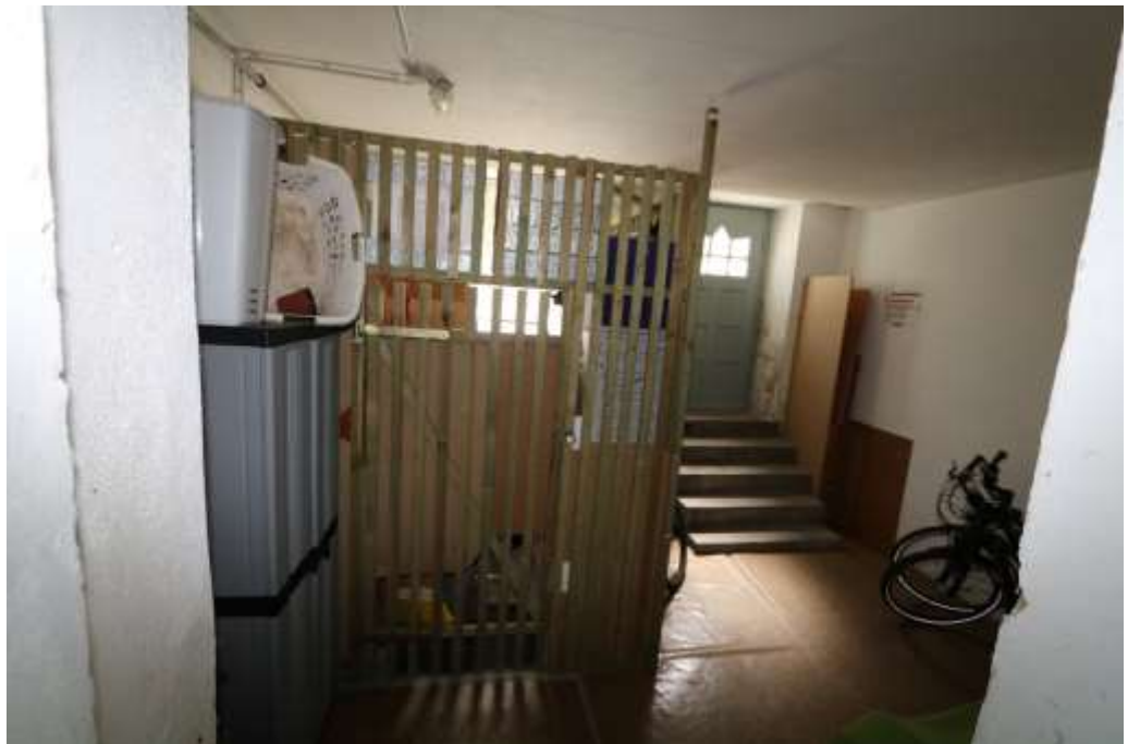
ehemaliges Waschhaus, jetzt Fahrradraum