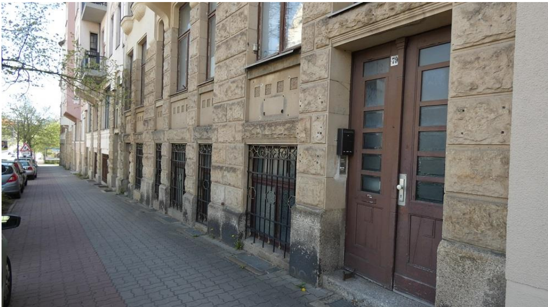
Blick auf den Hauseingangsbereich mit Fenstern des Kellergeschosses (Souterrain) und Erdgeschossbereich