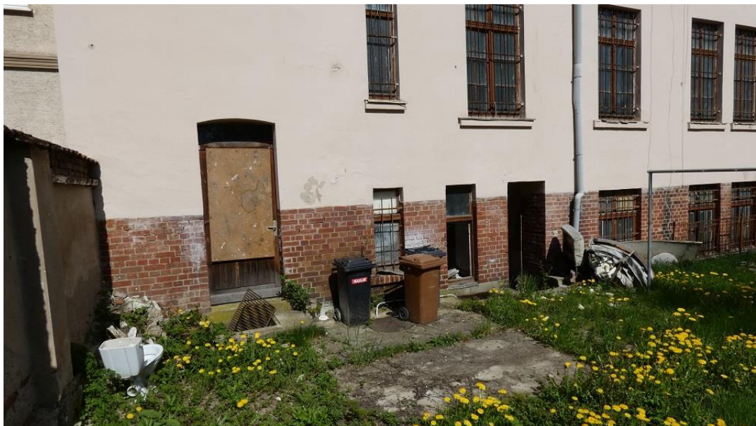
Blick auf die Hoftür