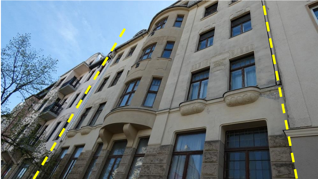
Weiterer Blick auf die Fassade von der Straßenseite aus fotografiert