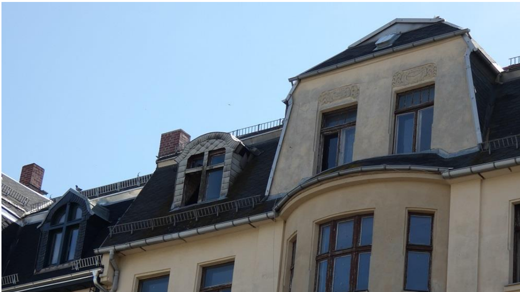
Detail Dachgeschoss (Straßenseite)