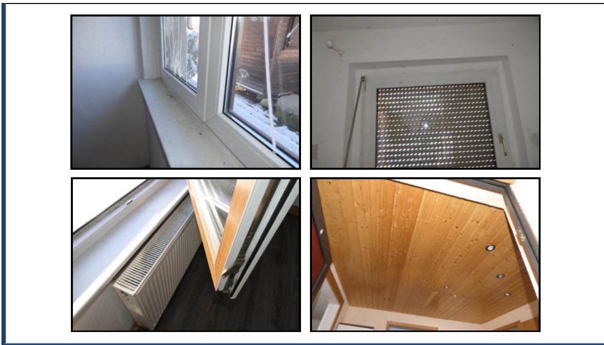
Abbildung 17: Detailansichten