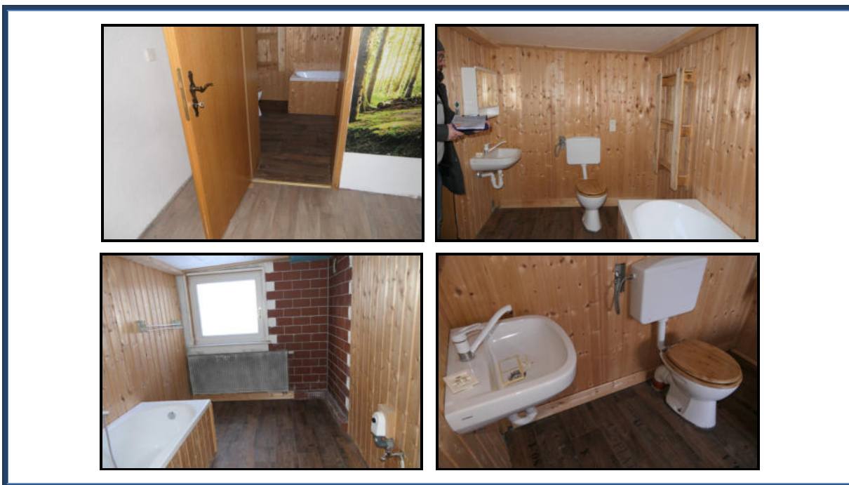
Abbildung 9: Badezimmer I