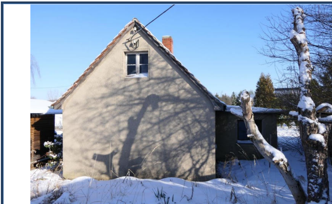
Abbildung 5: Giebelansicht (West-Ansicht); Außenanlagen