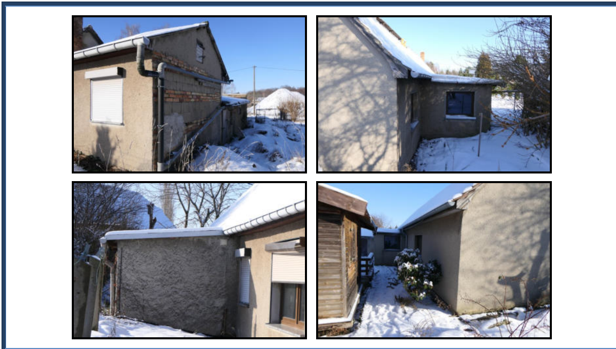
Abbildung 19: Detailansichten der Fassade (tlw. Fertigstellungsbedarf)