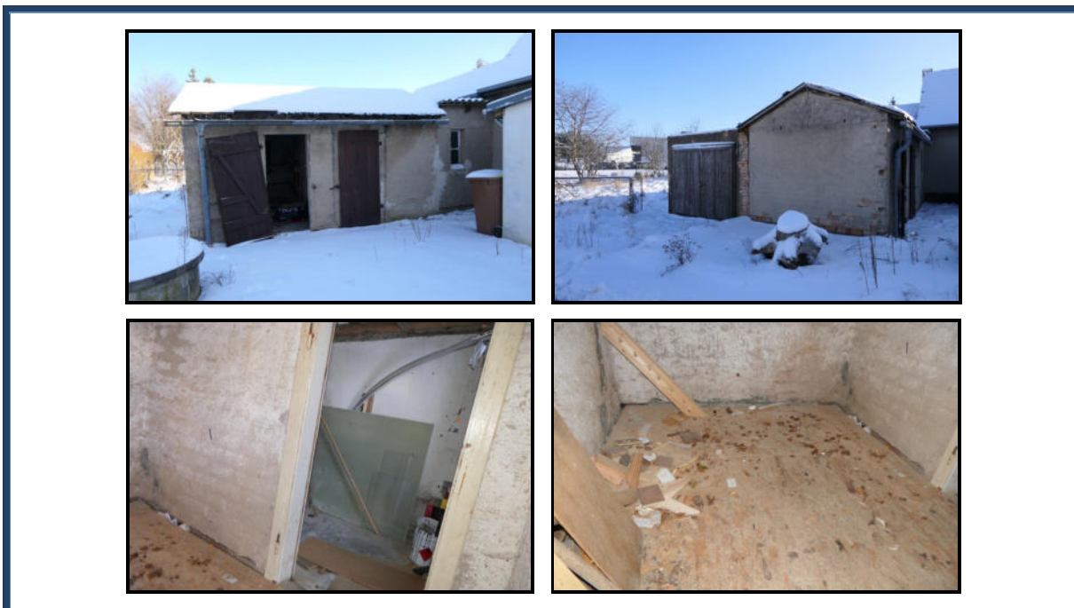
Abbildung 22: Detailansichten - Mehrzweckanbauten