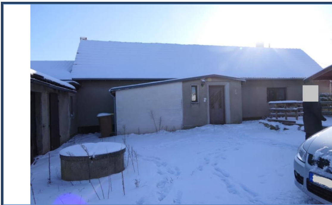
Abbildung 1: Vorderansicht (Nord-Ansicht); Hauseingangsbereich; links die Mehrzweckanbauten; Außenanlagen