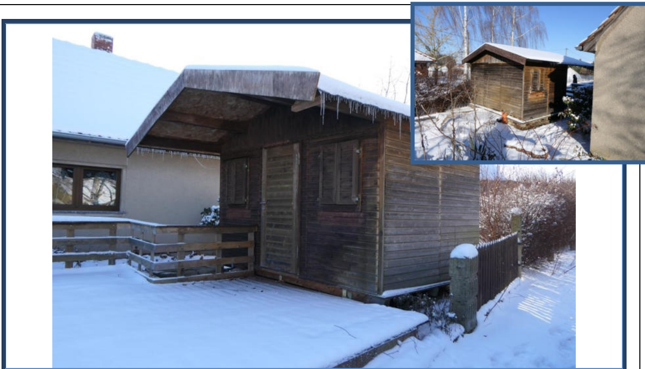
Abbildung 25: Ein handelsübliches Gartenhaus aus Holz mit angebauter Terrasse im nördlichen Grundstücksbereich (Überbauproblematik)