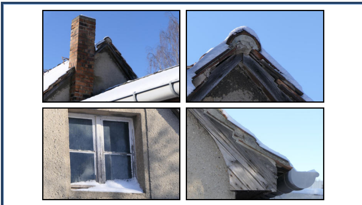
Abbildung 20: Detailansichten; tlw. verwitterte Holzbauteile