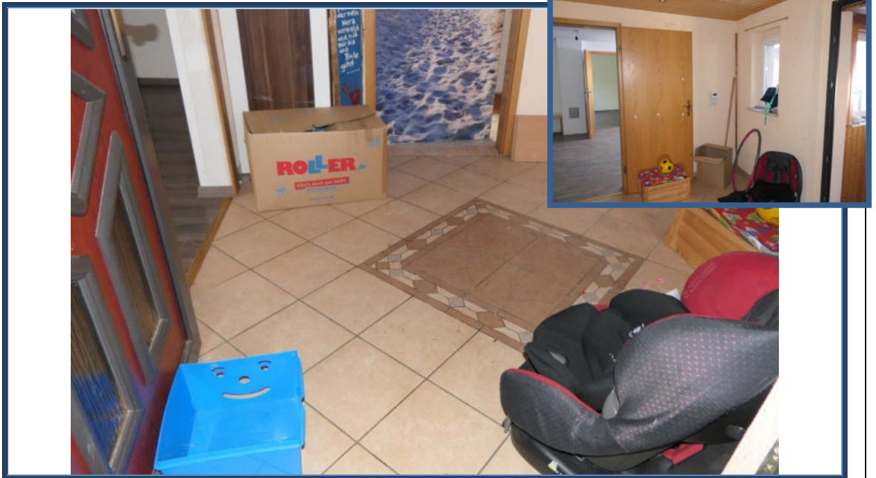
Abbildung 7: Flur