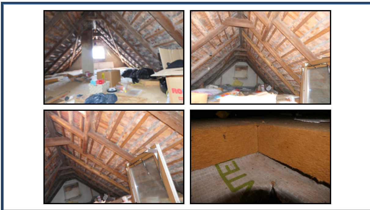
Abbildung 16: Spitzboden (Abstellboden)