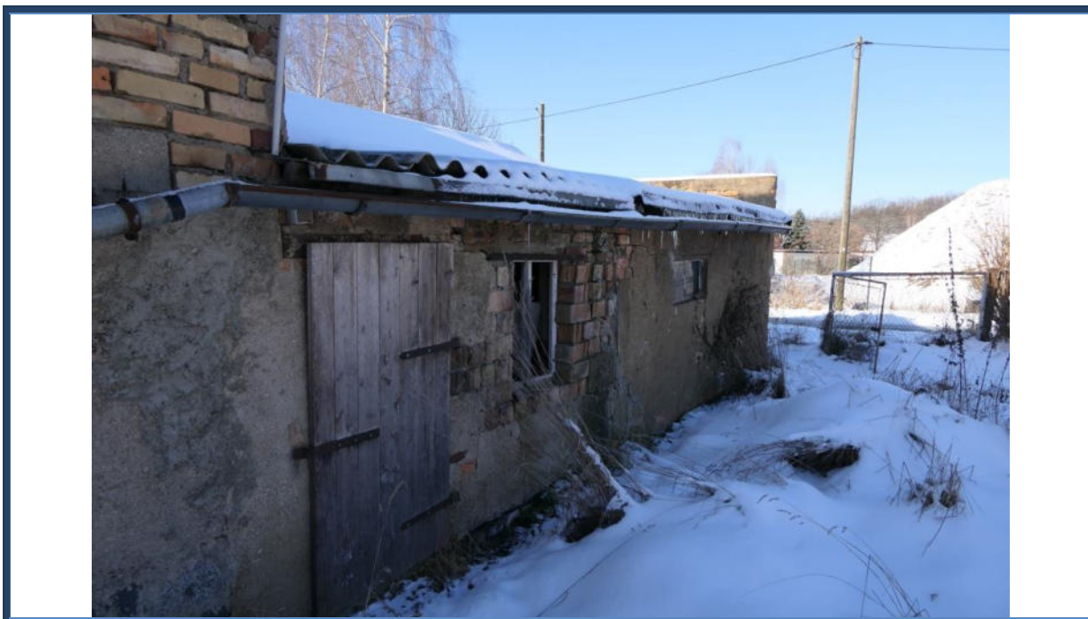
Abbildung 21: Mehrzweckanbauten