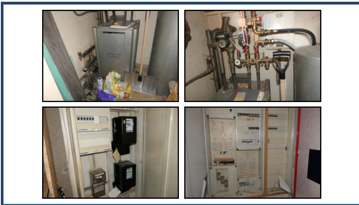
Abbildung 15: Detailansicht - Heizungsanlage und Elektroinstallation