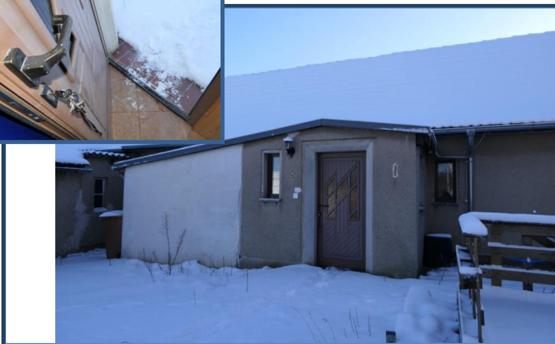
Abbildung 6: Hauseingangsbereich