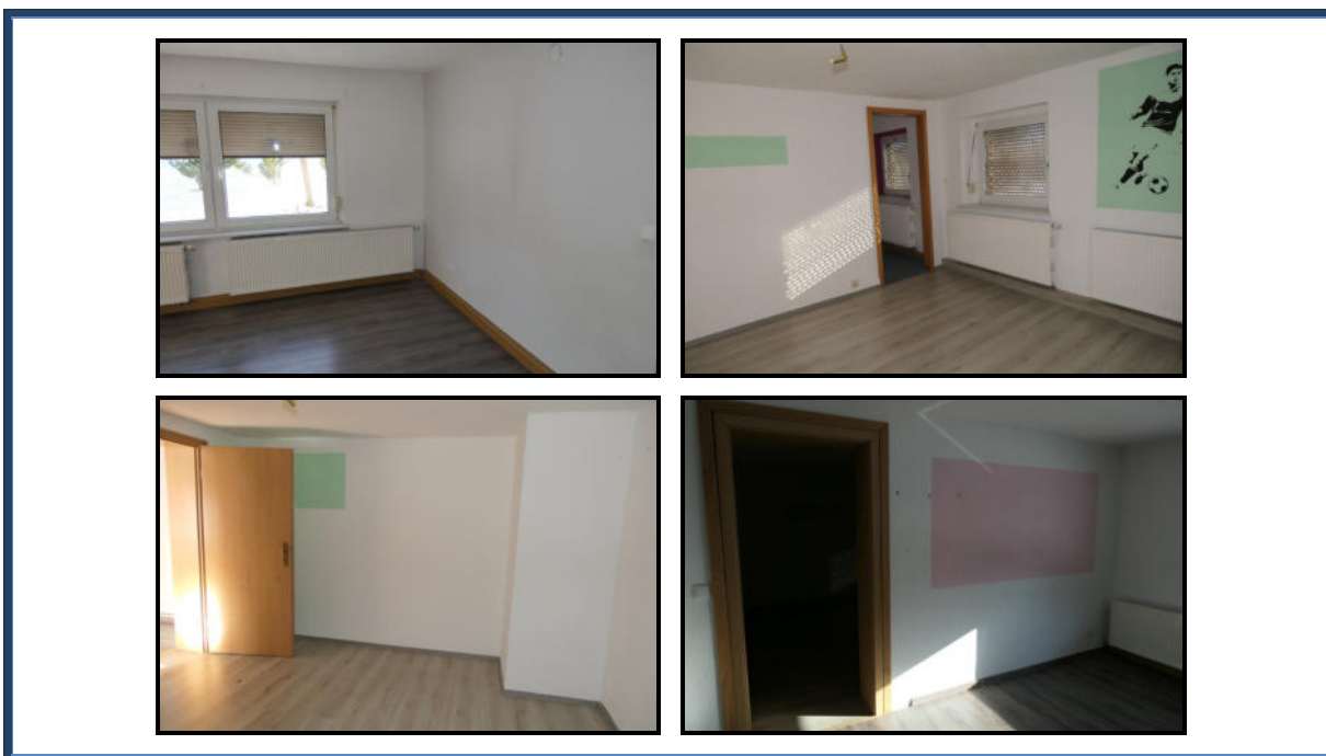
Abbildung 12: Wohnräume