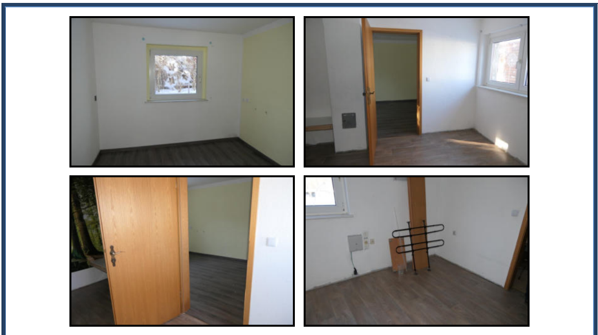
Abbildung 8: Wohnräume