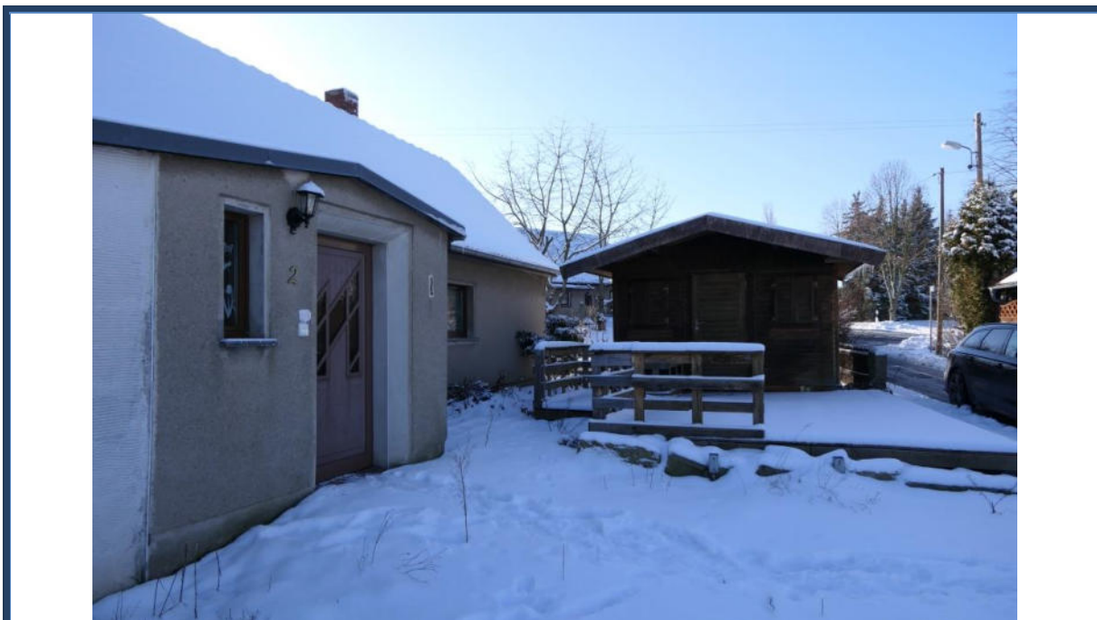
Abbildung 26: Blick in westliche Richtung; links das Wohngebäude; mittig ein handelsübliches Gartenhaus aus Holz mit angebauter Terrasse im nördlichen Grundstücksbereich (Überbauproblematik); rechts die Straße "Birkenweg"; Außenanlagen