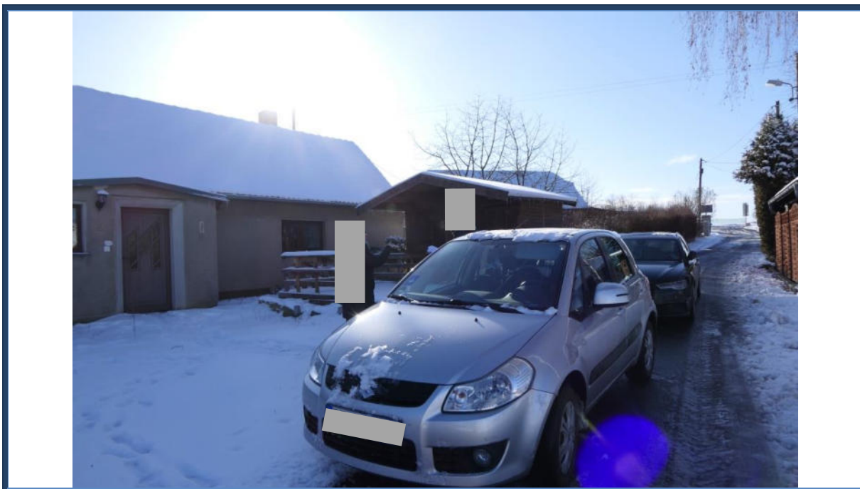
Abbildung 27: Blick in westliche Richtung in den Birkenweg; links das Bewertungsobjekt