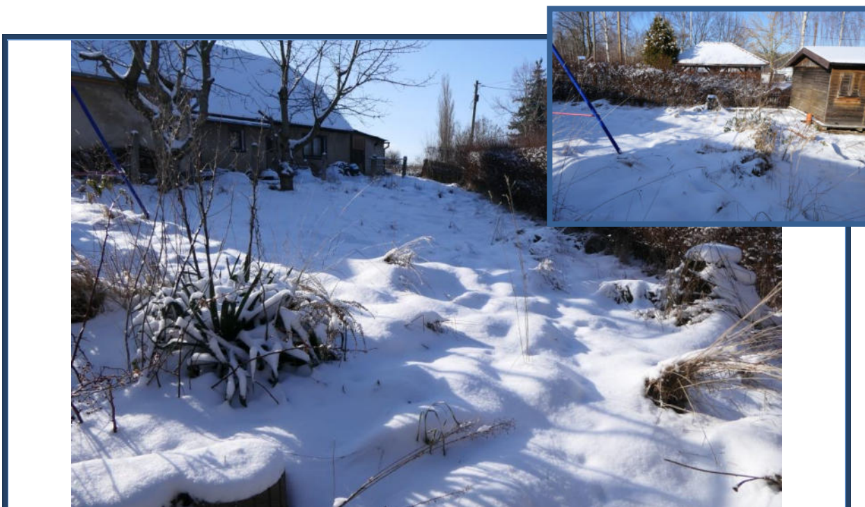
Abbildung 24: Blick in westliche Richtung; verwilderte Außenanlagen im westlichen Grundstücksbereich; umliegende Bebauung