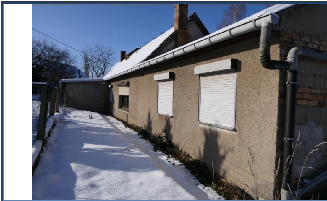
Abbildung 3: Rückansicht (Süd-Ansicht); Außenanlagen