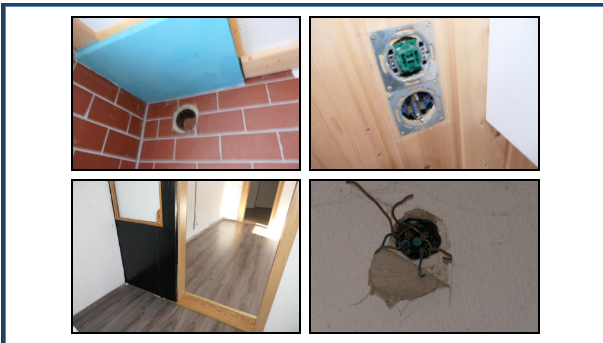
Abbildung 18: Detailansichten - Fertigstellungsbedarf