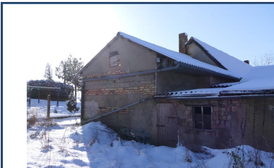
Abbildung 4: Giebelansicht (Ost-Ansicht); rechts die Mehrzweckanbauten; Außenanlagen