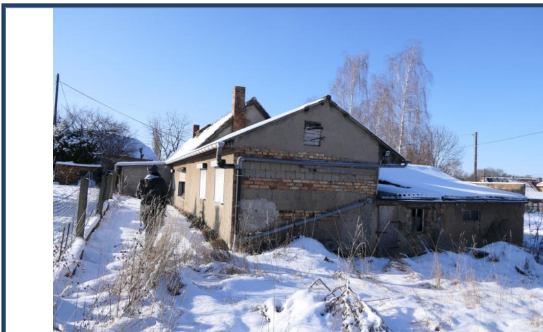
Abbildung 2: Rück- und Giebelansicht (Süd-Ost-Ansicht); rechts die Mehrzweckanbauten; Außenanlagen