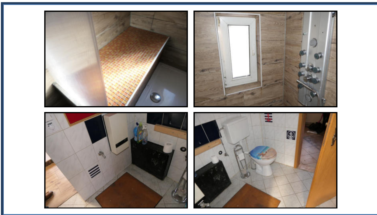
Abbildung 11: Detailansichten - Badezimmer II