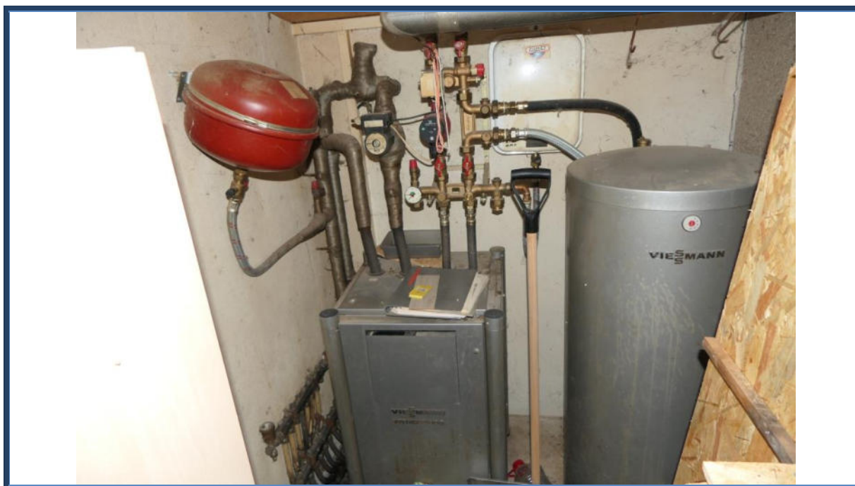
Abbildung 14: Heizungsanlage im Anbau (Eingangsbereichanbau)