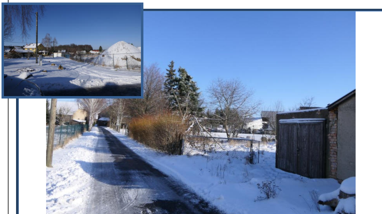
Abbildung 28: Blick in östliche Richtung in den Birkenweg; rechts das Bewertungsobjekt; umliegende Bebauung und Nutzung