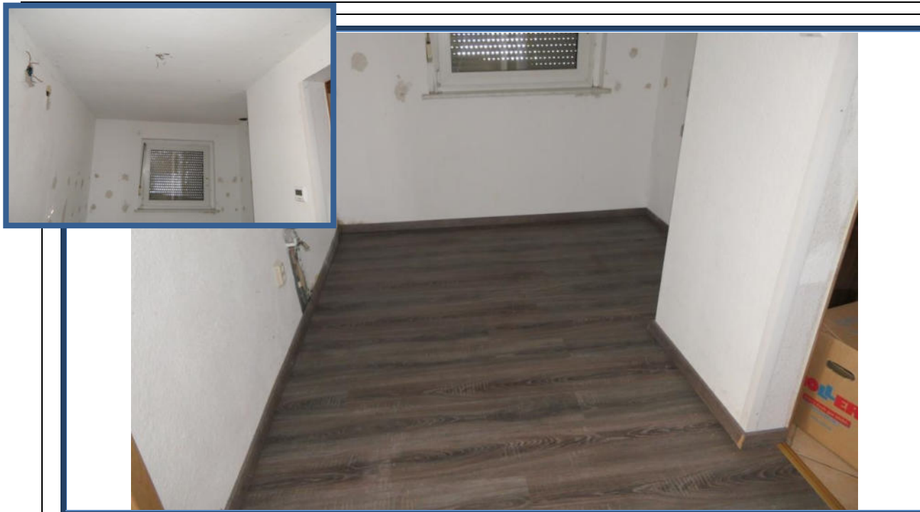
Abbildung 13: Küche (Durchgangsraum)