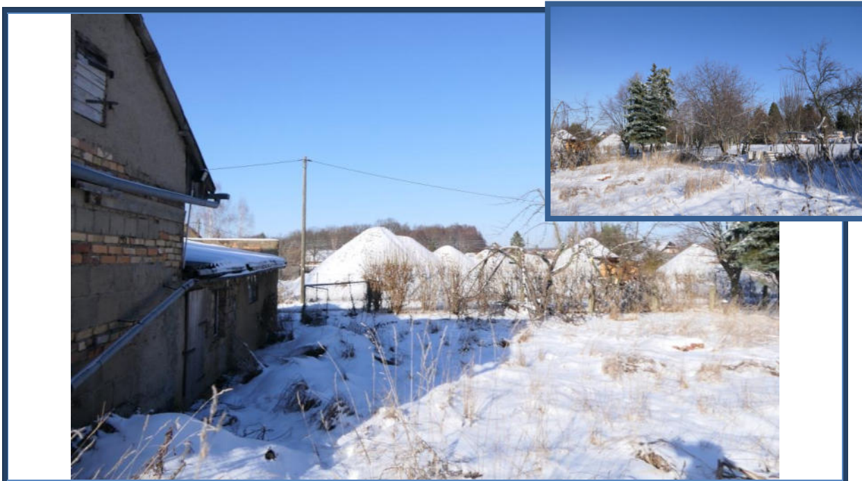
Abbildung 23: Blick in nördliche Richtung zum Birkenweg; verwilderte Außenanlagen im östlichen Grundstücksbereich; umliegende Nutzung