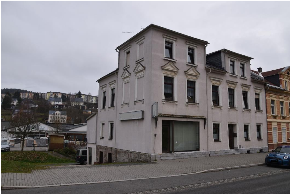
Seiten- und Rückansicht