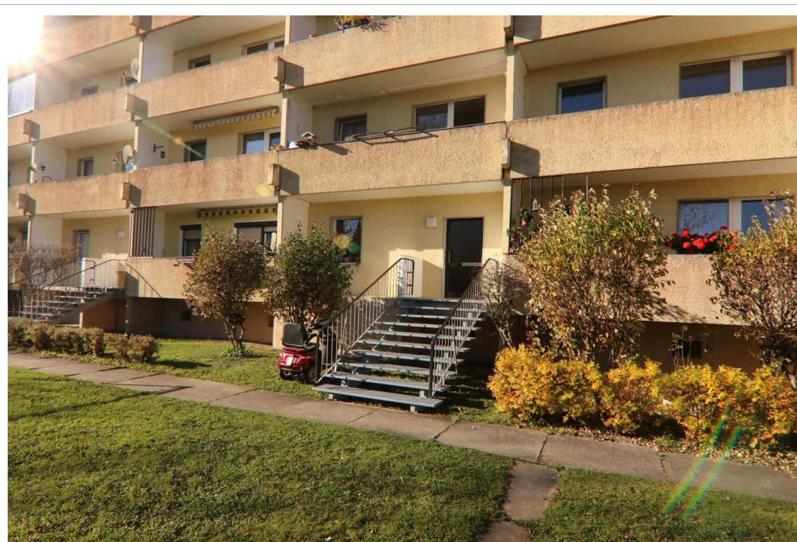
Blick auf den Hofausgang des Wohnblocks Sonnenblick 2-5, der zur Hausnummer 3 gehört. In diesem Aufgang befindet sich die zu bewertende Eigentumswohnung W 11.

Im vorliegenden Fall soll eine unsanierte Eigentumswohnung im Erdgeschoss des Gebäudes Sonnenblick 3 in Bernstadt bewertet werden.