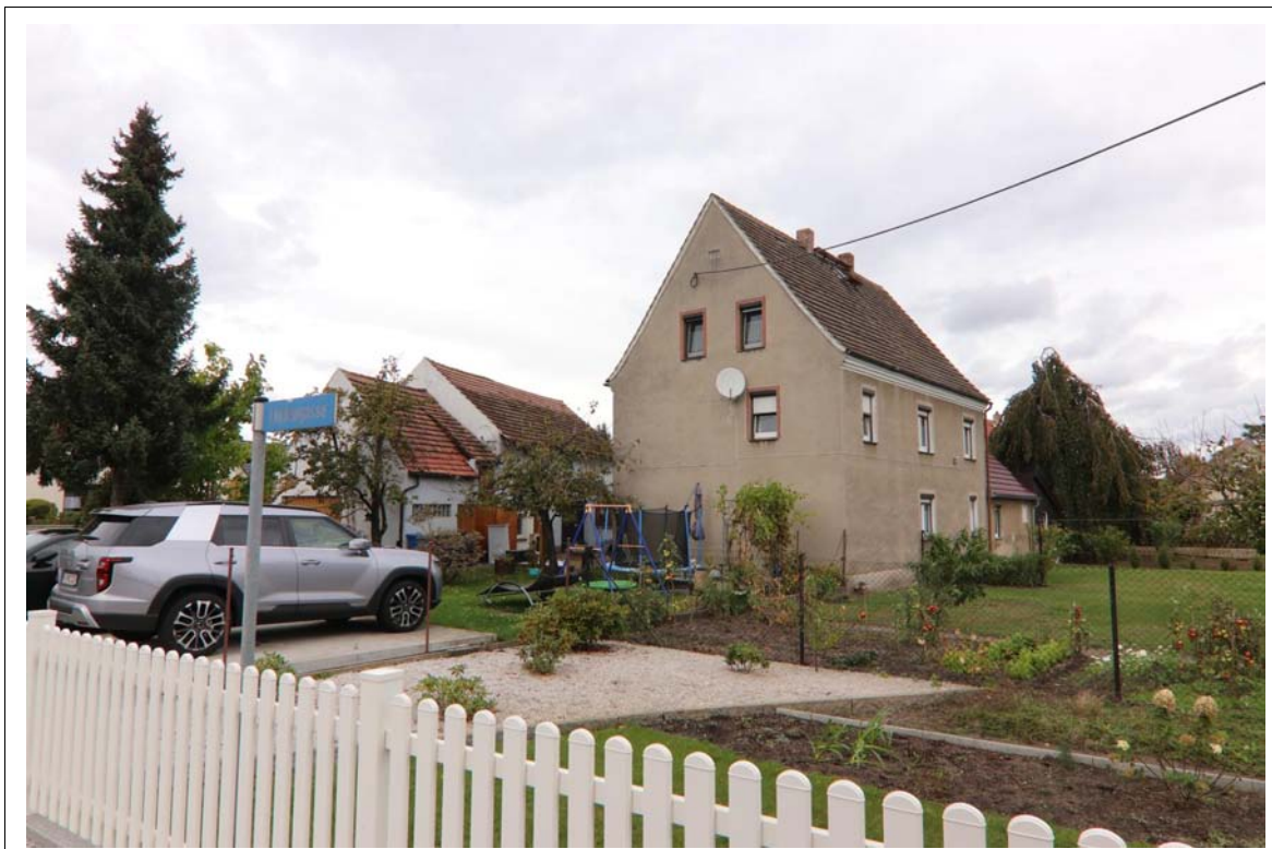
Blick von der Lindengasse in nördliche Richtung auf das Flurstück 52.

Es handelt sich im vorliegenden Fall um das in Boxberg/O.L. OT Klitten gelegene Grundstück Zum Jahnsportplatz 53 . Das Grundstück ist 710 m 2 groß und liegt auf dem Flurstück 52. Es ist mit einem Wohnhaus mit Anbau und einer Scheune mit Garagenanbau bebaut.