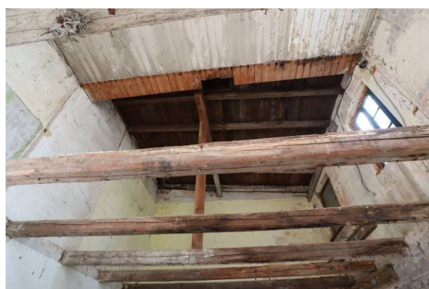
Deckenansicht des Nebengebäudes; Dachstuhl