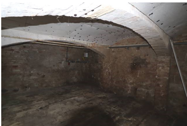
Keller des Bewertungsobjekts