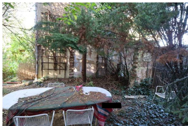
Sitzbereich im Garten des Bewertungsgrundstücks