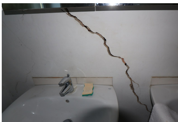
Detailansicht der Rissbildungen im Gebäudeinneren