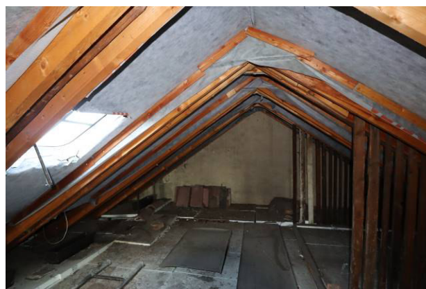
Spitzboden des Bewertungsobjekts