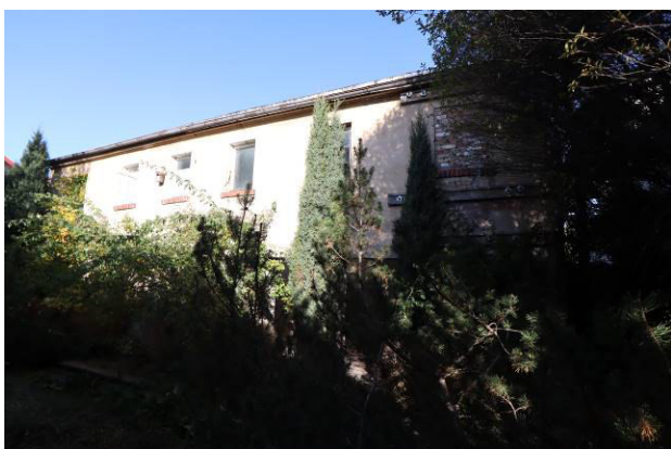
Nord-West-Ansicht des Nebengebäudes