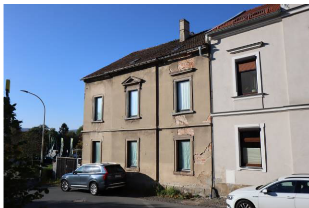
Nord-Ost-Ansicht des Bewertungsobjekts von der Karlstraße