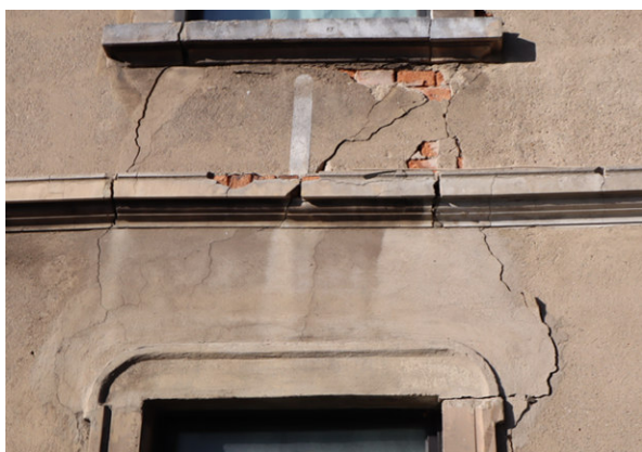
Detailansicht der Mauerwerksrisse (straßenseitig)