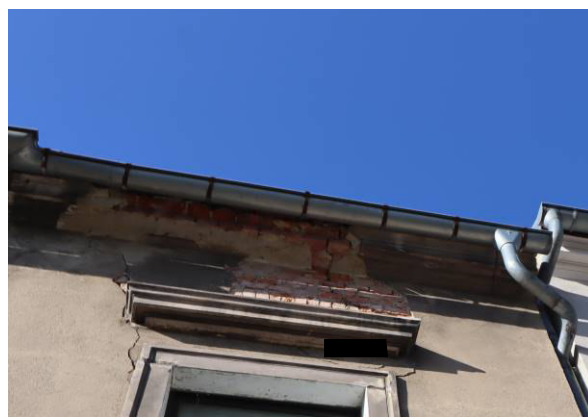
Detailansicht der Mauerwerksrisse (straßenseitig)