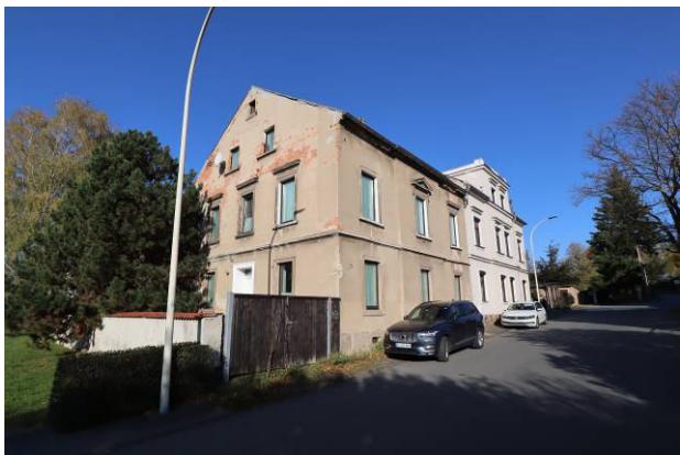
Süd-Ost-Ansicht des Bewertungsobjekts von der Karlstraße