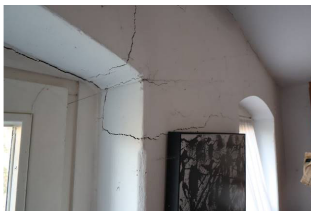
Detailansicht der Rissbildungen im Gebäudeinneren