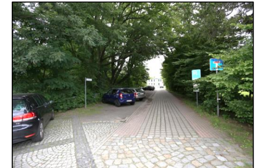
Blick entlang der Schulstraße. Links befindet sich das Bewertungsgrundstück