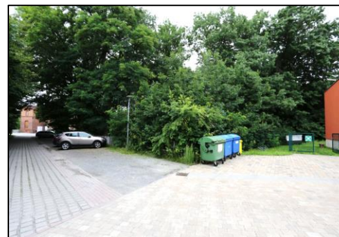
Blick von einem angrenzenden Schulgelände auf die südöstliche Grundstücksecke