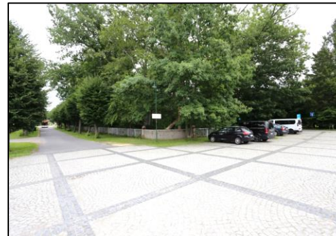
Straßenseitiger Blick vom Bahnhofsvorplatz in Richtung südwestliche Grundstücksecke. Links verläuft die Poststraße

Das Bewertungsgrundstück wurde in einem naturbelassenen und stark bewachsenen Zustand mit einem großzügigen und alten Baum- und Strauchbewuchs vorgefunden. In der Vergangenheit musste das Grundstück zudem im Rahmen einer Sicherungsmaßnahme durch die Gemeinde Rietschen von Totholz befreit und ausgeästet werden, da bereits Bäume bzw. Äste in den Verkehrsraum fielen.