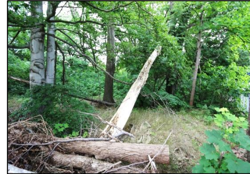
Blick auf das Bewertungsgrundstück. In der Vergangenheit wurde das Grundstück bereits von Totholz befreit und ausgeästet