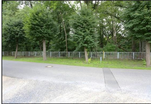
Blick von der Poststraße auf das Bewertungsgrundstück