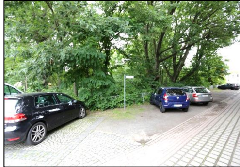
Blick aus Richtung des Bahnhofsvorplatzes auf den südlichen Grundstücksteil