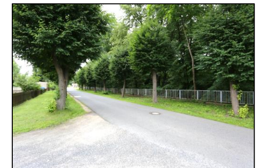
Blick entlang der Poststraße in nordöstliche Richtung