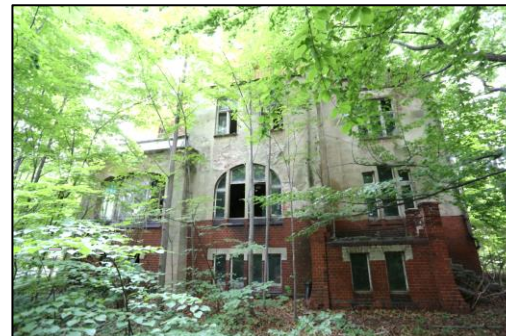
Blick auf die ehemalige Fabrikantenvilla. Aufgrund des starken Bewuchses konnten keine weiteren Außenaufnahmen gemacht werden