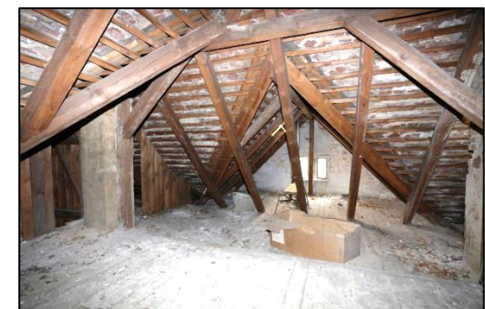
Blick in den Dachboden