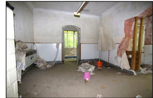
Blick in einen Raum im Erdgeschoss