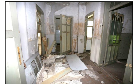
Blick in den Flur im ersten Obergeschoss