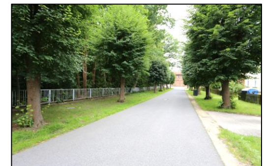
Blick entlang der Poststraße in südwestliche Richtung. Am Ende der Straße ist der Bahnhof gelegen