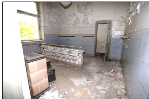
Blick in einen der Waschräume