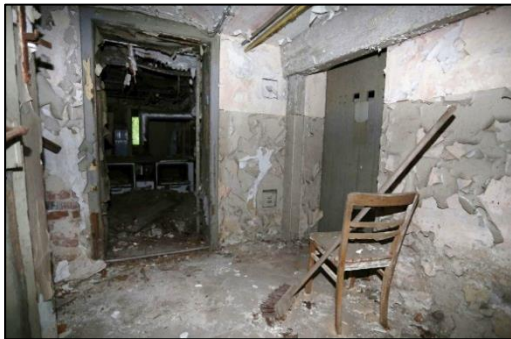
Blick in einen Kellerflur