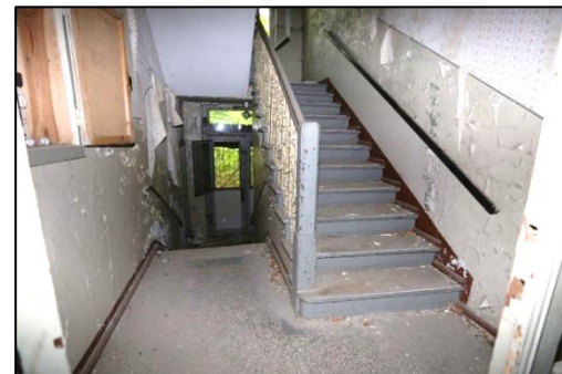
Blick in das Treppenhaus