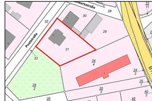
Auszug aus der Liegenschaftskarte

Das Bewertungsgrundstück war in der Vergangenheit Teil eines größeren Gesamtgrundstücks, welches aus den drei aneinander angrenzenden Flurstücken 29, 31 und 34/2 bestand. Das Flurstück 31 ist dabei mit einer ehemaligen Fabrikantenvilla bebaut. Zusätzlich steht das Flurstück 31 mit dem angrenzenden Flurstück 34/2 unter Denkmalschutz. Beide Grundstücke werden dahingehend als „Fabrikantenvilla mit Villengarten; baugeschichtlich und städtebaulich von Bedeutung – um 1905/1910“ geführt. Das Bewertungsgrundstück stellt dabei das Villengrundstück dar. Die Villa wurde zuletzt zu DDR-Zeiten und dabei als Kindergarten genutzt. Insgesamt stehen rund 542,00 m 2 Wohn- und Nutzfläche (inkl. Keller) zur Verfügung. Davon werden rund 389,00 m 2 Wohnfläche aufgeteilt auf 140,00 m 2 im Erdgeschoss, 141,00 m 2 im 1. Obergeschoss und 108,00 m 2 im Dachgeschoss. Das Gebäude besitzt einen separaten Zugang zum Erdgeschoss und einen weiteren Eingang mit einem separaten Treppenhaus, über welches die einzelnen Geschosse vom Keller bis in das Dachgeschoss erreicht werden können. Eine zukünftige Sanierung des Gebäudes ist unter Einbeziehung der denkmalschutzrechtlichen Vorschriften denkbar. Die vorgefundenen Grundrisse sind dahingehend als gut anzusehen. Die vorhandenen Freiflächen auf dem Grundstück wurden als naturbelassene Grünflächen mit einem waldähnlichen und teilweise alten Baum- und Strauchbewuchs vorgefunden.