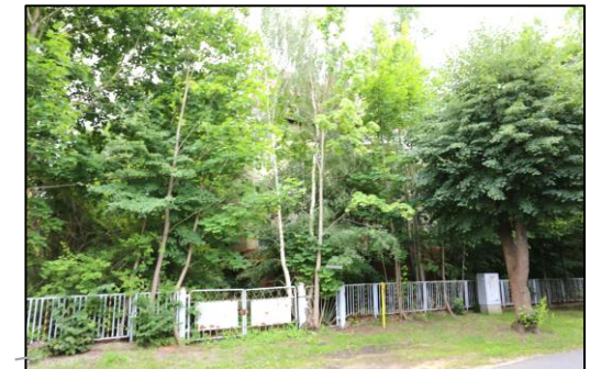
Blick auf die Zufahrt des Grundstücks in Richtung Poststraße. Die Villa ist von der Straße aus kaum noch sichtbar