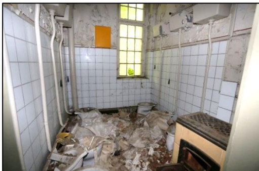
Blick in einen WC-Raum. Die Sanitäranlagen wurden teilweise zerstört