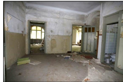
Blick in den Flur im Erdgeschoss