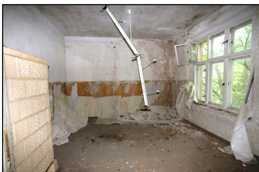
Blick in einen Raum im ersten Obergeschoss