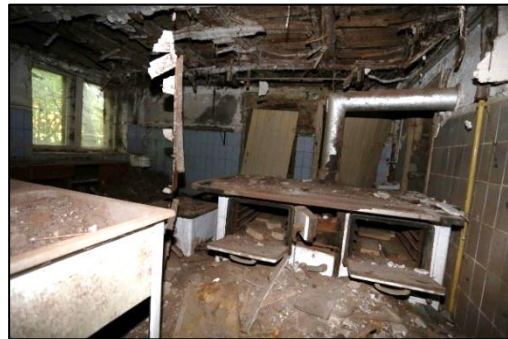
Blick in die Küche im Keller. In dieser sind bereits Teile der Decke heruntergebrochen