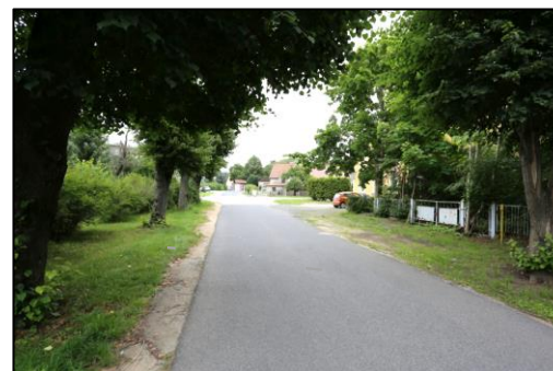
Blick entlang der Poststraße in nordöstliche Richtung