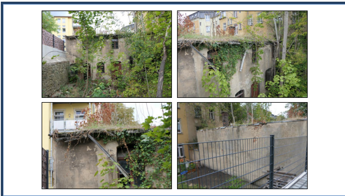
Abbildung 15: Detailansichten des rückseitig angebauten stark sanierungsbedürftigen Nebengebäudes