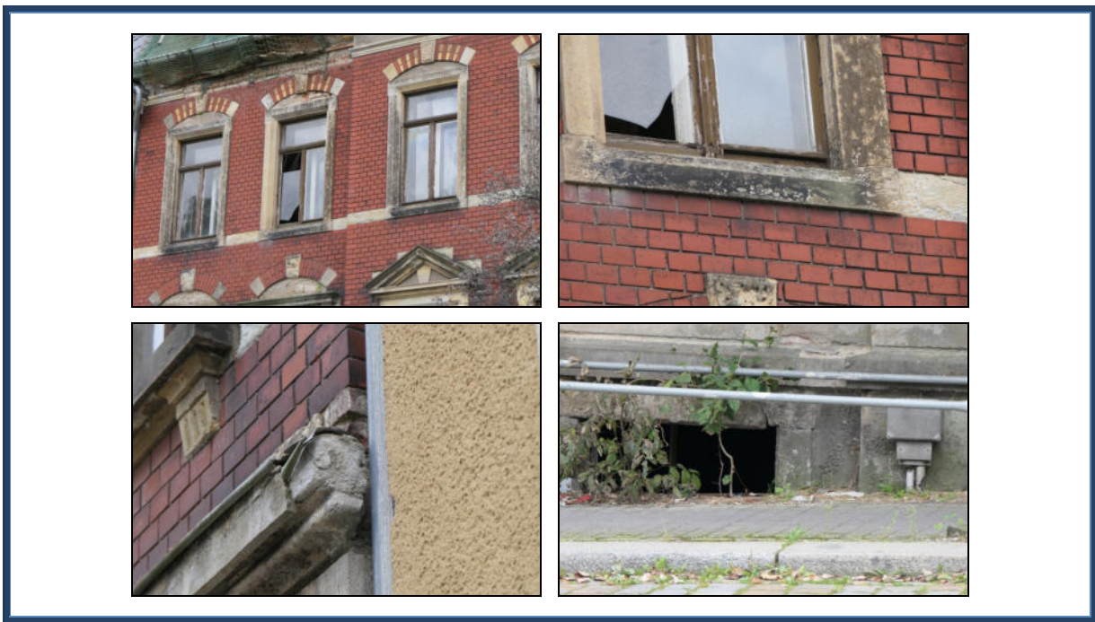
Abbildung 10: Detailansichten