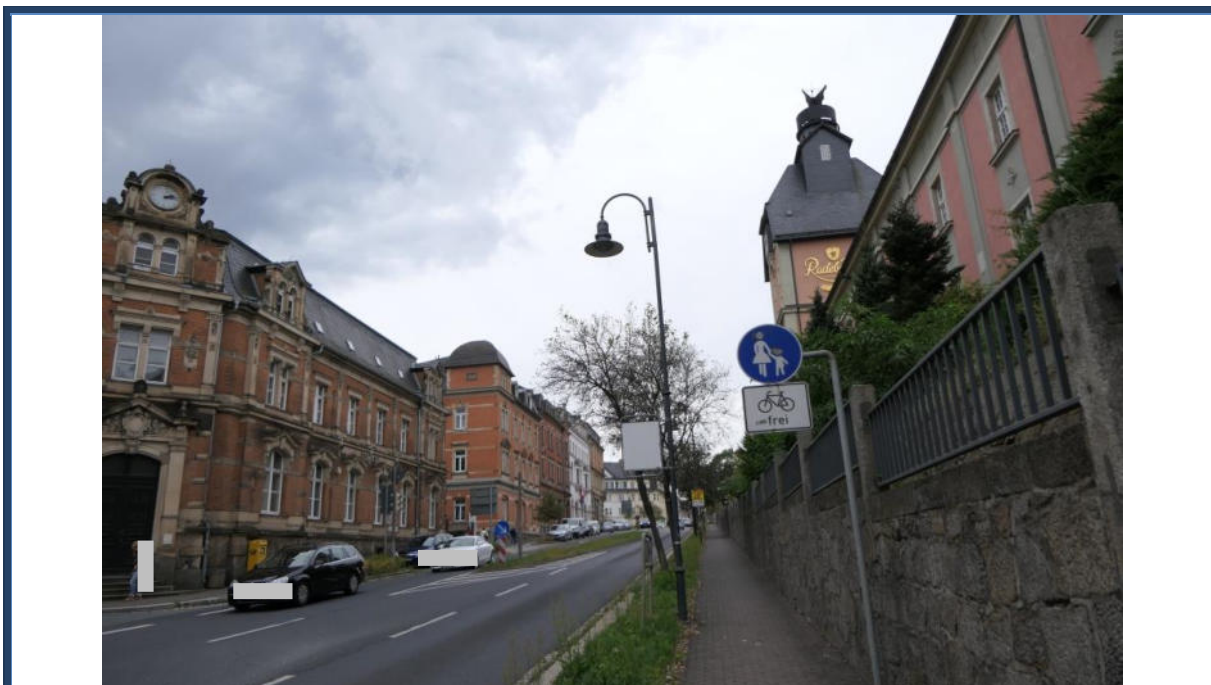
Abbildung 20: Blick (in westliche Richtung) in die Dresdener Straße; links (nicht im Bild) das Bewertungsobjekt; rechts das Gelände der „Radeberger Brauerei“; umliegende Bebauung