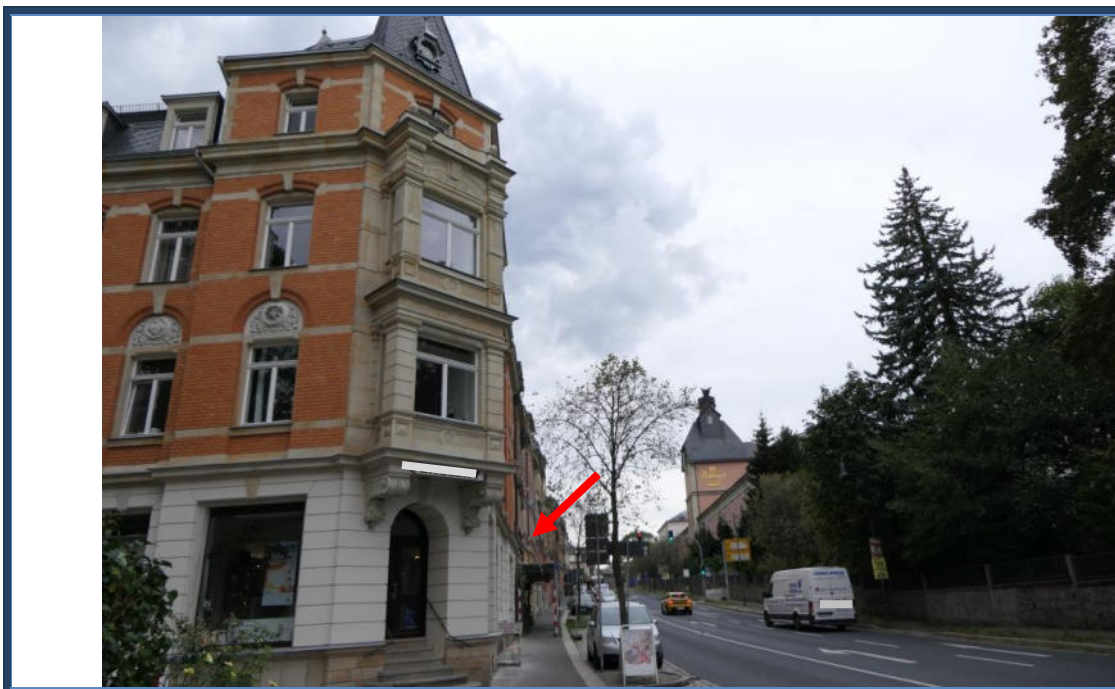
Abbildung 17: Blick (in westliche Richtung) in die Dresdener Straße; links das Bewertungsobjekt; umliegende Bebauung;