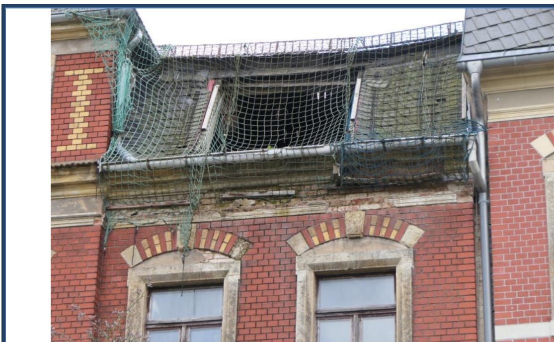
Abbildung 6: Detailansichten: Schäden an der Dacheindeckung und an der Fassade; Dach tlw. notgesichert; Gauben zurückgebaut