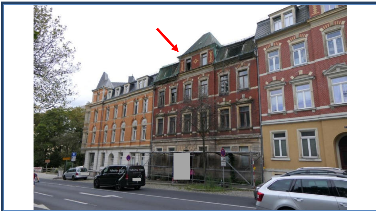
Abbildung 2: Straßenansicht (Nord-Ansicht); angrenzende Bebauung