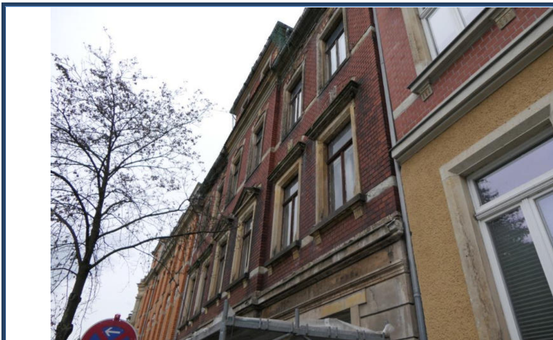
Abbildung 7: Detailansicht der Fassade; angrenzende Bebauung