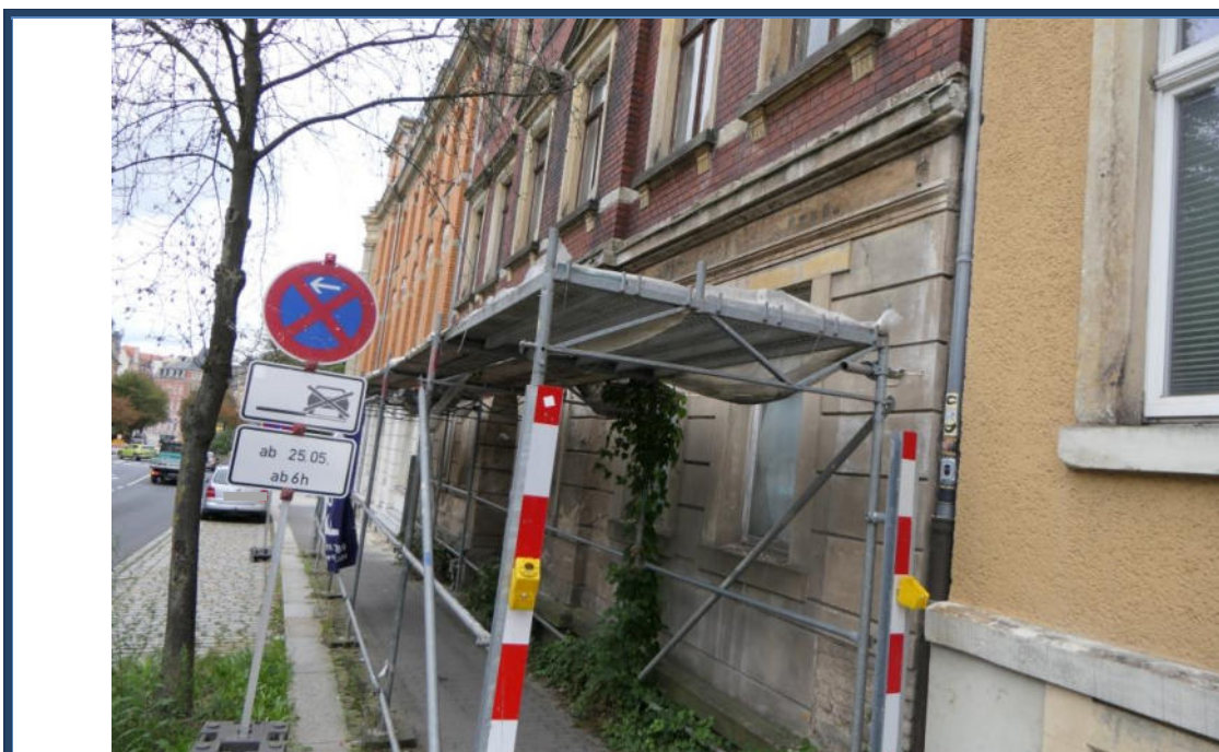
Abbildung 8: Detailansicht der Fassade; Notsicherung gegen herabfallende Bauteile; angrenzende Bebauung