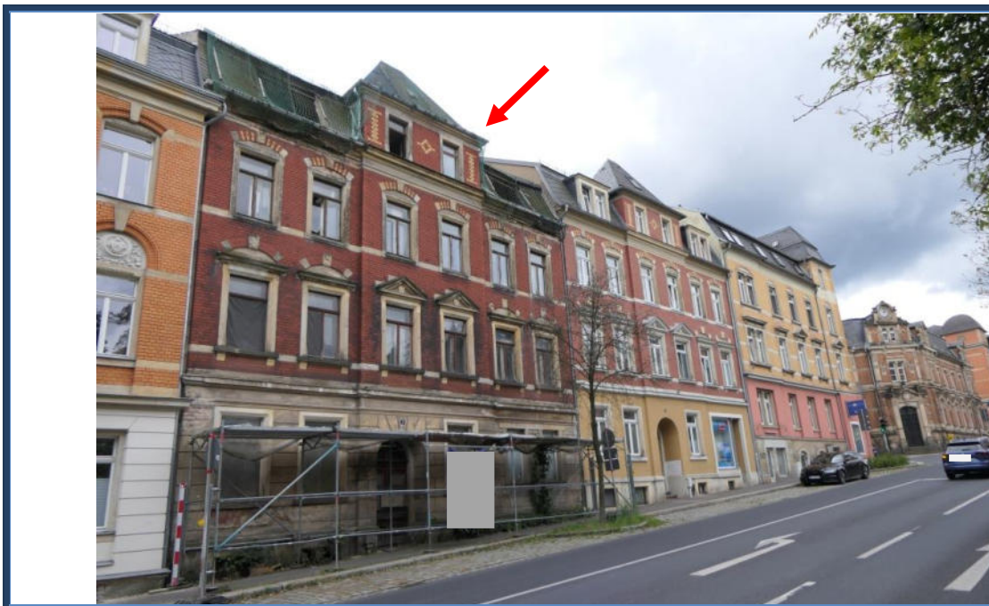
Abbildung 3: Straßenansicht (Nord-Ansicht); angrenzende und umliegende Bebauung