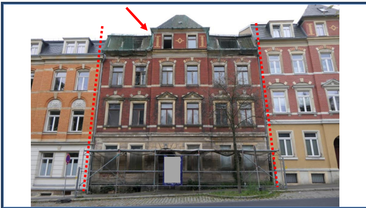
Abbildung 1: Straßenansicht (Nord-Ansicht); angrenzende Bebauung