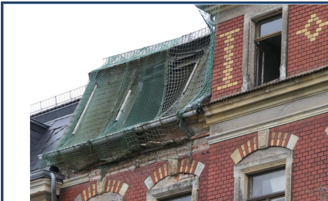
Abbildung 5: Detailansichten: Schäden an der Dacheindeckung und an der Fassade; Dach tlw. notgesichert; Gauben zurückgebaut