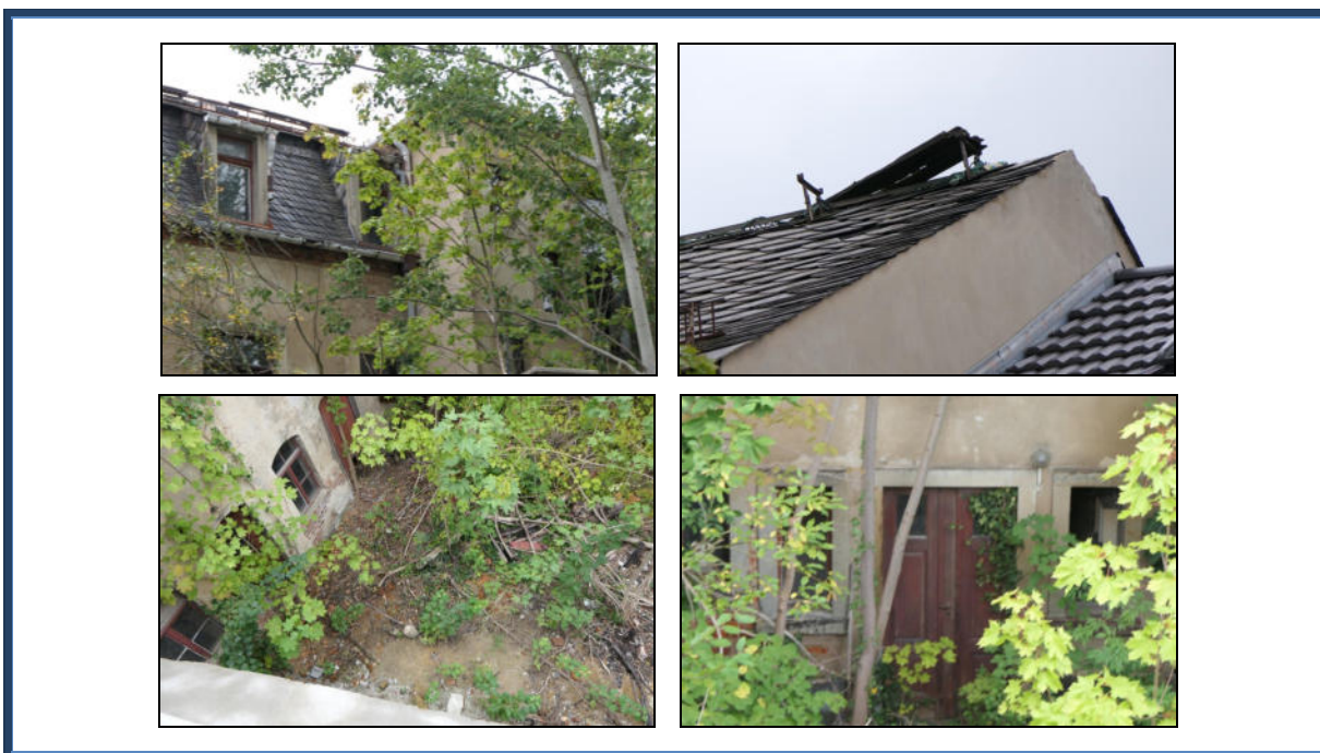
Abbildung 14: Detailansichten der Schäden an der Fassade, an der Dacheindeckung ; stark verwilderte und beschädigte Außenanlagen