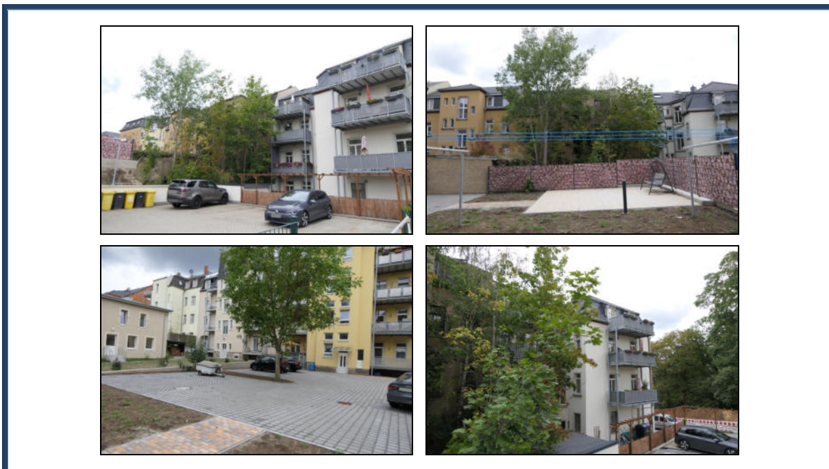
Abbildung 16: Angrenzende und umliegende Bebauung/Nutzung im rückseitigen Grundstücksbereich