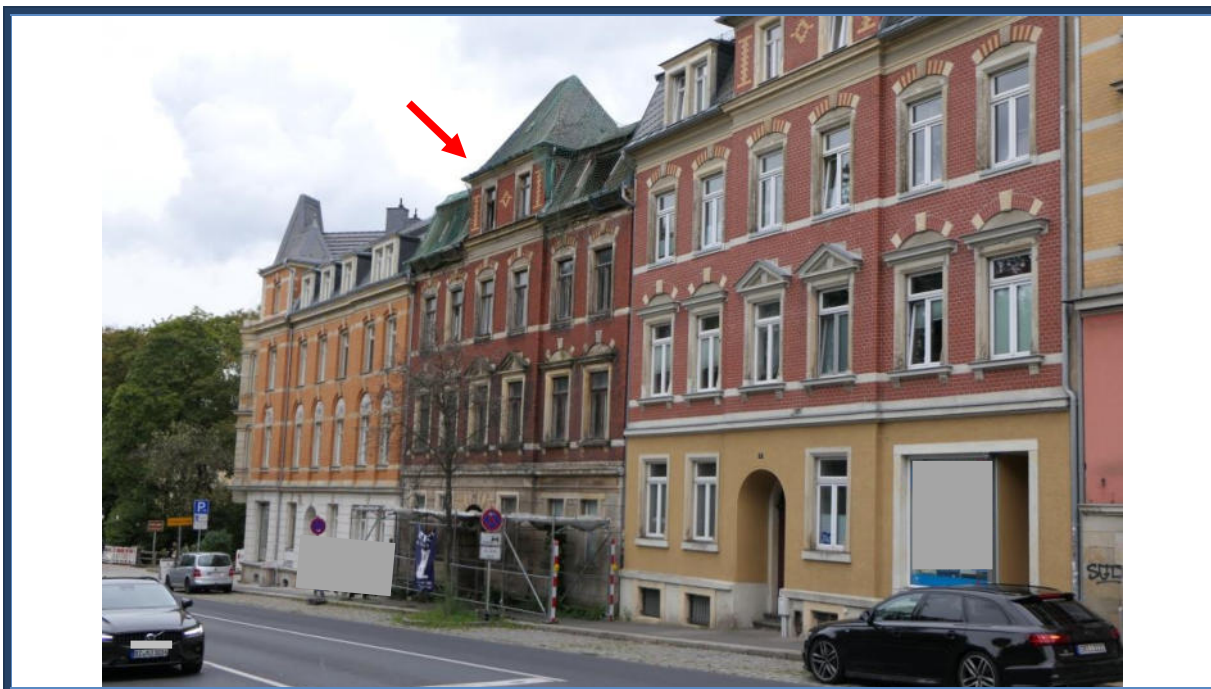
Abbildung 19: Blick (in östliche Richtung) in die Dresdener Straße; rechts das Bewertungsobjekt; angrenzende und umliegende Bebauung