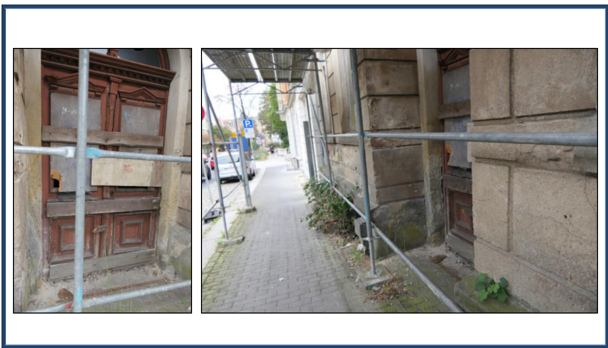
Abbildung 9: Hauseingangsbereich; stark beschädigt