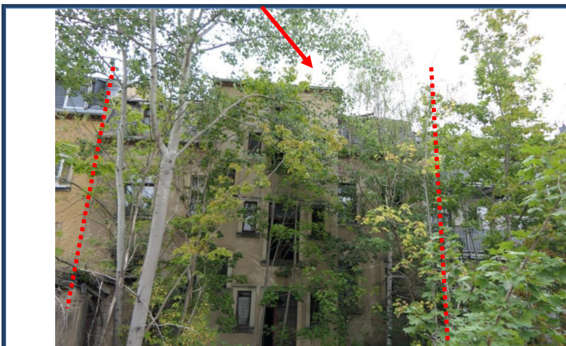
Abbildung 4: Rückansicht (Süd-Ansicht); stark verwilderte Außenanlagen; angrenzende Bebauung