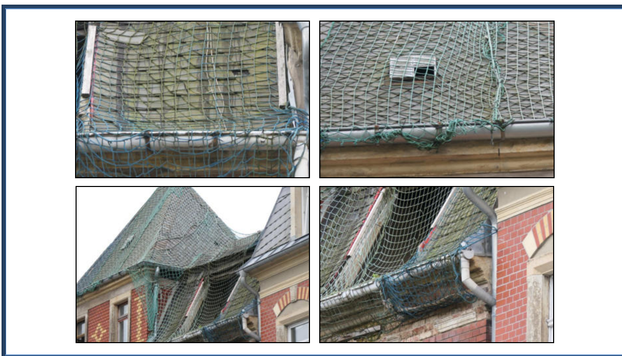
Abbildung 11: Detailansichten der Schäden an der Dacheindeckung und an der Fassade; Dach notgesichert; Gauben zurückgebaut