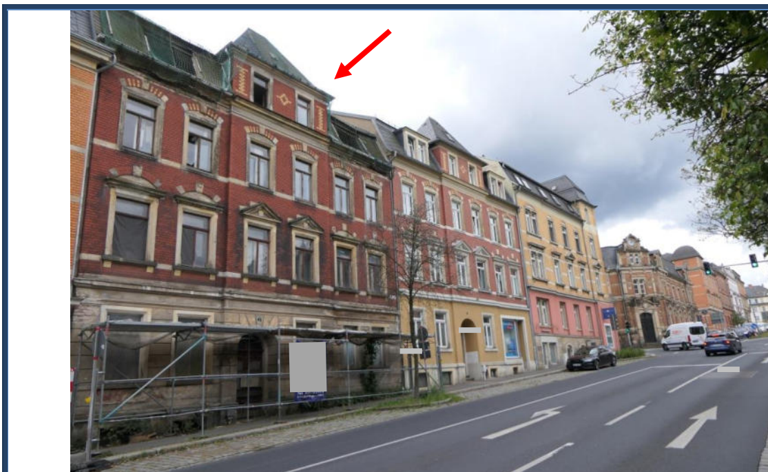
Abbildung 18: Blick (in westliche Richtung) in die Dresdener Straße; links das Bewertungsobjekt; angrenzende und umliegende Bebauung