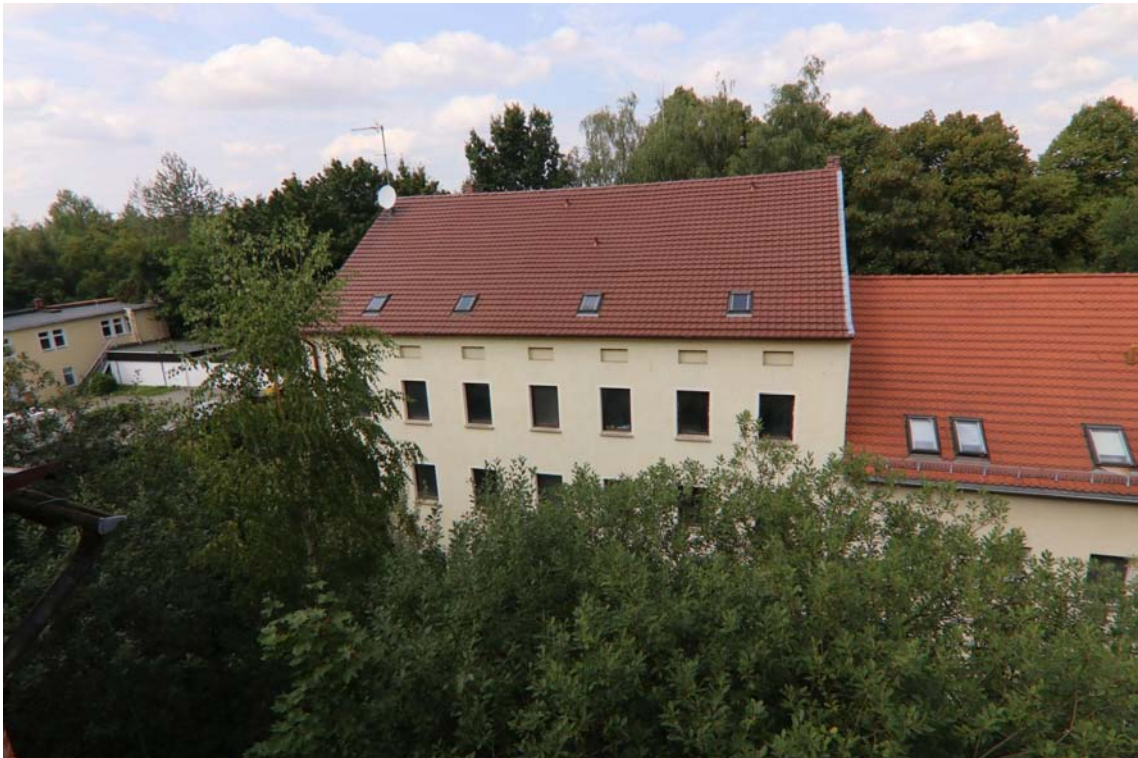
Blick vom Vorderhaus Rauschwalder Straße 57 in nördliche Richtung auf das Hinterhaus Nr. 57 a in Görlitz.

Im vorliegenden Fall soll die Wohnung W 2 des Mehrfamilienhauses Rauschwalder Straße 57 a in Görlitz bewertet werden. Das Grundstück Rauschwalder Straße 57, 57 a setzt sich dabei aus den Flurstücken 8/1 und 8/2 zusammen und ist insgesamt 828 m 2 groß. Auf dem Flurstück 8/2 steht dabei das historische Vorderhaus, das als Mehrfamilienhaus in geschlossener Bebauung vorliegt und einen unsanierten bis ruinösen Zustand aufweist. Auf dem Flurstück 8/1 steht das ebenfalls historische Hinterhaus, das vermutlich 1995 vollständig saniert wurde. Im Jahr 2008 erfolgte die Teilung in insgesamt sieben Eigentumswohnungen. Die zu bewertende Wohnung W 2 liegt dabei im Erdgeschoss des Hinterhauses. Das Gebäude wurde nach der Sanierung zumindest teilweise wohnlich genutzt. Seit vielen Jahren steht nun auch das Hinterhaus leer und wird nicht mehr bewirtschaftet. Auf Grund des Leerstandes sind erhebliche Mängel und umfangreiche Vandalismusschäden entstanden, so dass das gesamte Hinterhaus nicht mehr bewohnbar ist.