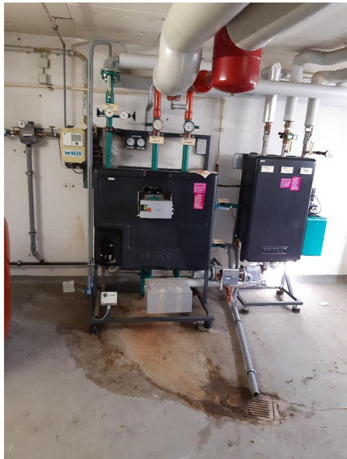
Sputnikweg 12, KG-WLO Fernwärmestation