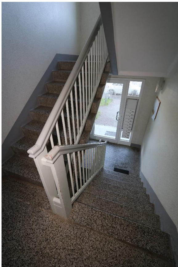
Treppenhaus mit Haustür