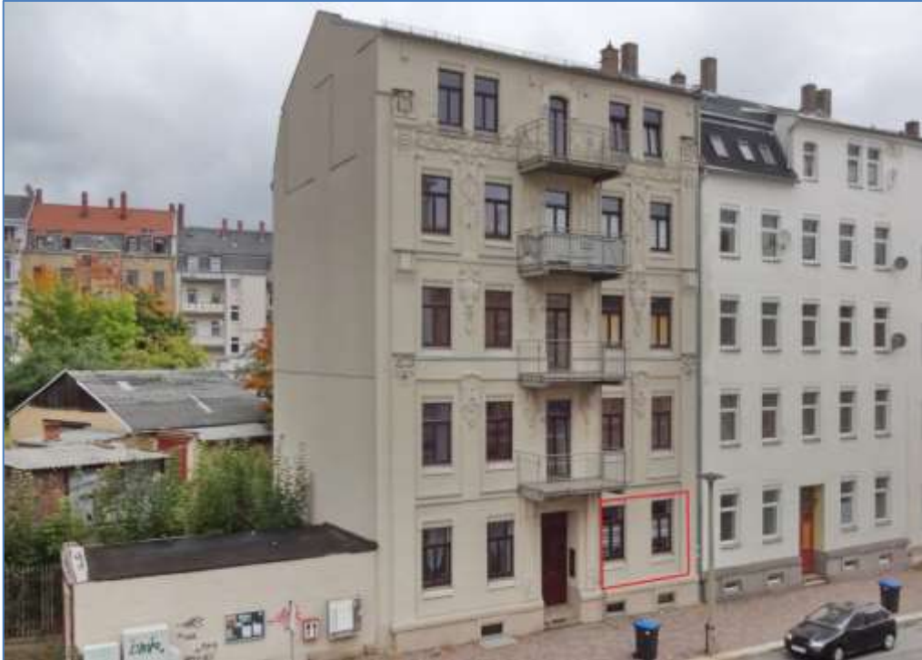
Lage Wohnung 1 rot markiert

Im Wege der Zwangsvollstreckung soll das im Wohnungsgrundbuch von Haselbrunn eingetragene Miteigentumsanteil in 08525 Plauen versteigert werden.