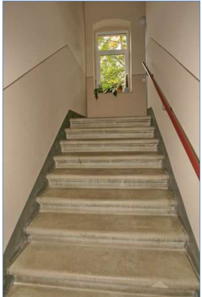
Bild 5 Detail Treppenhaus zum Obergeschoss

Fotografische Dokumentation zum Verkehrswertgutachten über den Miteigentumsanteil am Flurstück 255 verbunden mit dem Sondereigentum an der Wohnung im Erdgeschoss nebst Balkon sowie einem Abstellraum im Treppenhaus und einem Kellerraum im Kellergeschoss im Aufteilungsplan bezeichnet mit Nr. 1 im Anwesen Seumestraße 55 in 08525 Plauen