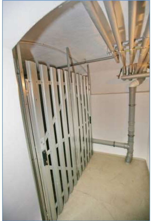
#Bild 6 Kellergeschoss mit Kellerraum der Wohnung Nr. 1

Fotografische Dokumentation zum Verkehrswertgutachten über den Miteigentumsanteil am Flurstück 255 verbunden mit dem Sondereigentum an der Wohnung im Erdgeschoss nebst Balkon sowie einem Abstellraum im Treppenhaus und einem Kellerraum im Kellergeschoss im Aufteilungsplan bezeichnet mit Nr. 1 im Anwesen Seumestraße 55 in 08525 Plauen