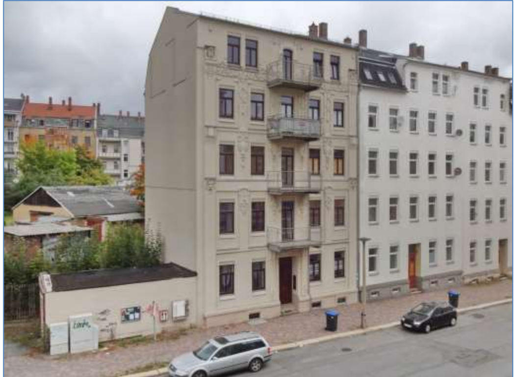
Bild 2 Eigentumswohnanlage, Hofansicht