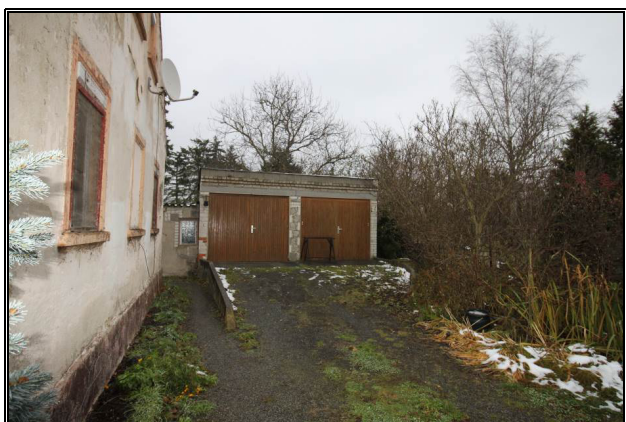
West-Ansicht der Doppelgarage