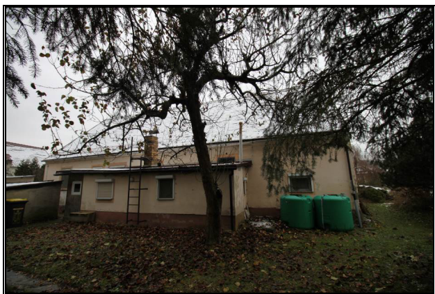
Nord-Ost-Ansicht des Wohnhauses mit rückseitigem Anbau