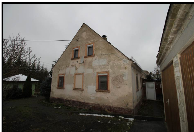
Süd-Ost-Ansicht des Wohnhauses