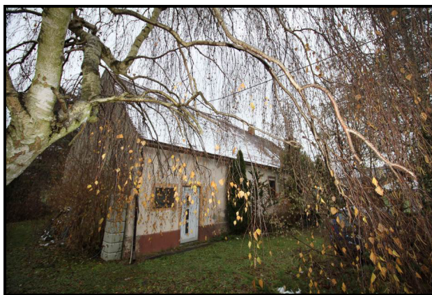
Nord-West-Ansicht des Wohnhauses