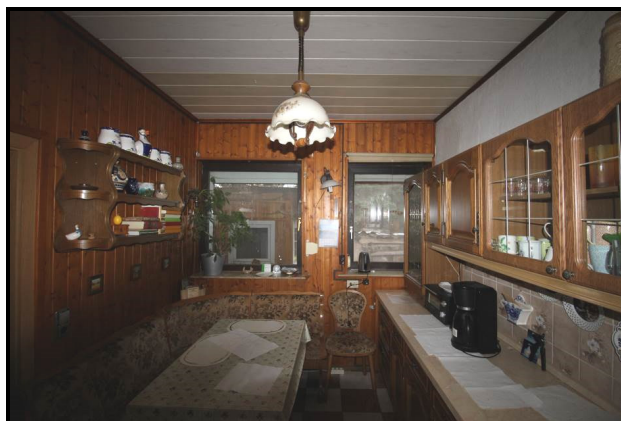
Küche im Erdgeschoss