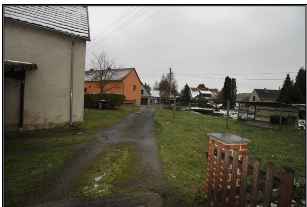
Nord-Ansicht der Zuwegung über fremdes Flurstück