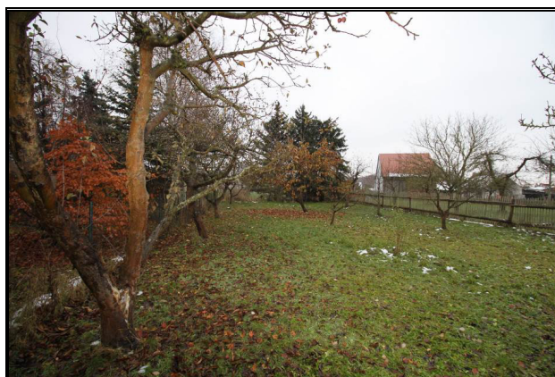
Teilbereich B (Flurstück 7/2)