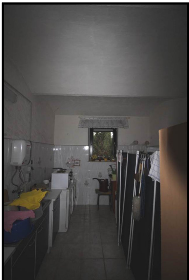
Teil des Waschhauses