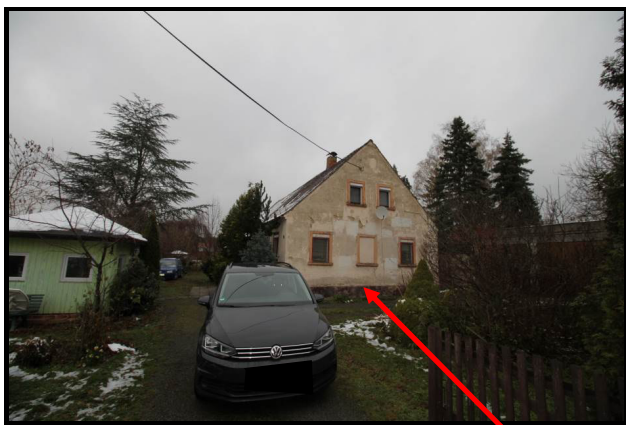
Zuwegung über fremdes Flurstück zum Bewertungsobjekt