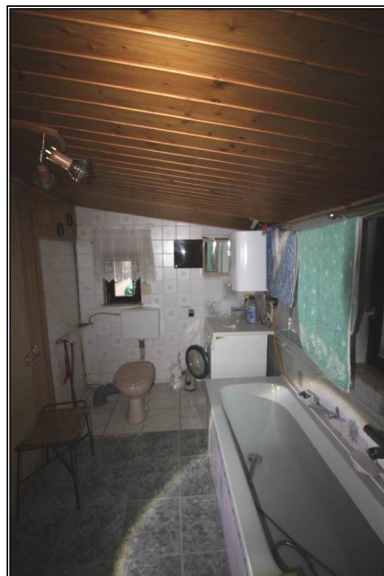
Bad im rückseitigen Anbau