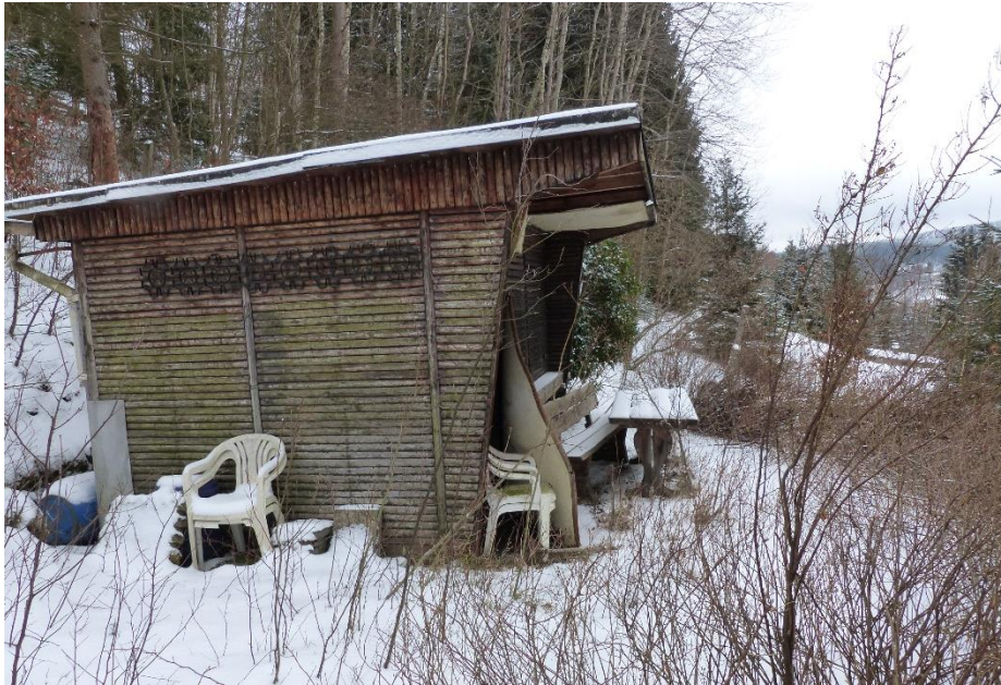
Ansicht zum Bungalow