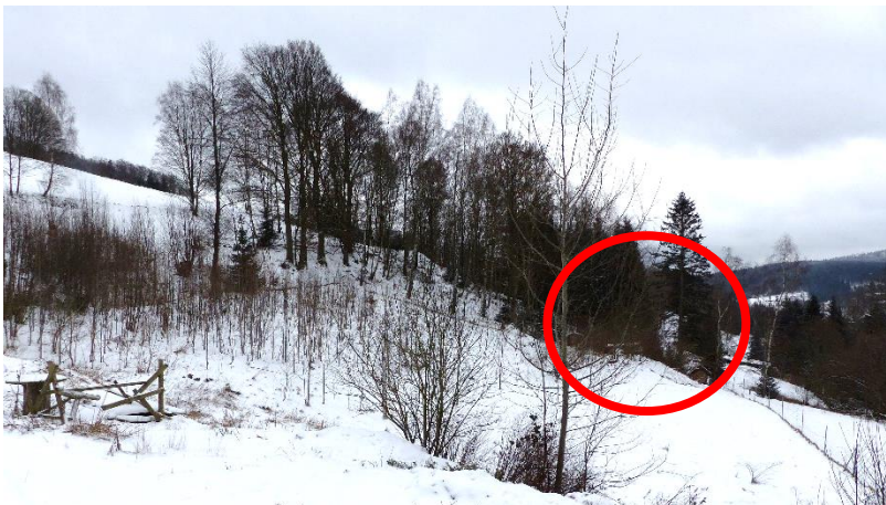
Ansicht von Norden zum Flurstück

Das Grundstück befindet sich baurechtlich in Außenbereichslage und ist nicht für eine zukünftige Bebauung vorgesehen. Lt. amtlichen Flächennutzungsplan von Klingenthal handelt es sich um „Landwirtschaftsfläche im Außenbereich“.