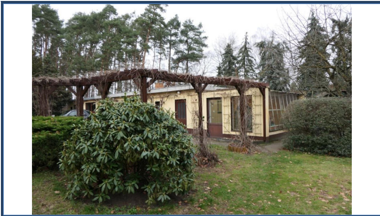
Abbildung 19: Außenanlagen; Mehrzweckgebäude