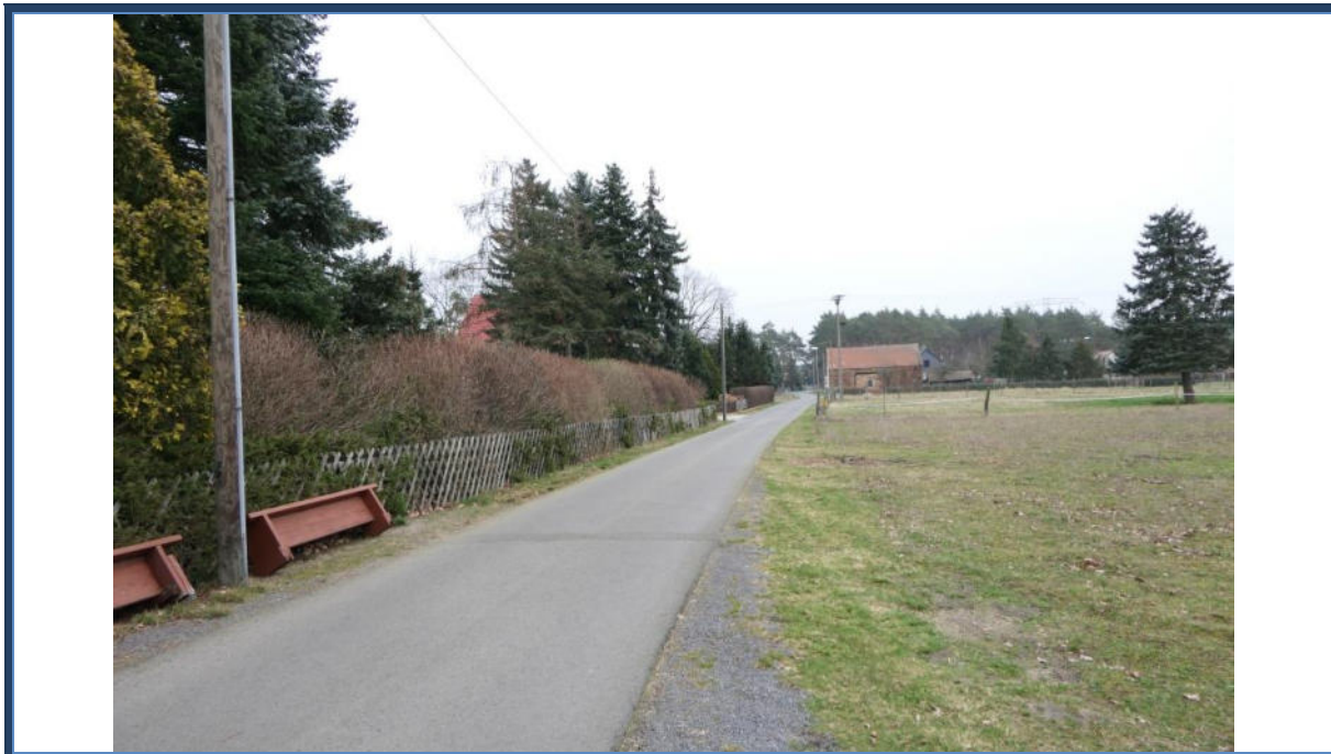
Abbildung 25: Blick in östliche Richtung in den Spreewitzer Weg; links das Bewertungsobjekt; umliegende Bebauung und Nutzung