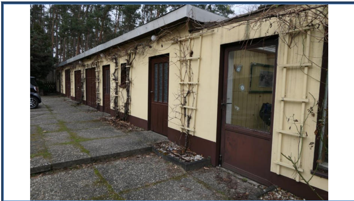
Abbildung 10: Mehrzweckgebäude