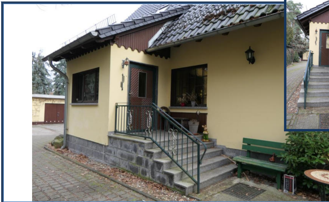
Abbildung 5: Hauseingangsbereich (Westseite)