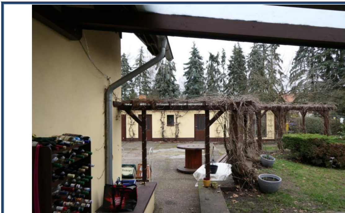
Abbildung 15: Blick von der angebauten Terrasse in nördliche Richtung zum Mehrzweckgebäude; Außenanlagen