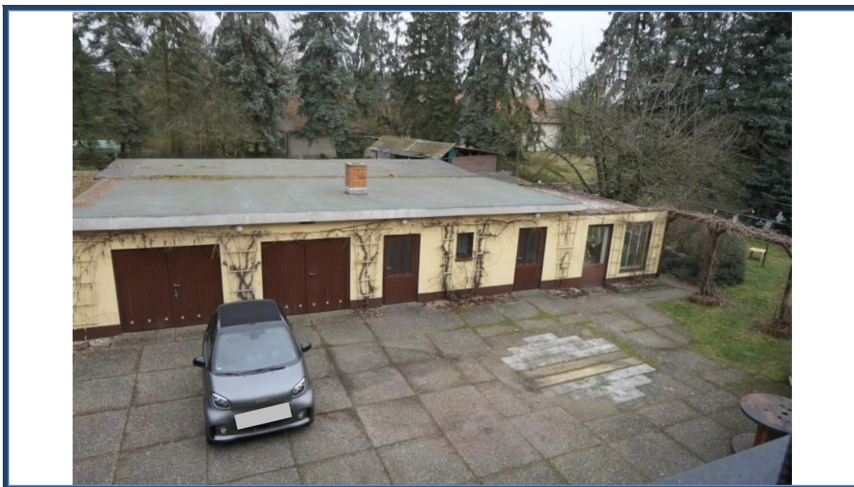
Abbildung 9: Blick aus dem Dachgeschoss in nördliche Richtung zum Mehrzweckgebäude; Außenanlagen