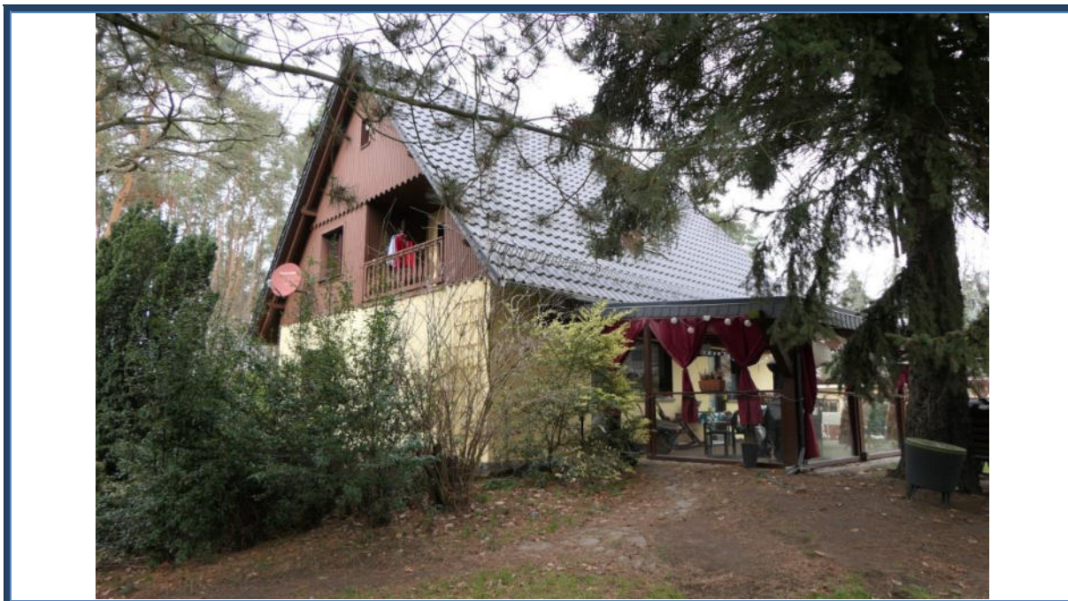
Abbildung 2: Vorder- und Seitenansicht (Süd-Ost-Ansicht); rechts die angebaute Terrasse; Außenanlagen