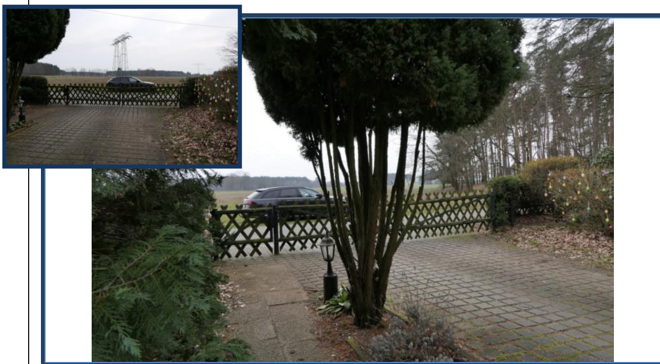
Abbildung 23: Grundstückszufahrt; umliegende Nutzung