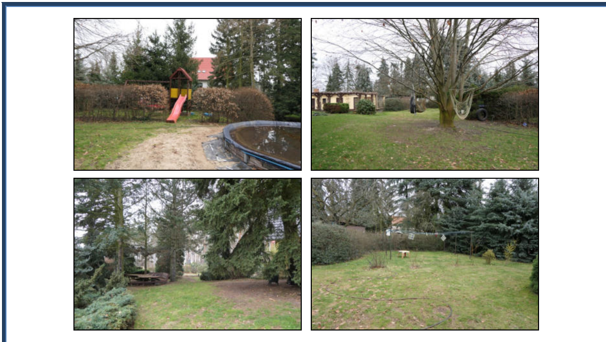
Abbildung 18: Außenanlagen im östlichen Grundstücksteil