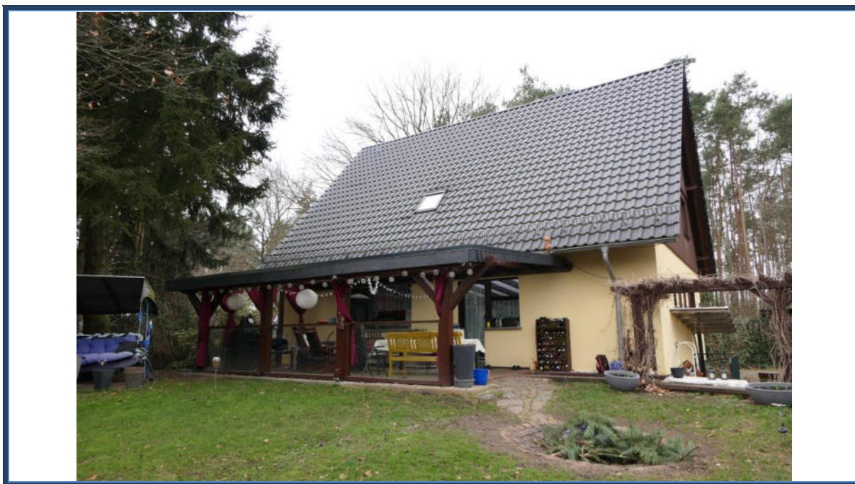
Abbildung 3: Seitenansicht (Ost-Ansicht); mittig die angebaute Terrasse; Außenanlagen