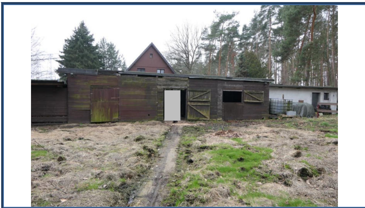
Abbildung 12: Blick in südliche Richtung; Rückansicht des Mehrzweckgebäudes (Holzanbauten); im Hintergrund das Wohnhaus; Außenanlagen