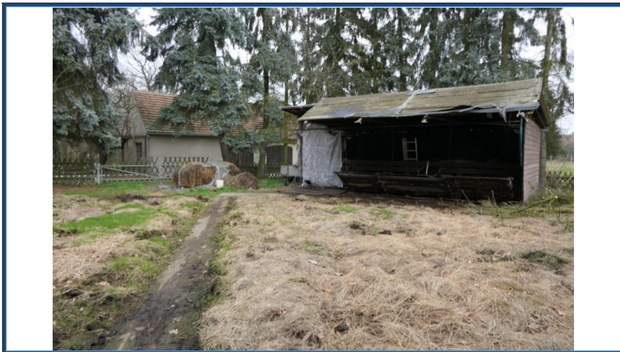
Abbildung 13: Blick in nordöstliche Richtung; einfaches Stallgebäude/Heulager; Außenanlagen; umliegende Bebauung