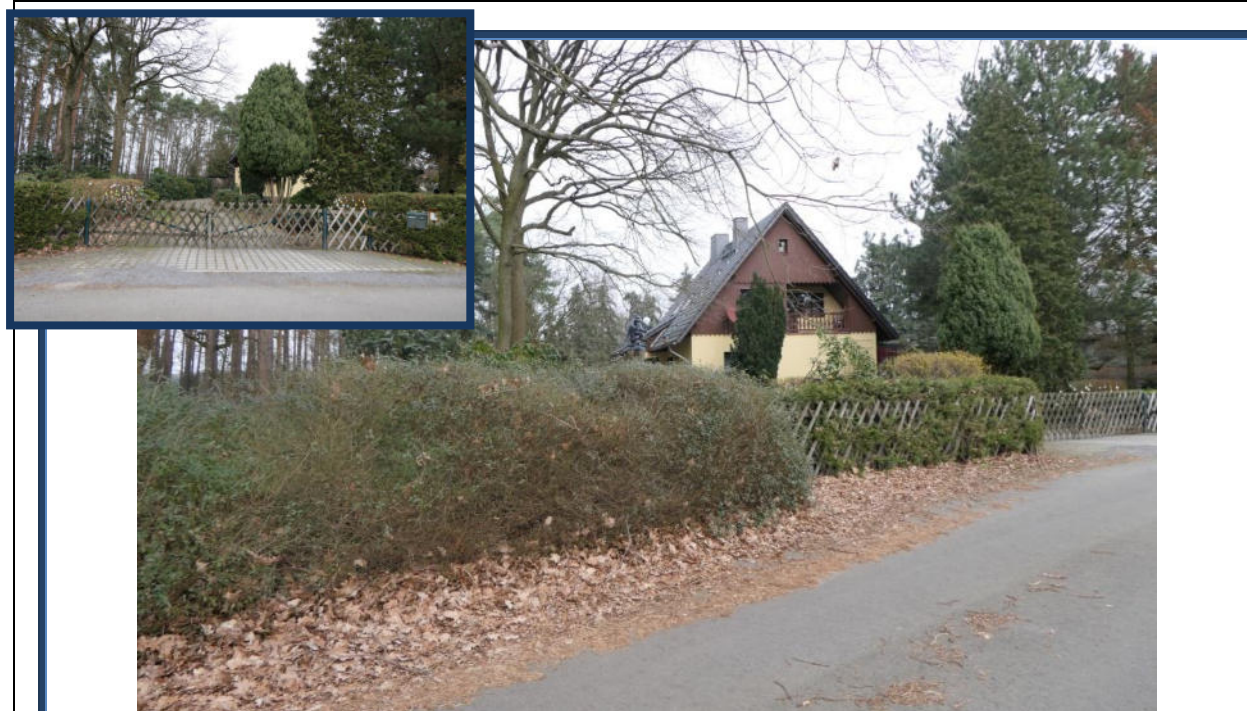
Abbildung 24: Blick in östliche Richtung vom Spreewitzer Weg; Einfahrtbereich