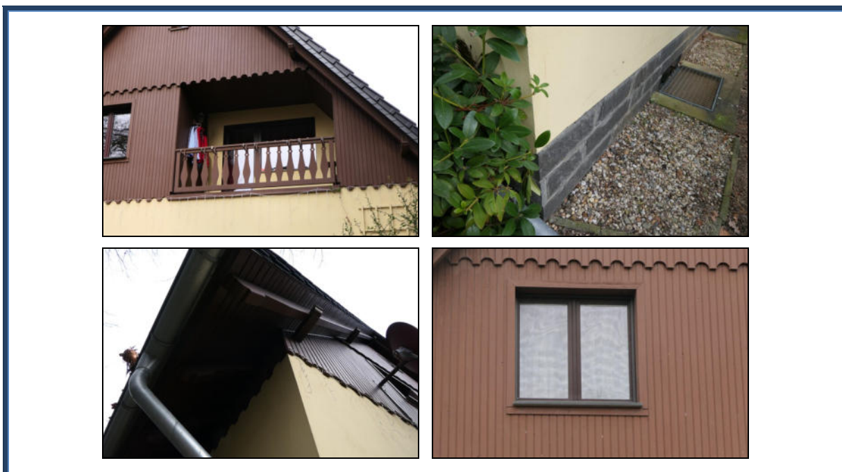
Abbildung 8: Detailansichten