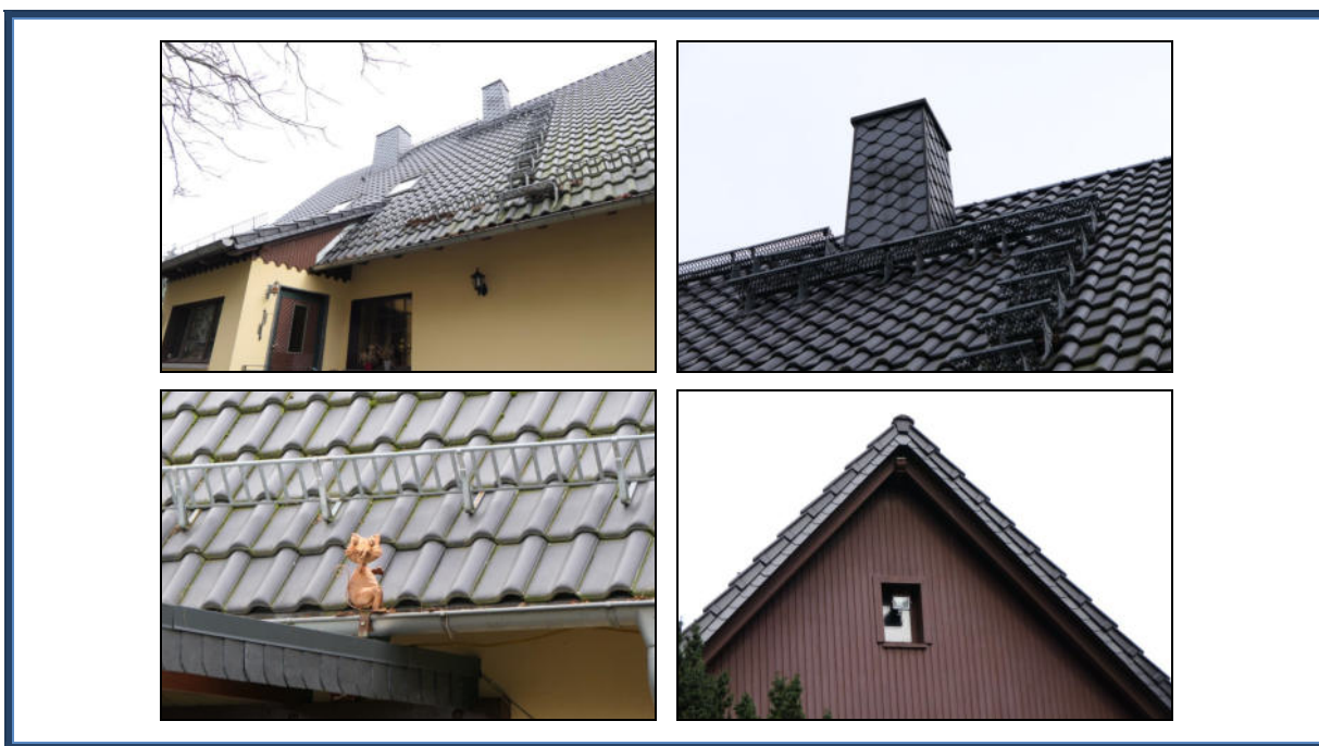
Abbildung 7: Detailansichten