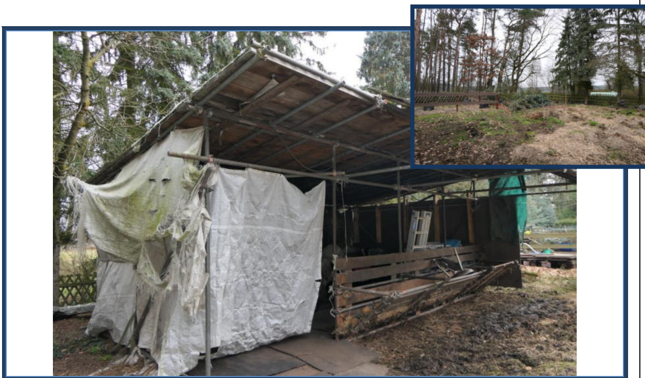
Abbildung 14: Einfaches Stallgebäude/Heulager; Außenanlagen; umliegende Nutzung