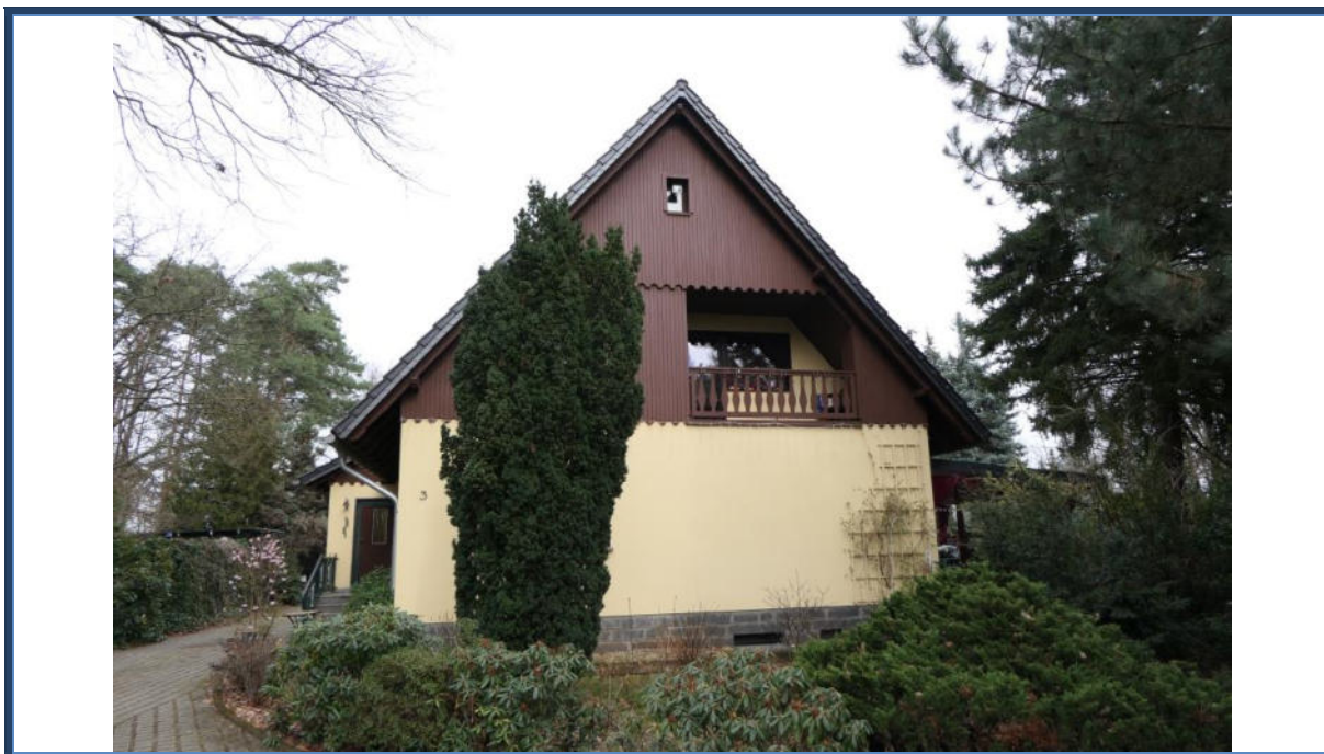
Abbildung 1: Straßenansicht (Süd-Ansicht); links der Einfahrtsbereich; Außenanlagen