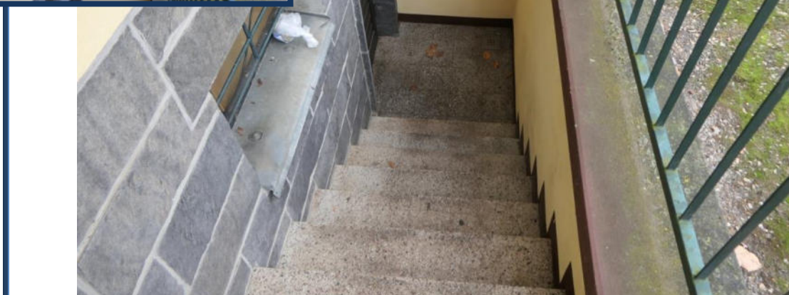
Abbildung 6: Treppe zum Keller (Nordseite)