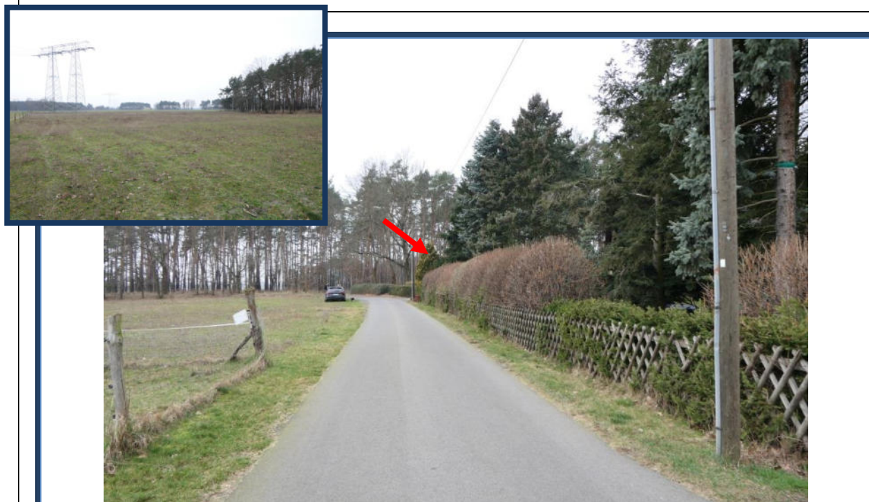
Abbildung 26: Blick in westliche Richtung in den Spreewitzer Weg; rechts das Bewertungsobjekt; umliegende Nutzung