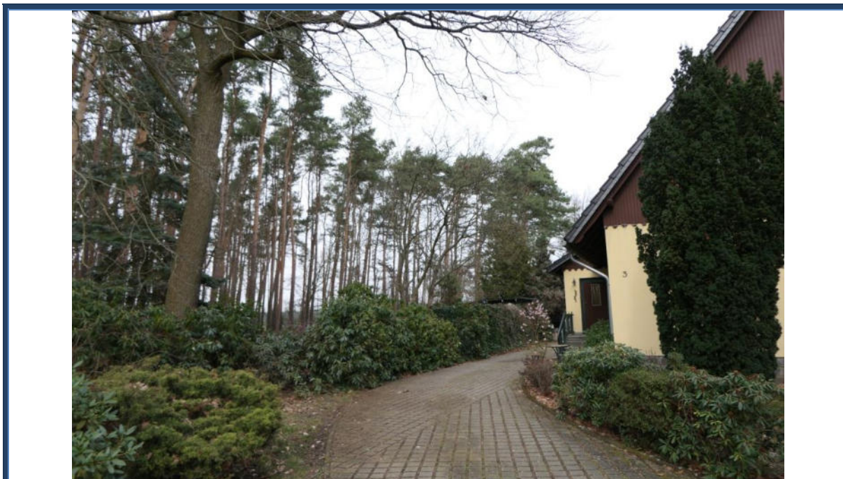
Abbildung 22: Blick in nördliche Richtung; Einfahrtsbereich; Außenanlagen