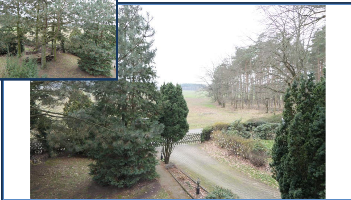
Abbildung 17: Blick aus dem Dachgeschoss in südliche Richtung zum Einfahrtsbereich; Außenanlagen; umliegende Nutzung