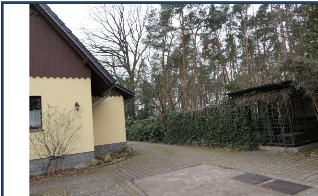
Abbildung 16: Zufahrtbereich; rechts ein Hundezwinger (Überbauproblematik); Außenanlagen