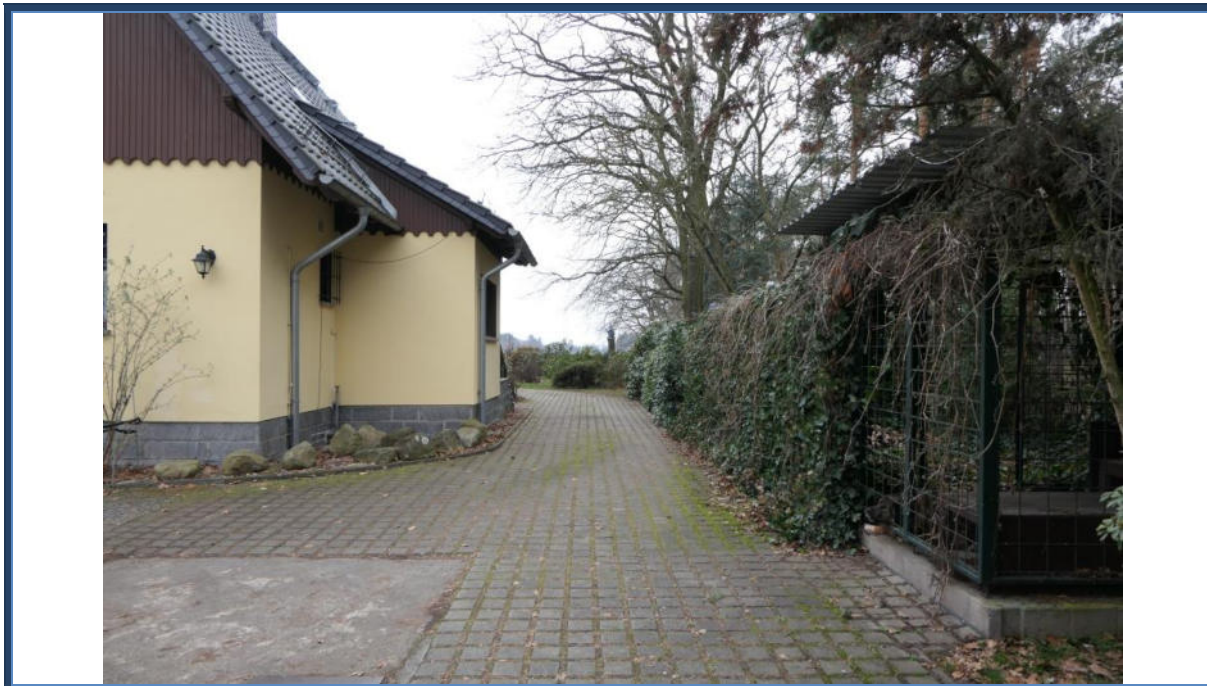
Abbildung 21: Blick in südliche Richtung; Einfahrtsbereich; Außenanlagen