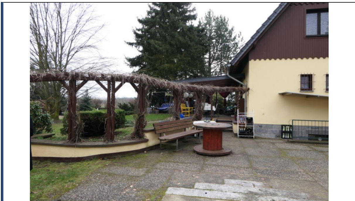
Abbildung 20: Außenanlagen; rechts das Wohnhaus