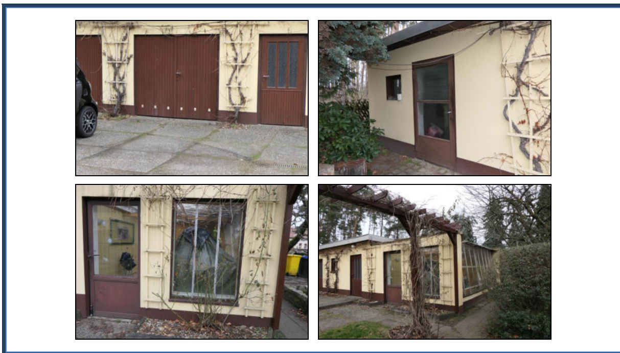
Abbildung 11: Detailansichten (Mehrzweckgebäude)