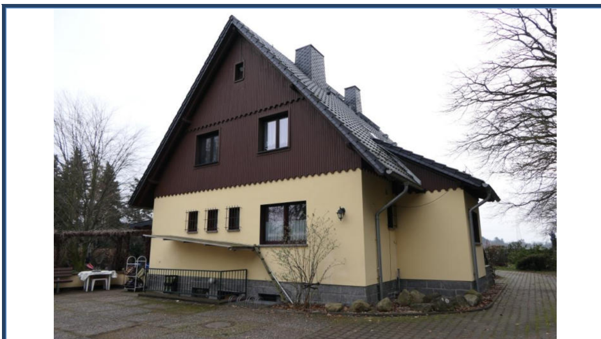
Abbildung 4: Rückansicht (Nord-Ansicht); rechts der Eingangsanbau und die Grundstückszufahrt; Außenanlagen