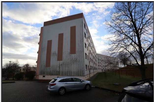
Nord-Ansicht des Wohnblockes