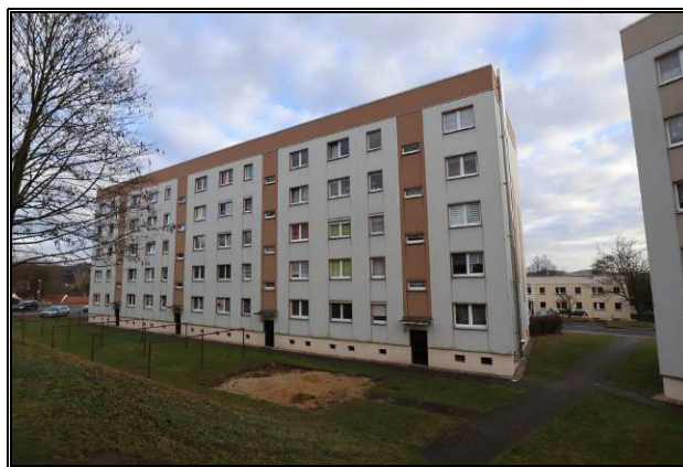
West-Ansicht des Wohnblockes