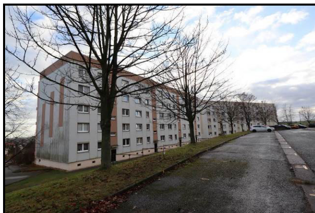
Nord-West-Ansicht des Wohnblockes