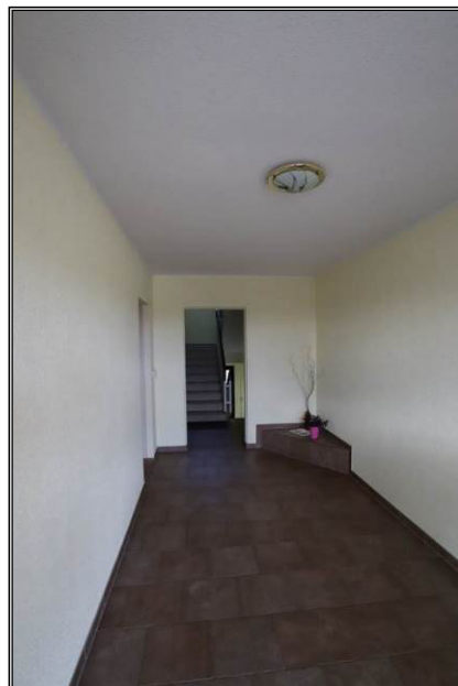
Teil des Eingangsbereichs