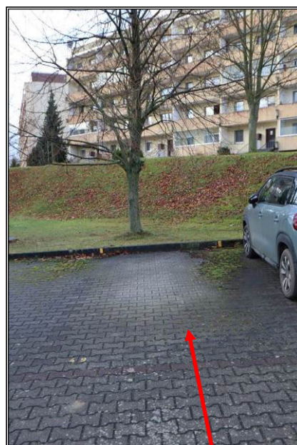
Stellplatz Nr. 49