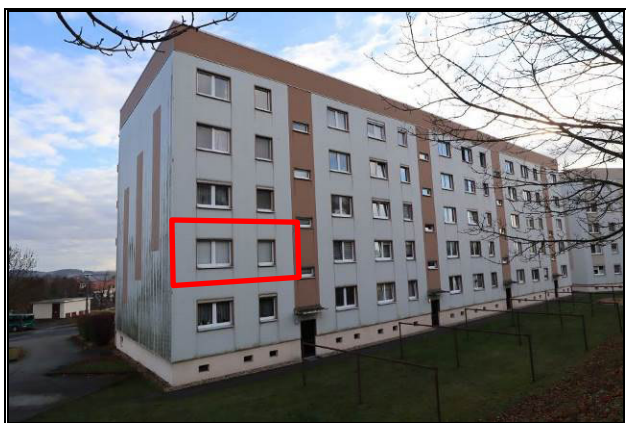
Nord-West-Ansicht des Wohnblockes; Wohnung Nr. 04