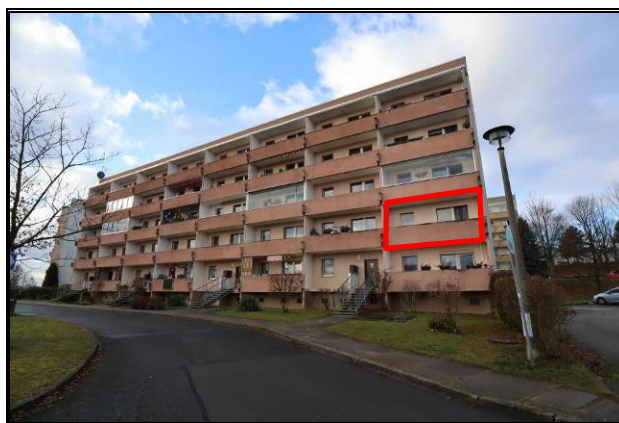
Ost-Ansicht des Wohnblockes; Wohnung Nr. 04