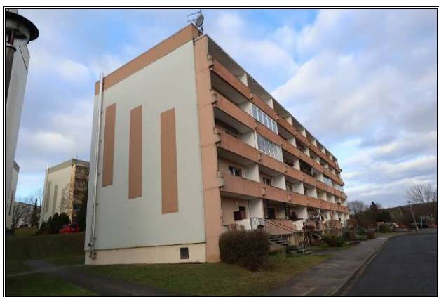
Süd-Ost-Ansicht des Wohnblockes