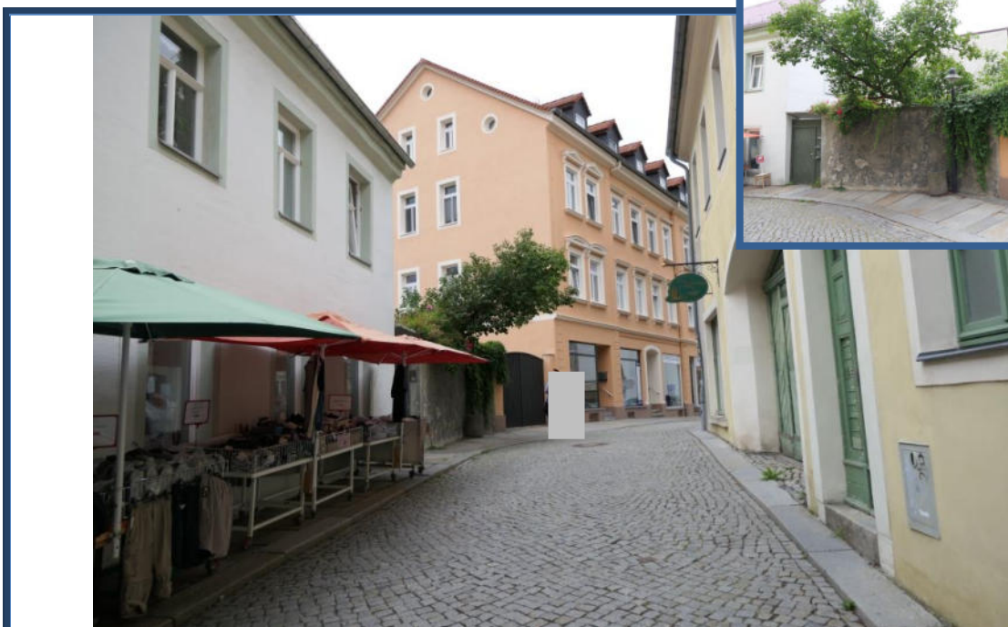
Abbildung 10: Blick in die Klosterstraße in nördliche Richtung; umliegende Bebauung