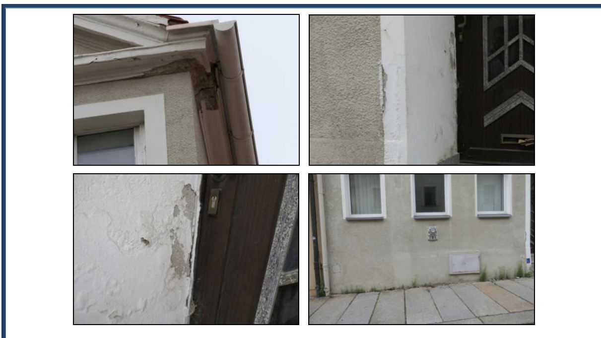
Abbildung 4: Detailansichten der Schäden an der Fassade