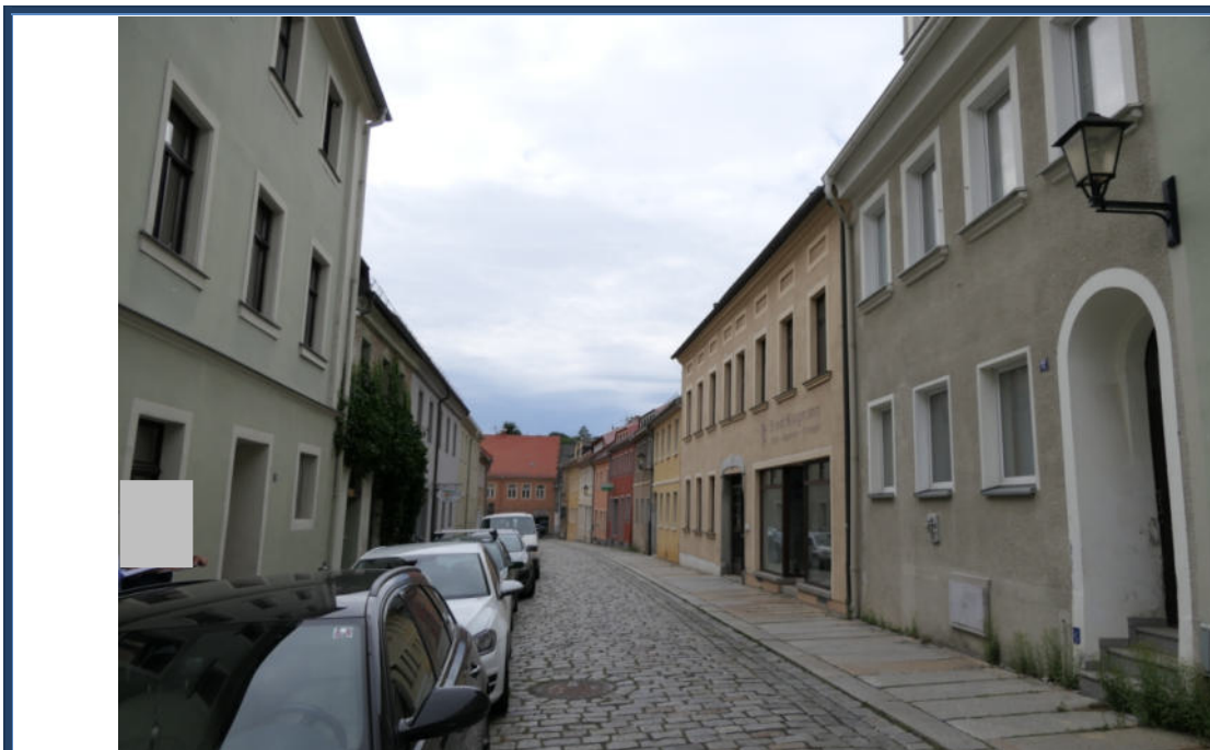
Abbildung 5: Blick in die Theaterstraße in westliche Richtung; rechts das Bewertungsobjekt; angrenzende und umliegende Bebauung