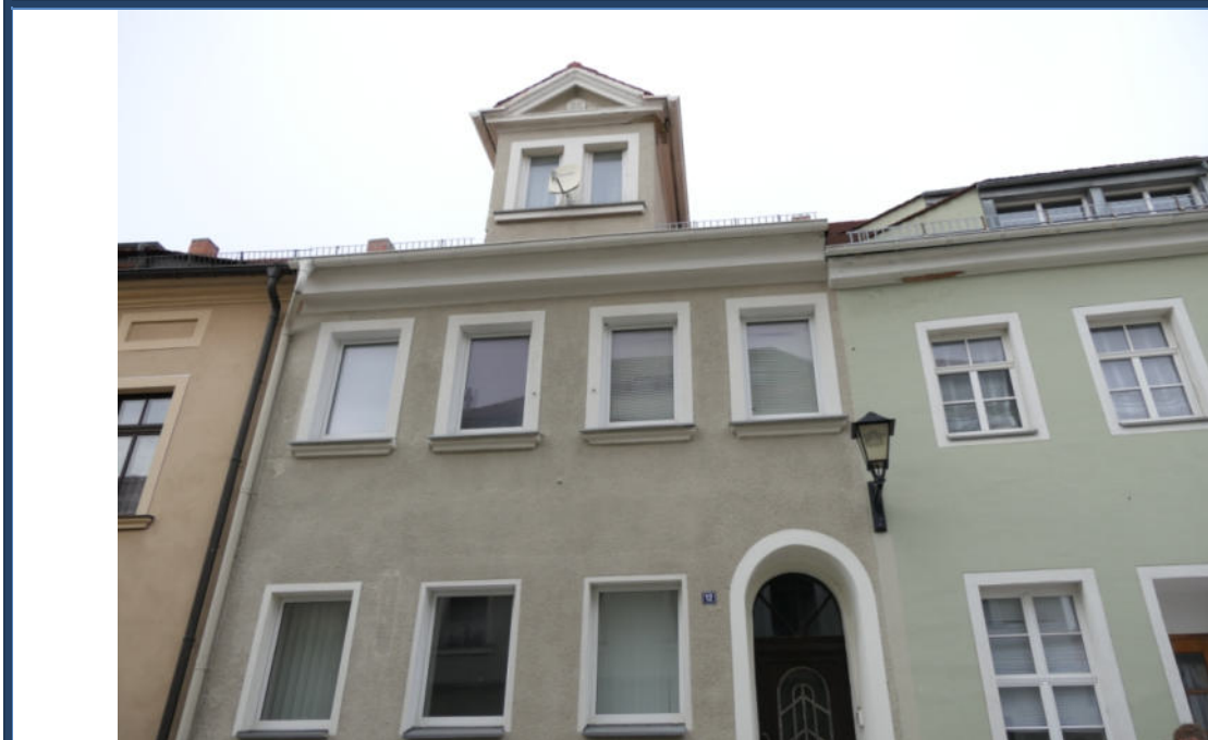
Abbildung 1: Straßen-/Vorderansicht (Süd-Ansicht); angrenzende Bebauung