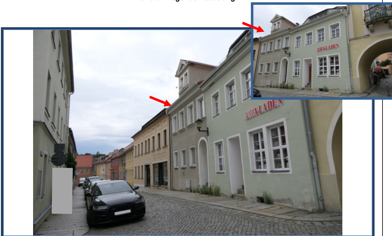
Abbildung 6: Blick in die Theaterstraße in westliche Richtung; rechts das Bewertungsobjekt; angrenzende und umliegende Bebauung