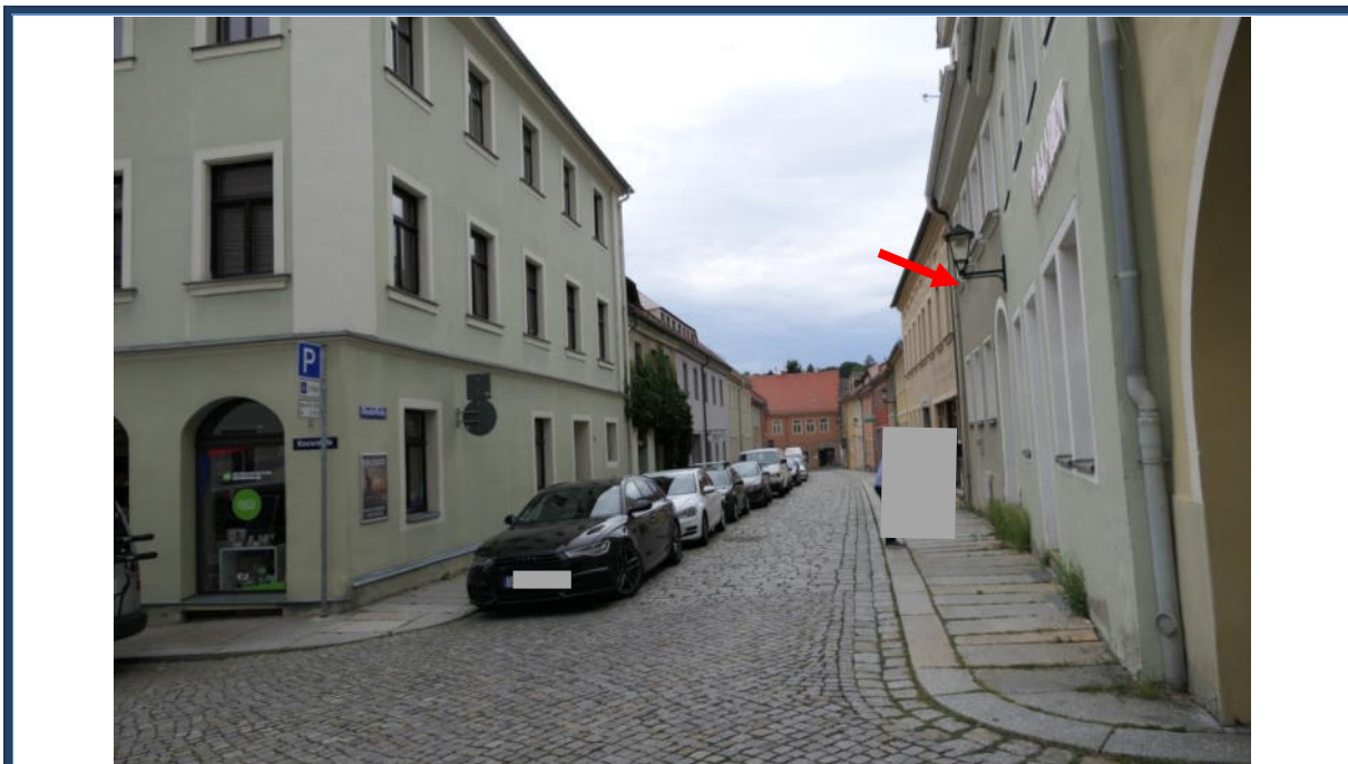
Abbildung 7: Blick in die Theaterstraße in westliche Richtung; Kreuzungsbereich der Theaterstraße und Klosterstraße; rechts das Bewertungsobjekt; umliegende Bebauung