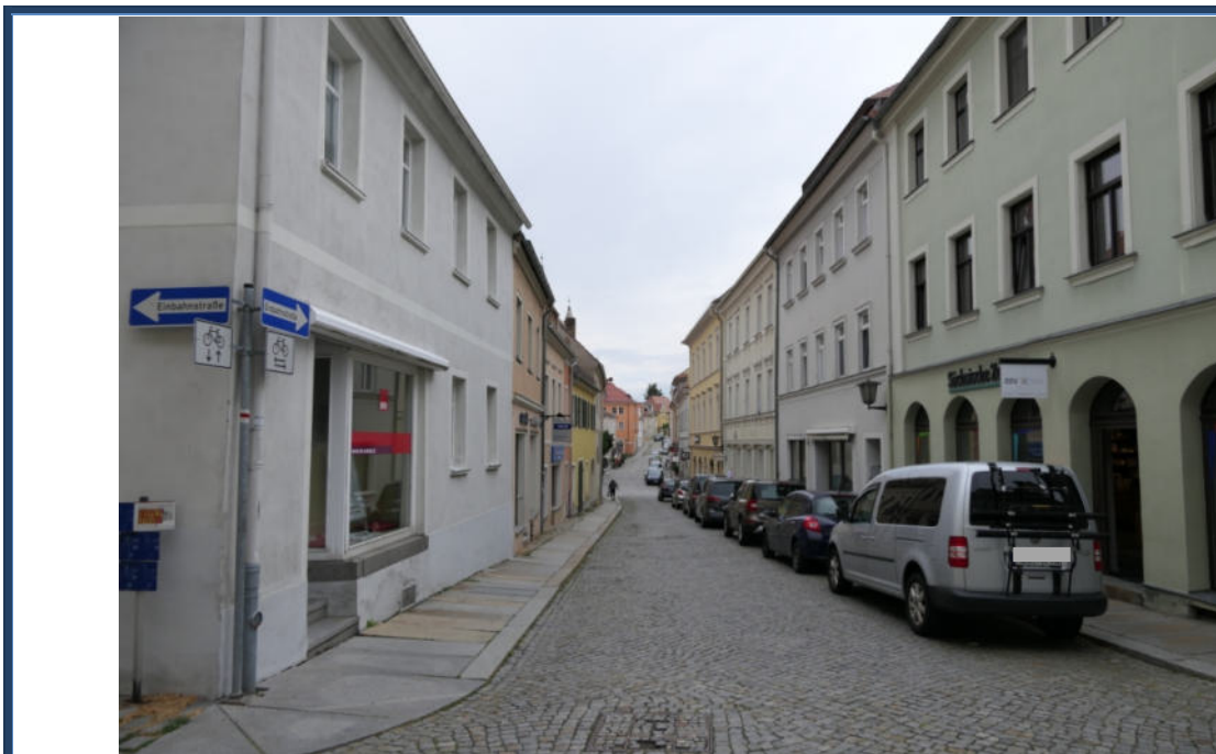
Abbildung 9: Blick in die Klosterstraße in südliche Richtung; umliegende Bebauung