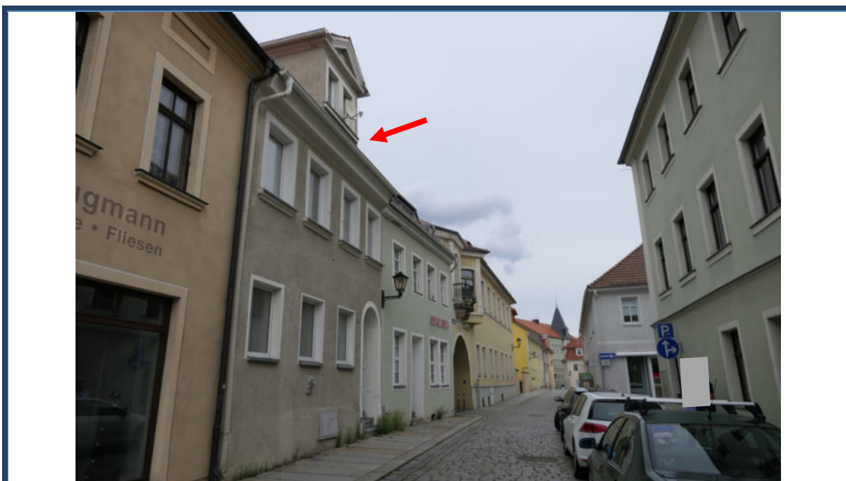
Abbildung 8: Blick in die Theaterstraße in östliche Richtung; links das Bewertungsobjekt; angrenzende und umliegende Bebauung