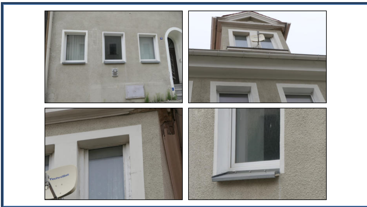
Abbildung 3: Detailansichten