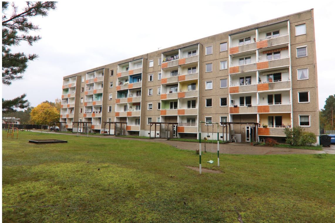
Blick in östliche Richtung auf die westliche Längsseite des Mehrfamilienwohnhauses Trebuser Straße 15 - 19 in Rothenburg/O.L. OT Uhmansdorf, in dem sich die Wohnung W 4.04 befindet

Im vorliegenden Fall ist die ca. 57,29 m 2 große Drei-Raum-Wohnung W 4.04 des Mehrfamilienwohnhauses Trebuser Straße 15 bis 19 in Rothenburg/O.L. OT Uhmansdorf zu bewerten. Die Wohnung liegt im 4. Obergeschoss des Aufgangs Nr. 16.