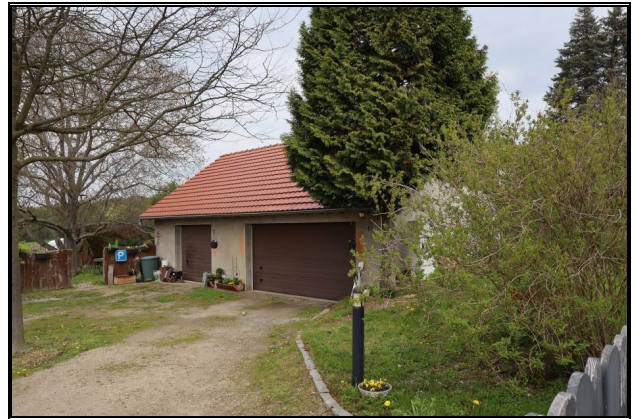
Süd-Ost-Ansicht des Garagengebäudes