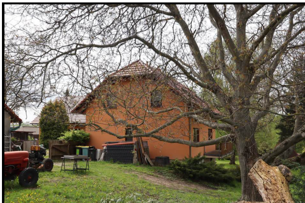
Nord-Ansicht des Wohnhauses Nr. 3b