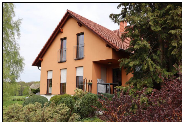
Süd-Ost-Ansicht des Wohnhauses Nr. 3c