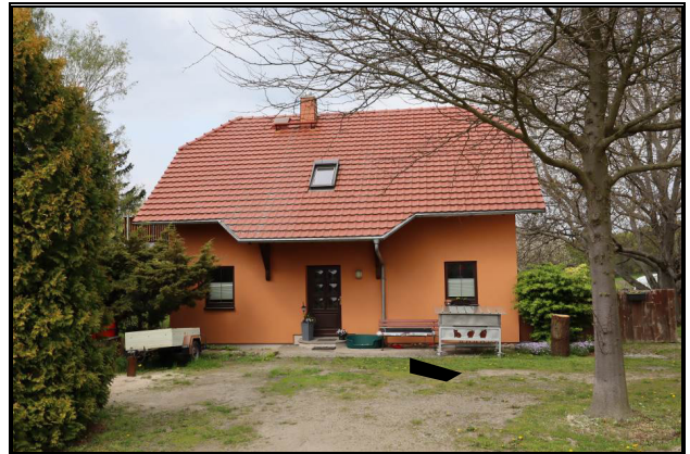
Ost-Ansicht des Wohnhauses Nr. 3b