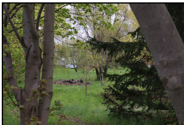
Teil der westlichen Außenanlagen mit Altreifenablagerung (Teilbereich B)