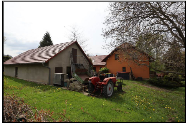
Nord-Ansicht des Garagengebäudes und des Wohnhauses Nr. 3b