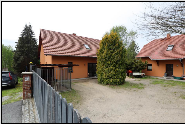
Nord-Ost-Ansicht des Bewertungsgrundstücks mit Wohnhaus Nr. 3c (links) und Wohnhaus Nr. 3b (rechts)