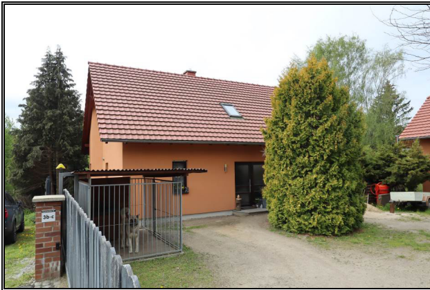
Nord-Ost-Ansicht des Wohnhauses Nr. 3c