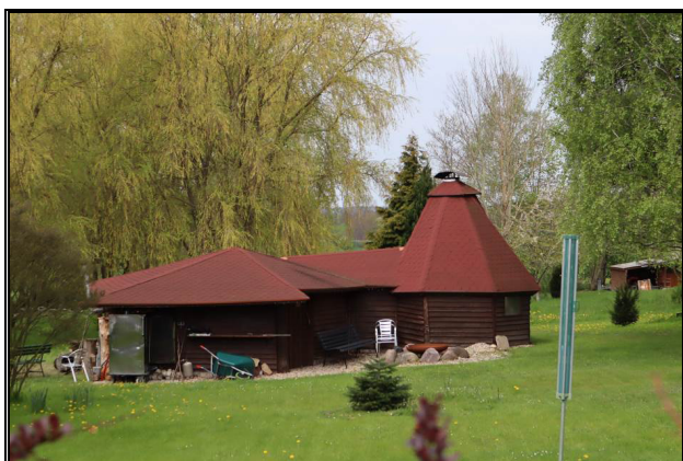
Ost-Ansicht des Nebengebäudes