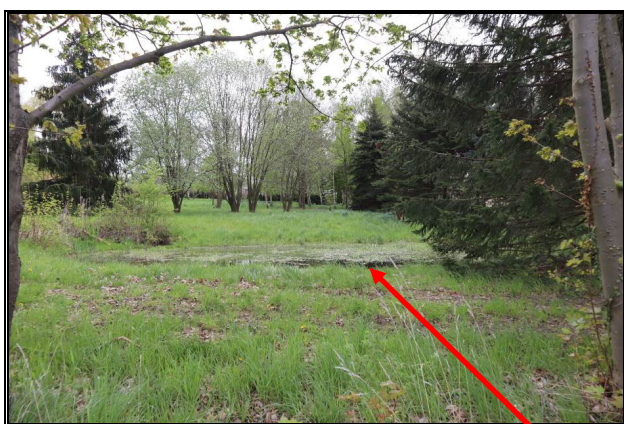
Teil der südwestlichen Außenanlagen mit kleinem Teich (Teilbereich B)