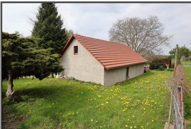
Nord-Ost-Ansicht des Garagengebäudes