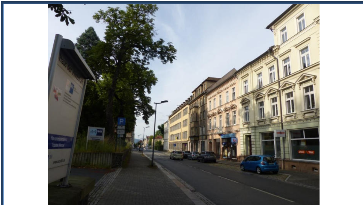
Abbildung 9: Blick in südliche Richtung in die Bahnhofstraße; rechte (nicht im Bild) das Bewertungsgrundstück; umliegende Bebauung und Nutzungen