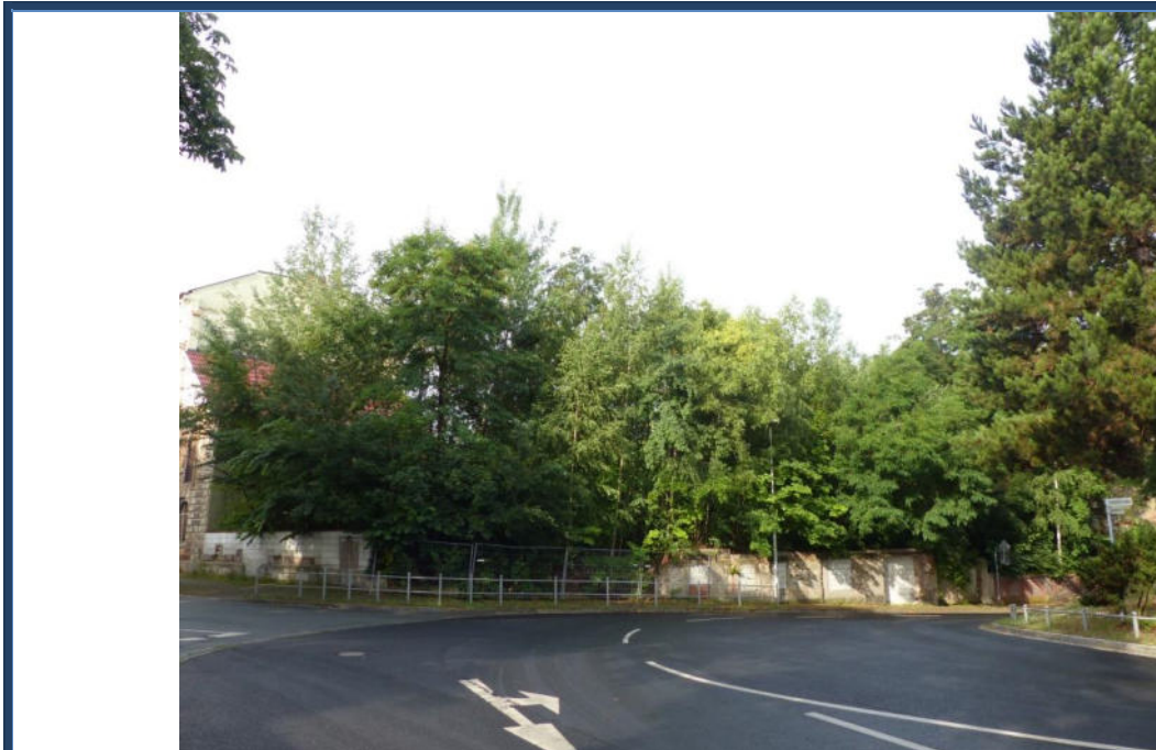
Abbildung 1: Blick in südwestliche Richtung zum Bewertungsobjekt (mittig); Kreuzungsbereich der Bahnhof- und Eisenbahnstraße; teilweise Restmauern und provisorische Stützmauer; stark verwilderte Außenanlagen; angrenzende Bebauung