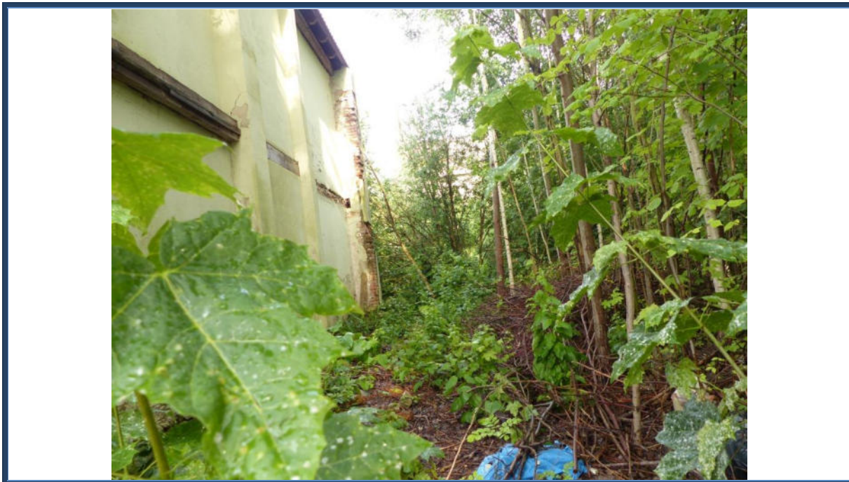
Abbildung 7: Starke Verwilderung; tlw. Gebäudereste; vermutlich Teile des Kellerschosses noch vorhanden und mit Bauschutt verfüllt; tlw. Müllablagerungen