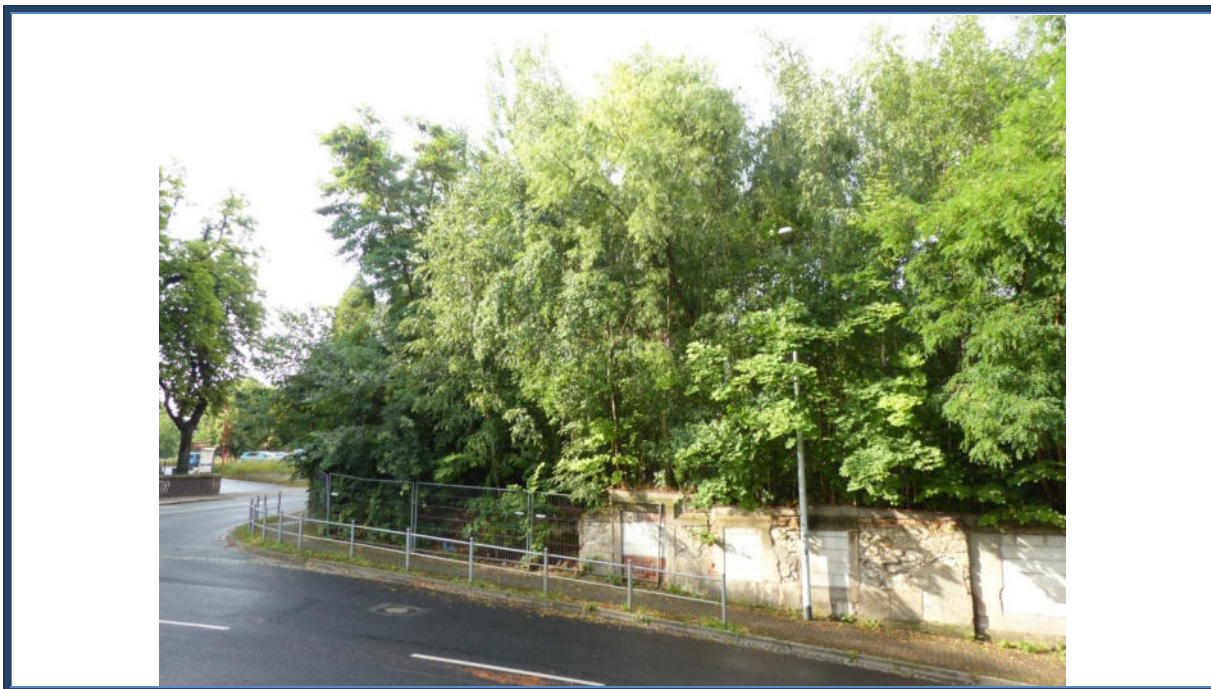
Abbildung 5: Blick in südliche Richtung zum Bewertungsobjekt; links Kreuzungsbereich der Bahnhof- und Eisenbahnstraße; teilweise Restmauern und provisorische Stützmauer; stark verwilderte Außenanlagen