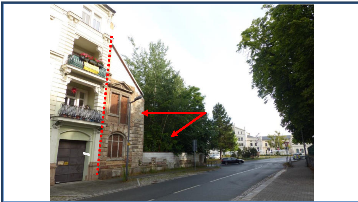
Abbildung 3: Blick in nördliche Richtung; links das Bewertungsobjekt; teilweise Restbebauung bzw. Restmauern und provisorische Stützmauer; stark verwilderte Außenanlagen; im Hintergrund der Bahnhof von Zittau; angrenzende Bebauung