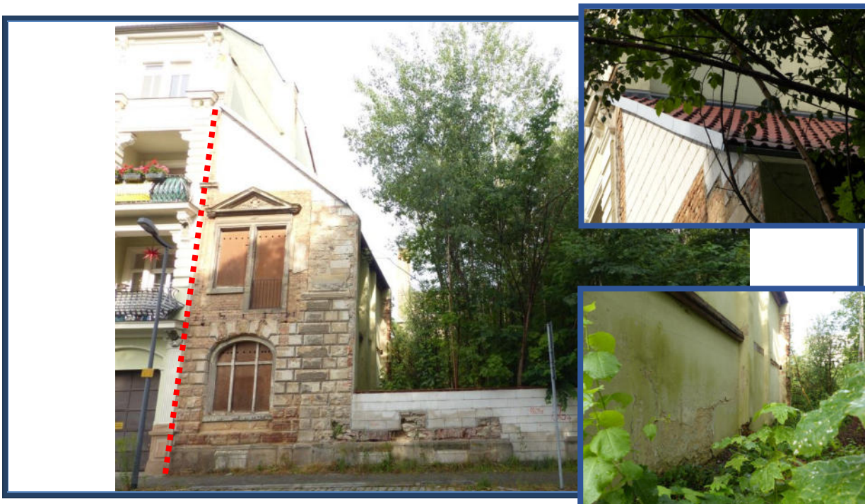
Abbildung 4: Blick in westliche Richtung zum Bewertungsobjekt; teilweise Restbebauung bzw. Restmauern und provisorische Stützmauer; stark verwilderte Außenanlagen; angrenzende Bebauung