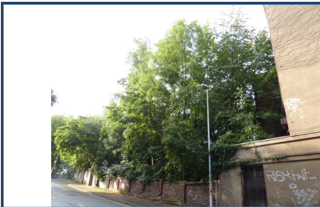
Abbildung 2: Blick in südöstliche Richtung zum Bewertungsobjekt; teilweise Restmauern und provisorische Stützmauer; stark verwilderte Außenanlagen; angrenzende Bebauung