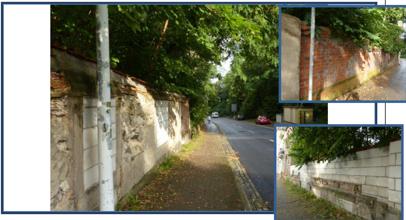
Abbildung 6: Detailansichten der Restmauern und der provisorischen Stützmauer