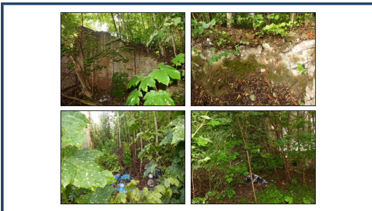
Abbildung 8: Starke Verwilderung; tlw. Gebäudereste; vermutlich Teile des Kellerschosses noch vorhanden und mit Bauschutt verfüllt; tlw. Müllablagerungen