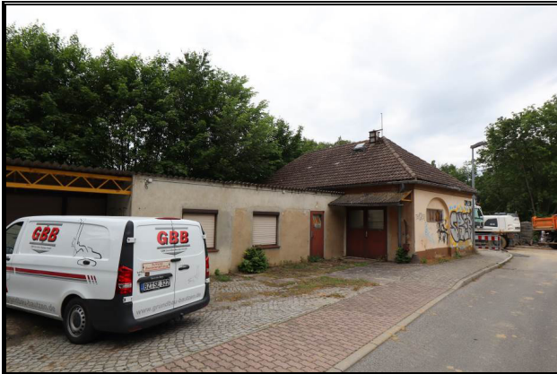
Süd-Ost-Ansicht des Bewertungsobjekts