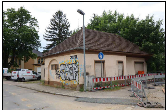
Nord-Ost-Ansicht des Bewertungsobjekts