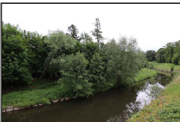
Blick zum Teilgrundstück 1 (Nord-West-Ansicht) – Uferböschungfläche und Teil der Spree