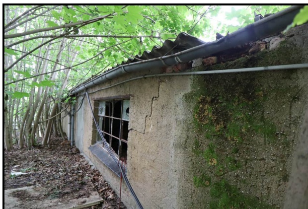
Teil der Gebäudewestseite