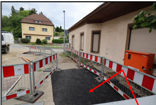
Nord-West-Ansicht des Bewertungsobjekts; Teil des Teilgrundstücks 2