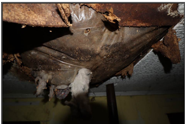
heruntergebrochene Decke mit möglichem Schwammbefall