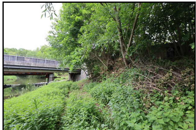
Teil der westlichen Außenanlagen (Süd-Ansicht) – Uferböschungfläche