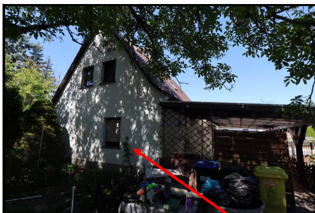
Südansicht des Bewertungsobjekts; provisorische Wasser- und Stromleitung