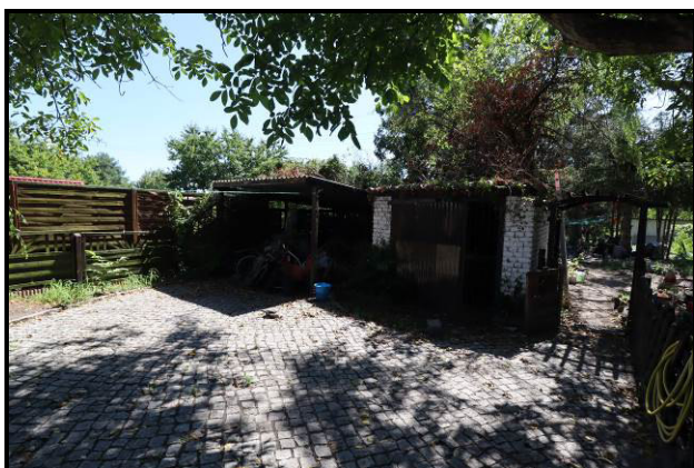
Nord-West-Ansicht des Carports und des Hundezwingers