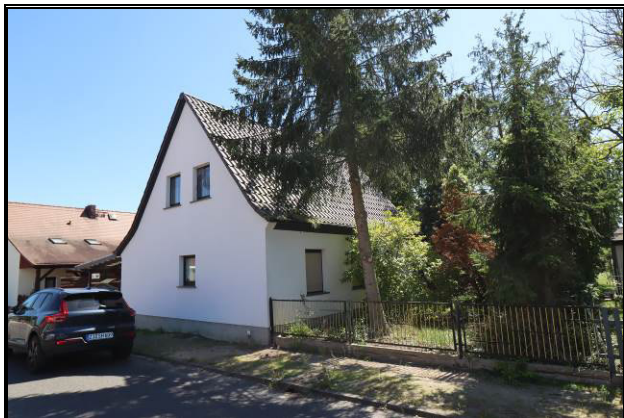
Nord-West-Ansicht des Bewertungsobjekts