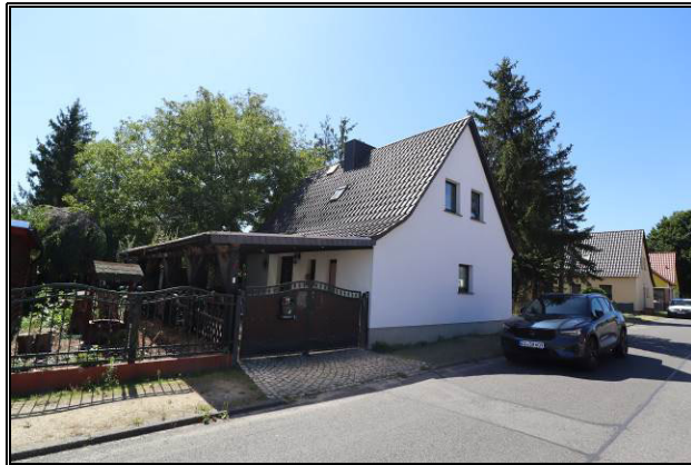
Nord-Ost-Ansicht des Bewertungsobjekts