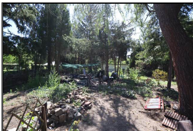
Nordansicht des Gartens; Gartenteich mit Brücke