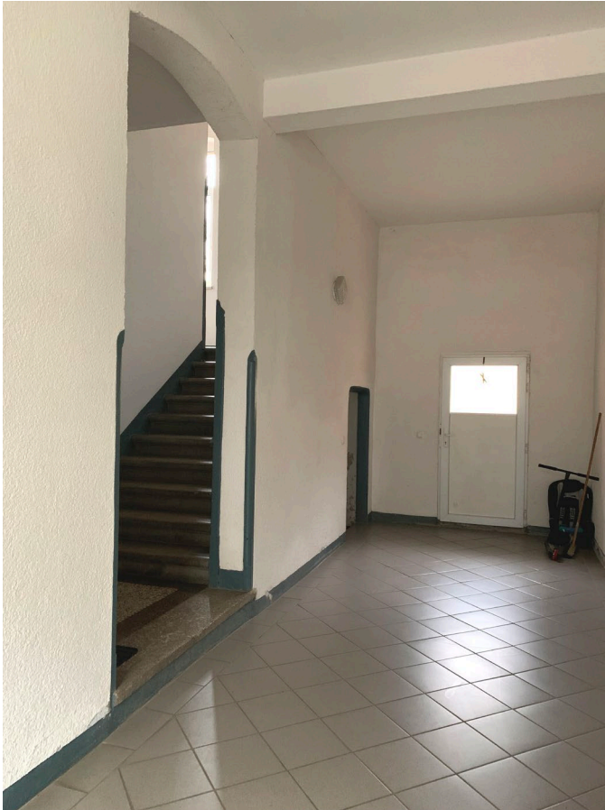
Abb. 04 Ansicht Hausflur im Erdgeschoss mit Blick zur Ausgangstür zum Garten und Geschosstreppe zu Obergeschoss, links vom Hausflur

Az.: 11 K 109/22, Wohnung Nr. 4, Stöckigter Str. 7, 08527 Plauen