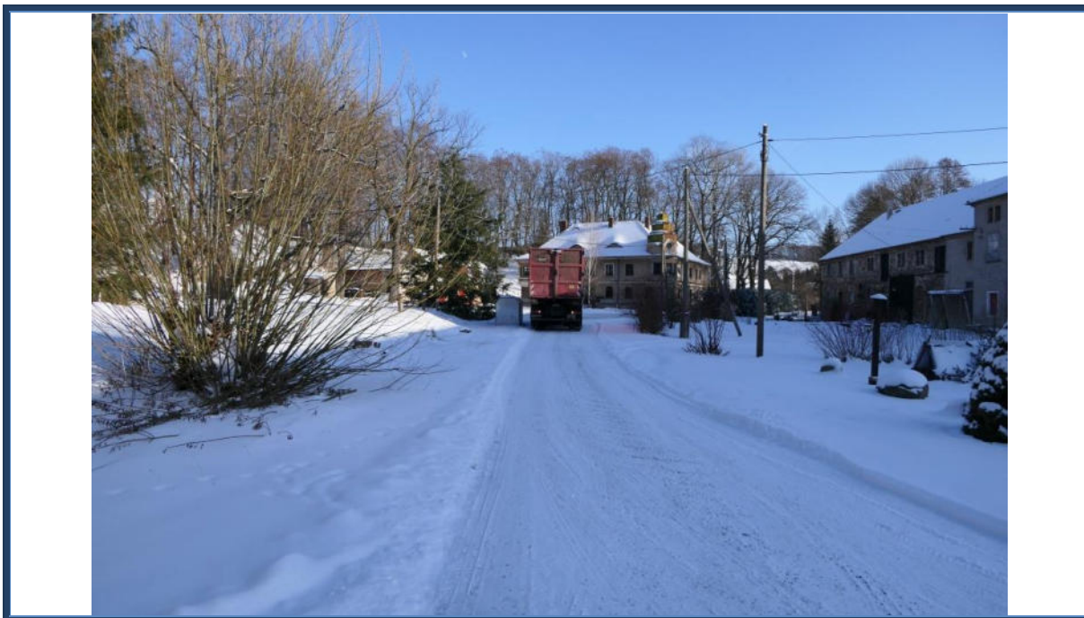
Abbildung 5: Blick in östliche Richtung zur Straße "Am Gut"; Zufahrt zum Bewertungsobjekt; umliegende Bebauung