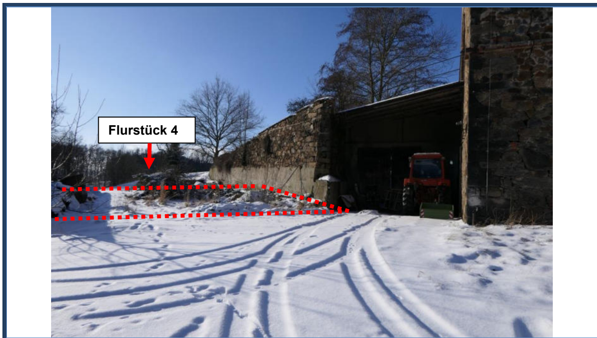
Abbildung 1: Blick in südwestliche Richtung, rechts die Tennenauffahrt und das Scheunengebäude auf dem benachbarten Flurstück 139/5