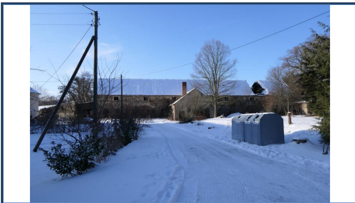
Abbildung 6: Blick in westliche Richtung von der Straße "Am Gut"; Zufahrt zum Bewertungsobjekt