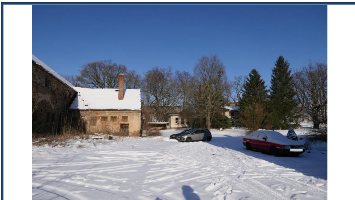
Abbildung 4: Blick in nördliche Richtung zum Zufahrtbereich der Straße "Am Gut"; links das Scheunengebäude auf dem benachbarten Flurstück 139/5; umliegende Bebauung und Nutzung