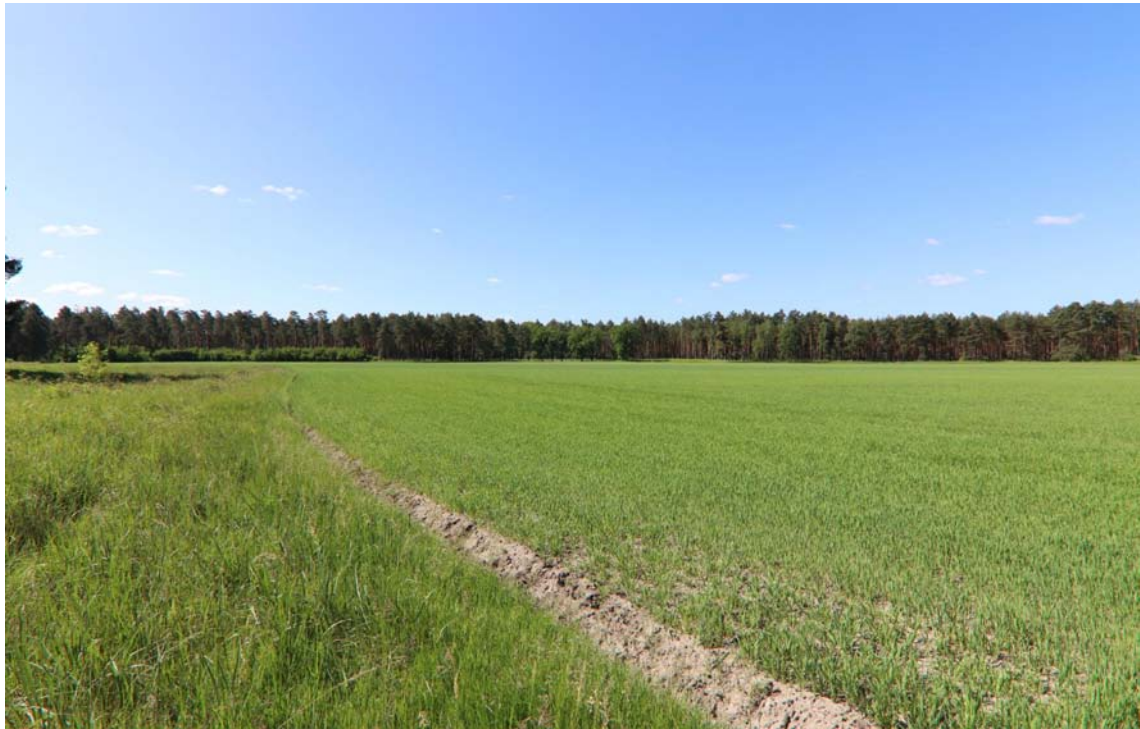
Blick in südliche Richtung über die als Acker genutzten Flurstücke 35 und 45 in Nochten.

Es handelt sich im vorliegenden Fall um die in Boxberg/O.L. OT Nochten gelegenen Flurstücke 35 und 45 in der Nähe der Bahnlinie Zittau-Cottbus und nicht weit entfernt vom Truppenübungsplatz Oberlausitz. Es handelt sich um Ackerflächen, die zusammen 14.379 m 2 groß sind.