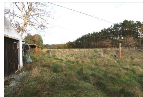
Blick in den östlichen Grundstücksbereich, welcher als naturbelassene Grünfläche ausgeführt ist