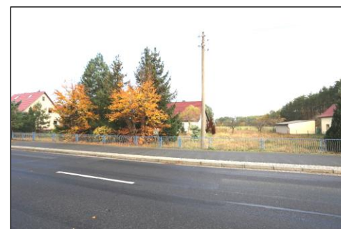
Blick aus westlicher Richtung auf das Bewertungsgrundstück