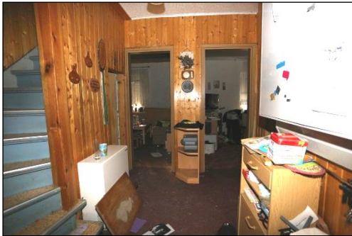
Blick vom Zwischenflur aus in die Diele des Wohnhauses