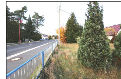
Ein entlang der Straße verlaufender Grundstücksstreifen ist im Eigentum der Gemeinde