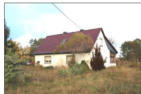
Blick aus südwestlicher Richtung auf die Fassaden des Einfamilienwohnhauses