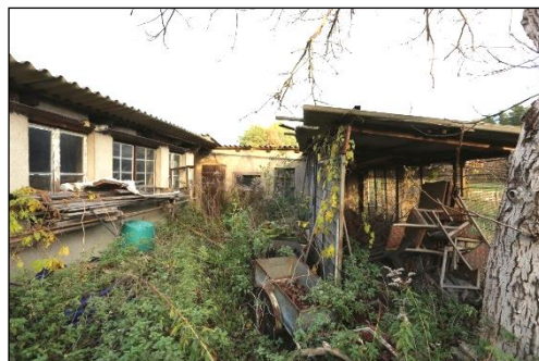
Blick auf die Nebengebäude, welche zur Ortsbesichtigung einen überwiegend technisch überalterten Zustand aufwiesen