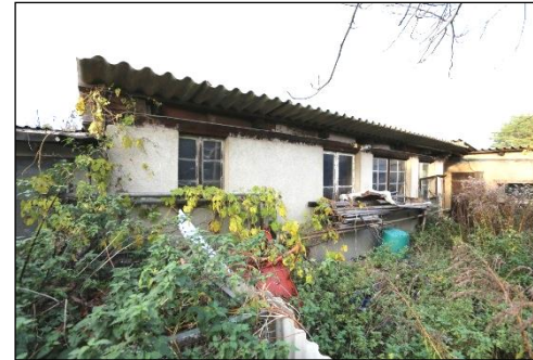
Diese baulichen Anlagen wurden ebenso zu Lager- und Abstellzwecken