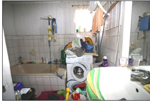
Blick vom Zwischenflur aus in das im Anbau gelegene Badezimmer