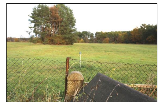
Die Hausanschlussleitungen für Trinkwasser und Abwasser verlaufen im Bereich der östlich angrenzenden Landwirtschaftsfläche