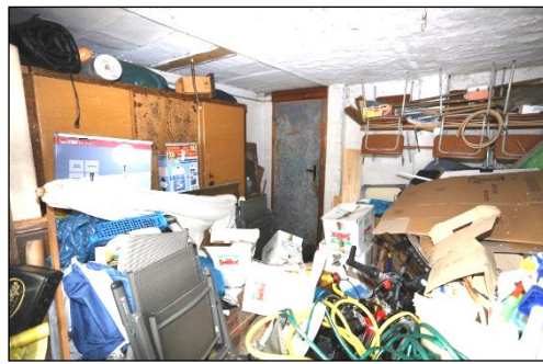
Blick in einen Schuppenraum mit Zugang in den Garagenraum