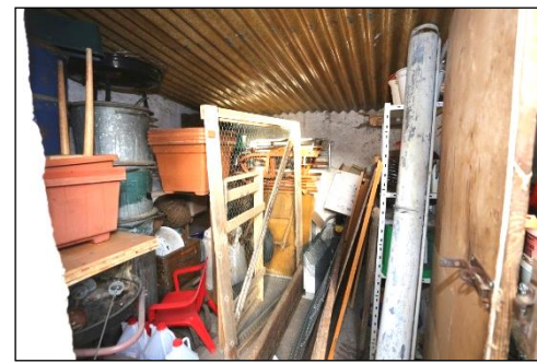
Blick in ein weiteres Nebengebäude welches zu Abstellzwecken genutzt wurde