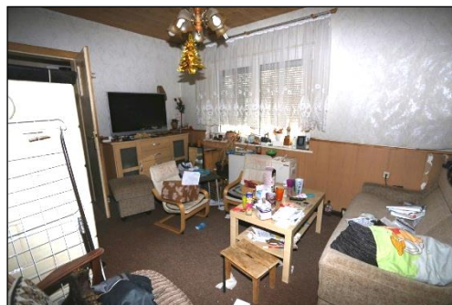
Blick von der Diele aus in einen weiteren Wohnraum im Erdgeschoss