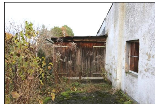
Blick in östliche Richtung von der Grundstückszufahrt aus auf den Garagenanbau