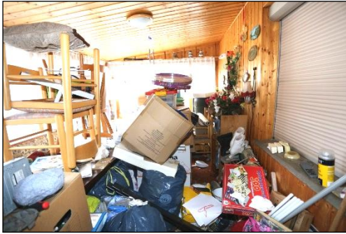
Blick vom Hauseingangsbereich aus in die im Anbau gelegene Veranda