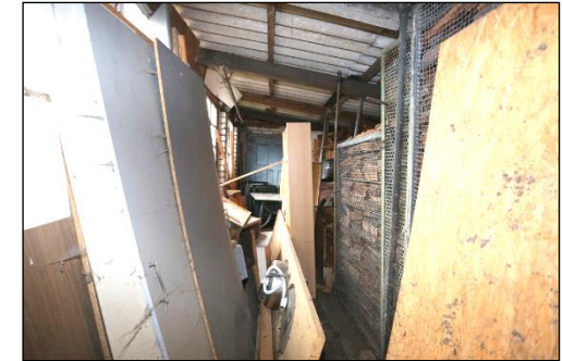
Blick in eines dieser Nebengebäude, welches teilweise als Brennholzlager genutzt wurde