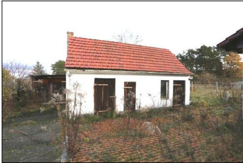
Blick auf ein massives Nebengebäude mit mehreren Schuppen- und einem Garagenraum