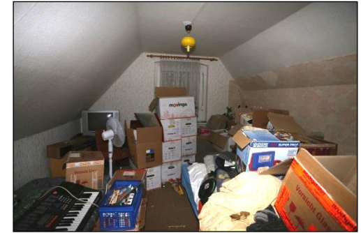
Blick in einen von zwei gegenüber angeordneten Wohnräumen im Dachgeschoss