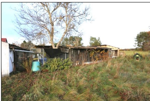
Im nordöstlichen Grundstücksbereich sind weitere Nebengebäude in einen separat eingefriedeten Bereich angeordnet