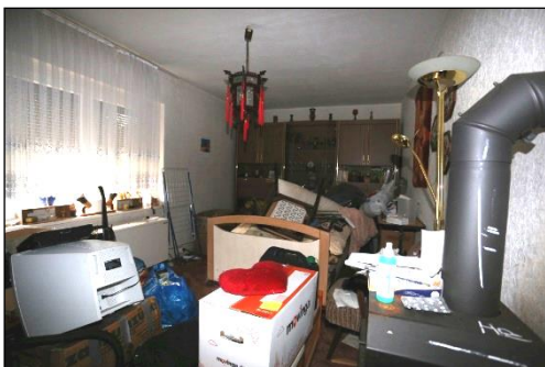
Blick in einen Wohnraum im Erdgeschoss