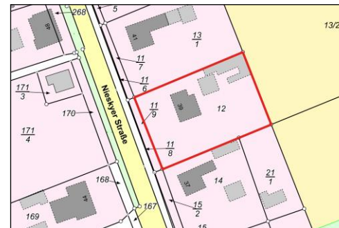
Auszug aus der Liegenschaftskarte