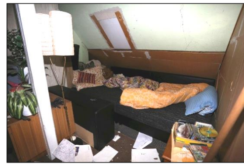
Blick in den zwischen den Wohnräumen angeordneten Flurbereich im Dachgeschoss