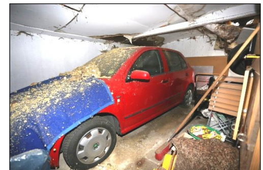
Blick in den Garagenanbau