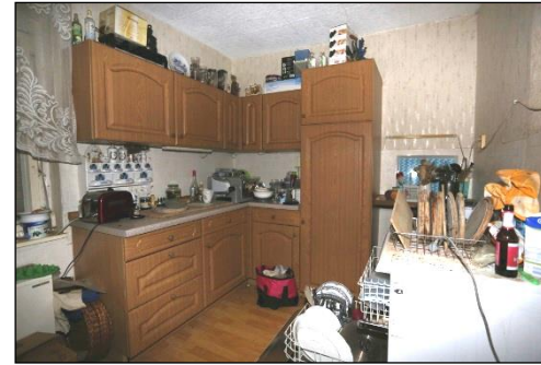
Blick in die vom Wohnzimmer aus zugängliche Küche