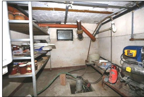
Blick in einen Kellerraum. Das Gebäude ist nur geringfügig bzw. ca. 12% unterkellert