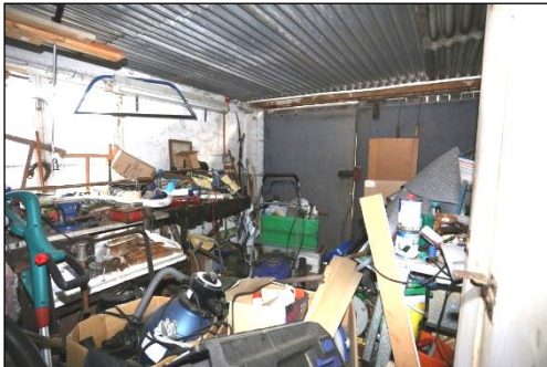
Blick in den Garagenraum