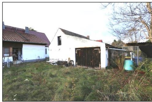
Blick auf die südlich ausgerichtete Giebelseite des Schuppen- und Garagengebäudes