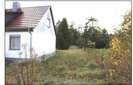
Blick in westliche Richtung auf die Grundstücks- bzw. Garagenzufahrt