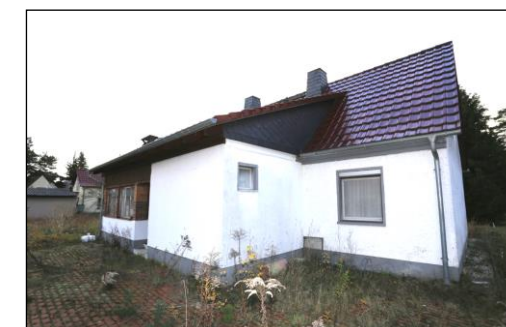
Blick aus nördlicher Richtung auf die Fassaden des Einfamilienwohnhauses