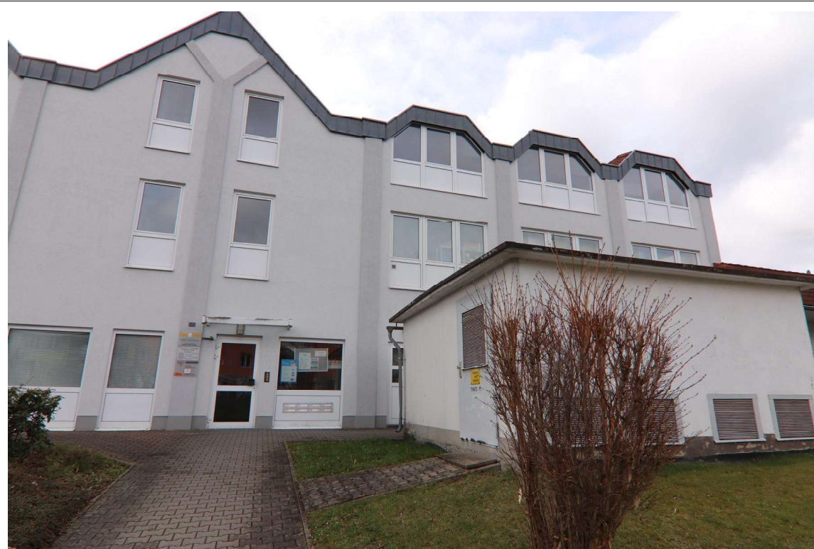
Blick in südliche Richtung auf das Bürogebäude, in dem sich die zu bewertende Büroeinheit Nr. 19 befindet.

Im vorliegenden Fall soll die Büroeinheit Nr. 19 des Einkaufs- und Gewerbecenters Oberer Viebig 2 b/2 c in Olbersdorf bewertet werden. Die Gewerbeeinheit liegt dabei im Bürotrakt des Gebäudes im 2. Obergeschoss links.