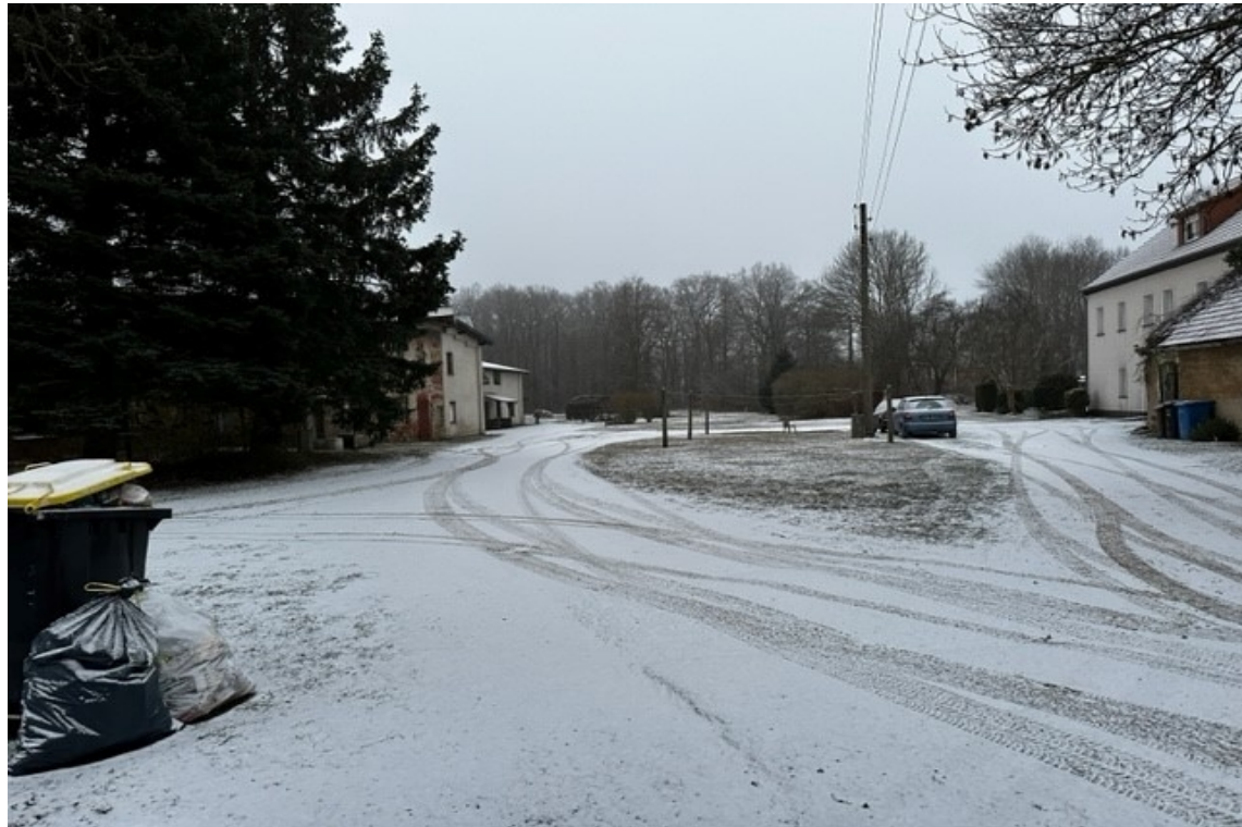
Blick in südliche Richtung entlang der Zufahrt auf dem Bewertungsflurstück 484 in Uhmansdorf.

Es handelt sich im vorliegenden Fall um ein Flurstück im östlichen Bereich von Rothenburg/O.L. OT Uhmansdorf. Die zu bewertende Fläche ist historisch als Zuwegung zu benachbarten Hofstellen entstanden. Auf diese Zufahrt sind aber auch einige andere Nachbargrundstücke angewiesen. Daher wurden für die einzelnen Anlieger Miteigentumsanteile in das Grundbuch eingetragen. Mit der Bodenreform wurde diese Unterteilung so nicht mehr vollständig benötigt und eine rechtlich klare Lösung wurde nicht verfolgt. So sind auch Nebengebäude von Nachbarn auf die Fläche gebaut worden. Im Rahmen eines Eigentumsübergangs müssten zur Klärung der rechtlichen Situation entweder die Flächen neu vermessen werden oder der Gebäudeabbruch wäre eine nahe liegende Variante.